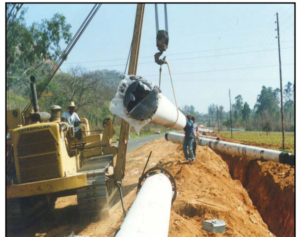
Figure 4: Mohlala wa ka moo dipeipi tša meetse di alwago ka gona.

Kgoro e tla tšwela pele go kgokagana le le baagišani ba naga ye ka nako ya thulaganyo le le go tsenywa tirišong ga ORWRDP go ya ka ditšhepedišo le dikwano tša boditshabatšhaba.