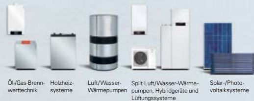
Öl-/Gas-Brennwerttechnik Holzheizsysteme Luft/Wasser-Wärmepumpen Split Luft/Wasser-Wärmepumpen, Hybrideräte und Lüftungssysteme Solar-/Photovoltaiksysteme

Viessmann steht für Höchstleistung: als offizieller Sponsor des Wintersports in den Bereichen Skispringen, Skilanglauf, Biathlon und Rennrodeln sowie Nordische Kombination. Denn bei der Entwicklung zukunftsweisender Heiztechnologie zählen die gleichen Werte, wie im Sport – Spitzentechnik, Effizienz, Fairness. Und natürlich der Erfolg, den wir allen Teilnehmern wünschen. www.viessmann.at