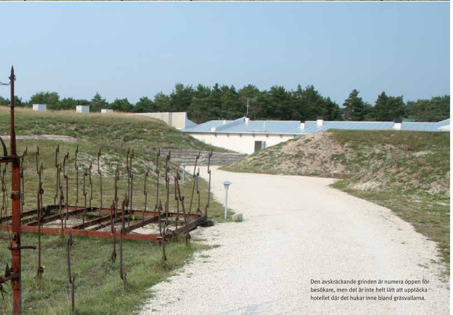
Den avskräckande grinden är numera öppen för besökare, men det är inte helt lätt att upptäcka hotellet där det hukar inne bland gräsvallarna.