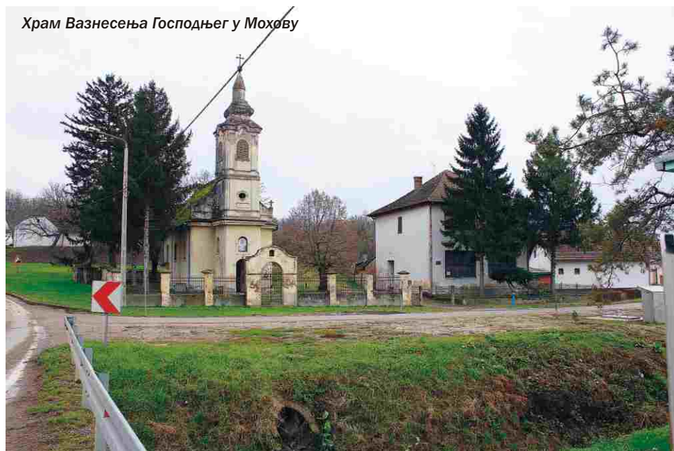
Храм Вазнесења Господњег у Мохову