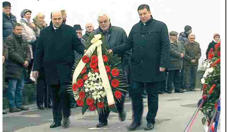
Делегација СДСС-а и ЗВО-а полаже венац код споменика на Батини

Забрињава чињеница да су водећи хрватски политичари на годишњицу једне од највећих битака 2. св. рата послали само изасланике. Никола Милојевић