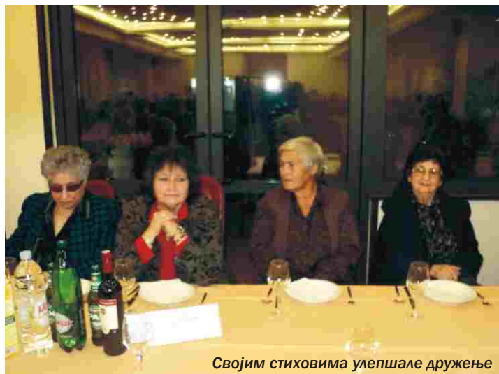
Својим стиховима улепшале дружење