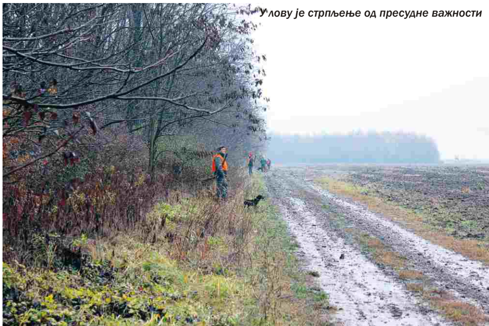
У лову је стрпљење од пресудне важности