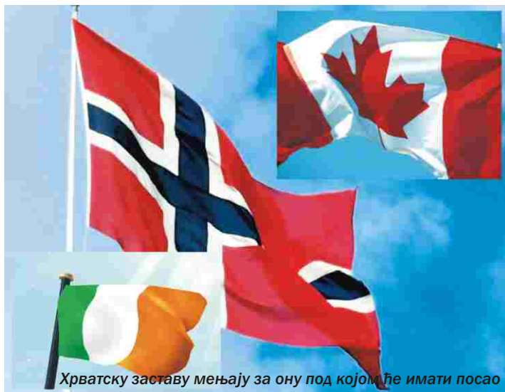
Хрватску заставу мењају за ону под којом ће имати посао

Многи су очекивали и веровали у обећања политичара да ће бити боље од 1. јула 2013. године, односно уласком Хрватске у Европску унију. Сада разочарано становништво одлази из свих делова Хрватске, али највише из оних мање развијених места. Српска заједница у Хрватској овај талас исељавања осетила је у великој мери. Да је незапосленост у српским општинама једна од највећих познато је свима па је у складу с тим и одлив српског становништва последњих годину дана огроман. Тачне податке о припадницима наше заједнице који су отишли, или то планирају да учине не поседујемо. Евидентно је да не постоји место у српским општинама из којих се није одселила барем једна породица. Велика разлика у поређењу на претходне таласе исељавања је што су овом миграцијом захваћени углавном млади високообразовани људи, па често у медијима чујемо за израз „одлив мозгова“. Сазнање да држава остаје без образованих људи и стручњака који су неопходни за напредовање и развој забрињава многе, али се решење да се ова појава