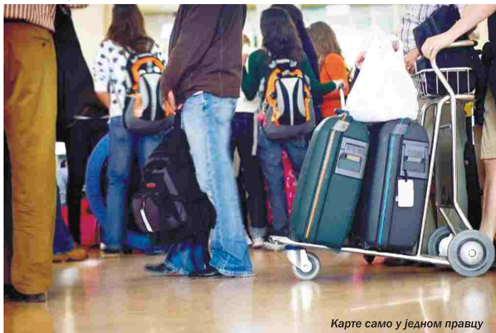
Карте само у једном правцу

У основи свега је материјална несигурност и глобална ситуација у којој се налази држава Хрватска. Незапосленост и мале плате приморавају већину становника земље на тешку одлуку одласка у непознато. Процењује се да је због економске кризе, Хрватску у задње три године, напустило између 60 и 70 хиљада грађана. Само током 2013. иселило се готово 15.000 људи. Према неким анкетама у овом тренутку 75 до 85 одсто младих жели да напусти Хрватску, а најчешћа одредишта су Канада,