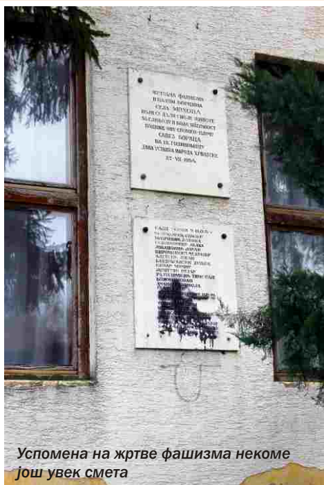
Успомена на жртве фашизма некеме још увек смета

фиста с обзиром да је тај посао научио у Товарнику на железничкој станици радећи са једним својим рођаком. Он се у редовима партизана нашао заједно са својим оцем и сестром када су побегли из села јер им је кућа била запечаћена, а отац дан раније ухапшен у Илоку, да би потом био пуштен захваљујући познанству са једним Хрватом.