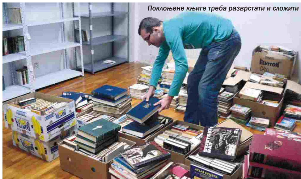
Поклоњене књиге треба разврстати и сложити