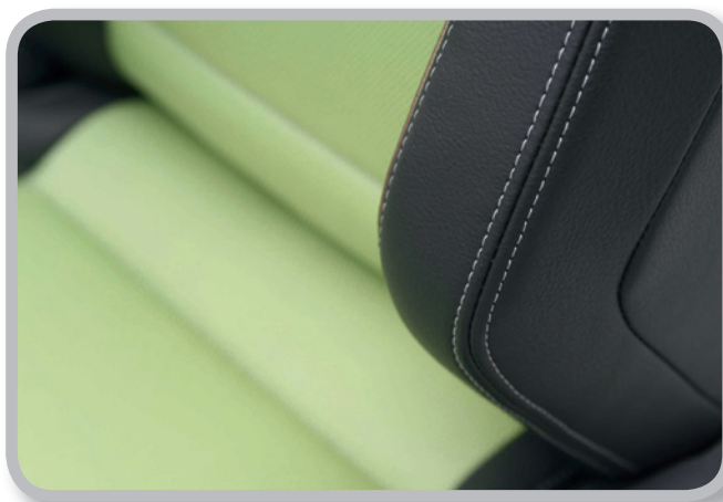
Car Trim unterhält eine eigene Lederfabrik in Weida, die als eine von wenigen Herstellern in Deutschland vollstufig von der Rohhaut bis zum fertigen Leder produziert