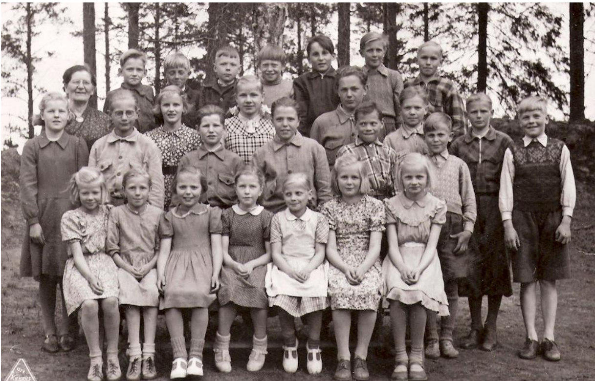
Rikkilän koulun entisiä oppilaita

oppilaat siirtyivät Simolan kouluun ja rakennus siirtyi sosiaalihuollon asukkaiden käyttöön. Erinäisten vaiheiden jälkeen koulu on nykyisin siirtynyt Lyijysen omistukseen ja se on asuinkäytössä.