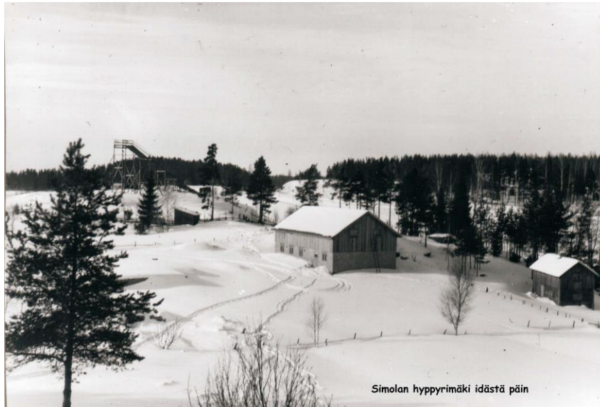
Simolan hyppymäki idästä päin