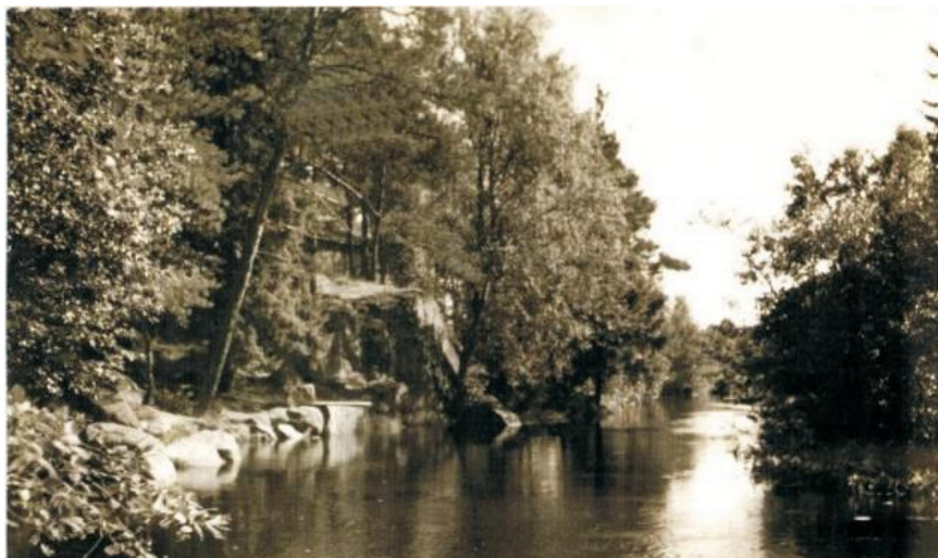
Simolan Kolkka, aikuisten uimapaikkana 1950-luvun alussa