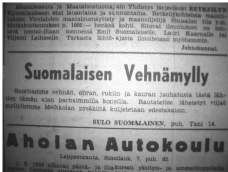
Ilmoitus Etelä-Saimaassa 50-luvulla

pyöriessä, ei niitä sopinut seisattaa kesken kaiken. Etukäteistilauksia ei tehty, vaan paikalle tultiin kun jauhettavaa oli. Välillä töitä tehtiin ihan yötä myöten. Myllyn paikka on sama edelleenkin, mutta seiniä on jouduttu muuttamaan ja kunnostusta tekemään. Myllynkivet ovat yhä paikoillaan.