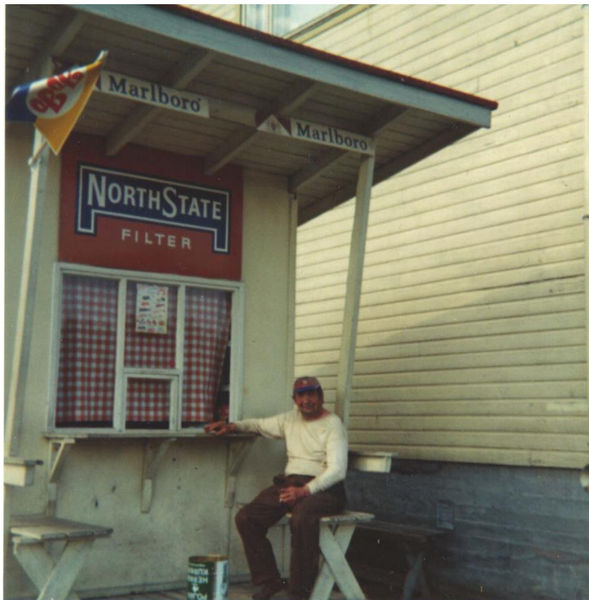
Simolan kioski 1970-luvulla.