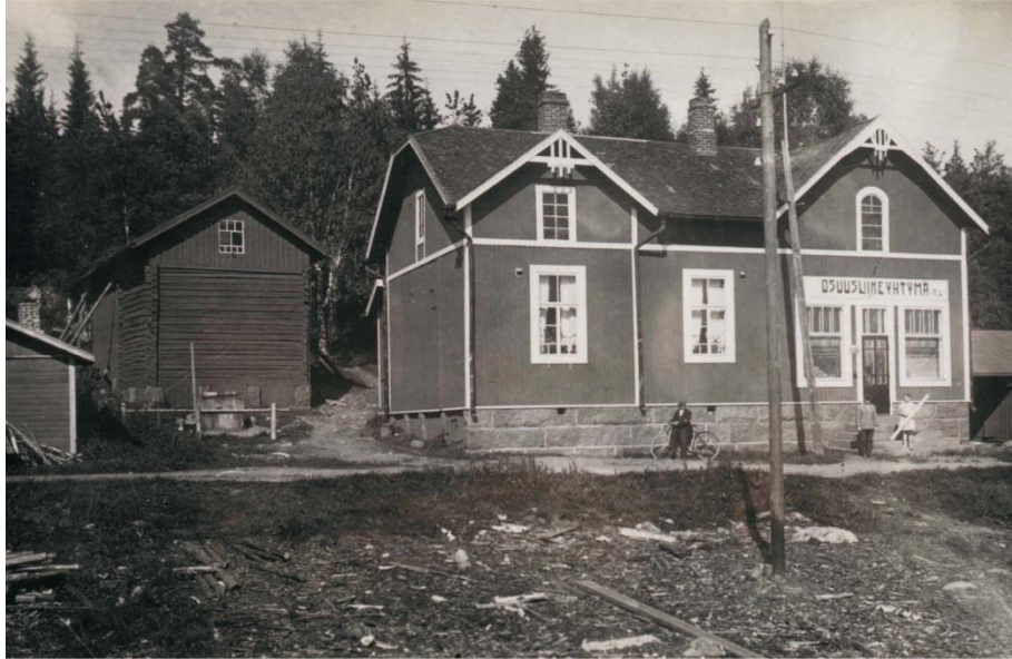
Osuusliike Yhtymä, jonka yläkerrassa näyttelijä Vesa Vierikko asui

Näyttelijä Vesa Vierikko on kotoisin Simolan kylältä. Vesan äiti Ulla toimi terveysisarena, heidän perheensä asui Osuuskaupan yläkerrassa. Aikuiset pelasivat usein canastaa naapurien kanssa ja lapset olivat hyviä ystäviä mm. naapurikauppiaan lasten kanssa. Vesalla oli tapana soittaa pyörän torvea ulkona ja niin jäi muilta lapsilta ruokakin kesken, kun kutsu kävi ja ulos oli lähdeittävä. Hävisivätpä lapset joskus pitemmäksikin aikaa omille teilleen, onneksi kuitenkin turvallisesti kotiin palaten. Yleisesti ottaen oli tapana, että jos tiellä nähtiin liikettä, ikkuna avattiin ja kahvikuppia heiluteltiin, joka toimi kutsuna tulla sisään kahvittelemaan.