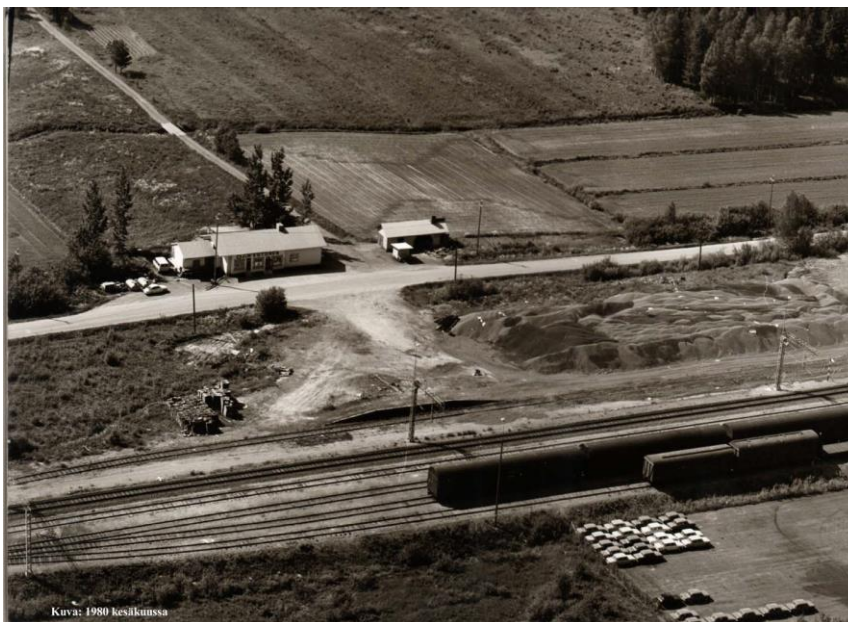
Etualalla Konelan Maahantuontikeskuksen tullattuja autoja. Radan ja tien välissä lekasoran varastointia. Takana J&M Kotonen, kauppa perustettu 1951 Nurmela&Kotosen sivumyymälänä