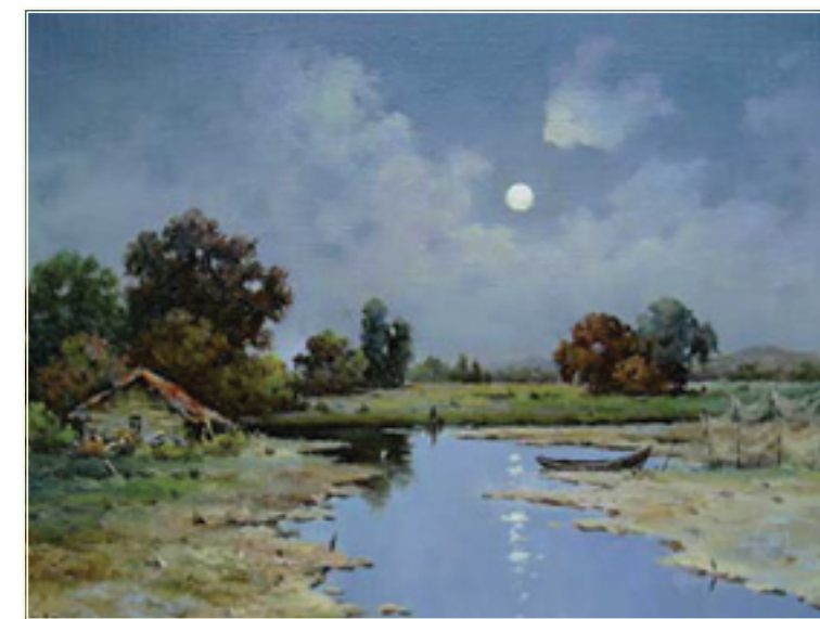
26. «Лунная ночь» холст, масло, 30x40; 2011 «Una notte di luna» tela, olio; 30x40; 2011