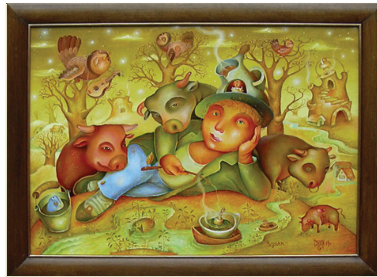
7. «Зоряка» холст, масло, 50x70; 2009 «L'aurore» tela, olio; 50x70; 2009

Работы находятся в частных коллекциях многих стран мира.