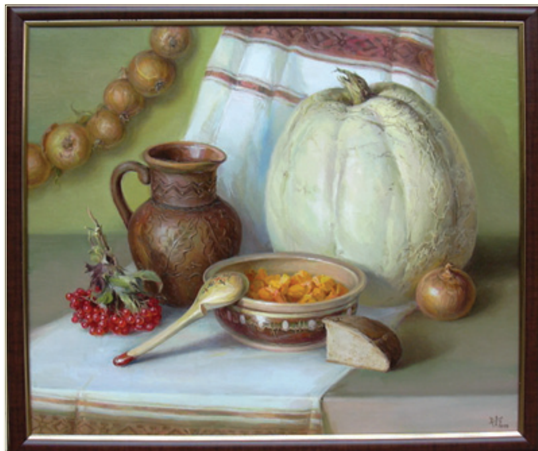
17. «Натюрморт с белой тыквой» холст, масло, 50x60; 2009 «La natura morta col una zucca bianca» tela, olio, 50x60; 2009

Р одилась в 1972 г. в городе Киев(Украина) Училась: 1983-1990г. Республиканская художествен- ная школа им. Т.Г.Шевченко 1990-1992г. Педагогический Университет им.Драгоманова 1998-2000г. Art Instruction Schools. Миннеа- полис. Миннесота. США.