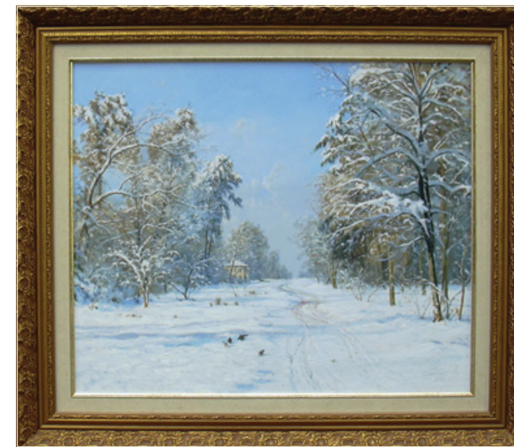
4. «Винна снєг» холст, масло, 50x60; 2010 «La neve è scesa» tela, olio, 50x60; 2010