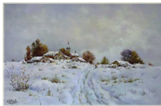
39. «Зимняя дорога» холст, масло, 40x60; 2009 «Inverno strada» tela, olio; 40x60; 2009