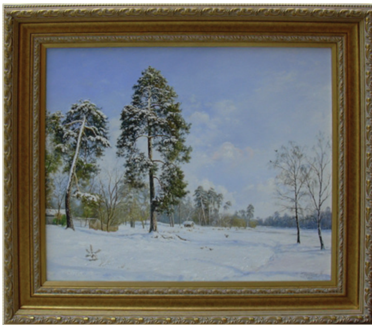
5. «Зимний день. У озера» холст, масло, 50x60; 2011 «Un giorno invernale. Al lago» tela, olio, 50x60; 2011

A partire dell'anno 2003 è un partecipante attivo di tutti i progetti del Centro di Produzione di Boyko. Le molte pitture dei suoi sono nelle collezioni private di Ucraina e dei paesi del mondo. Ultimamente vive e lavora a Kiev.