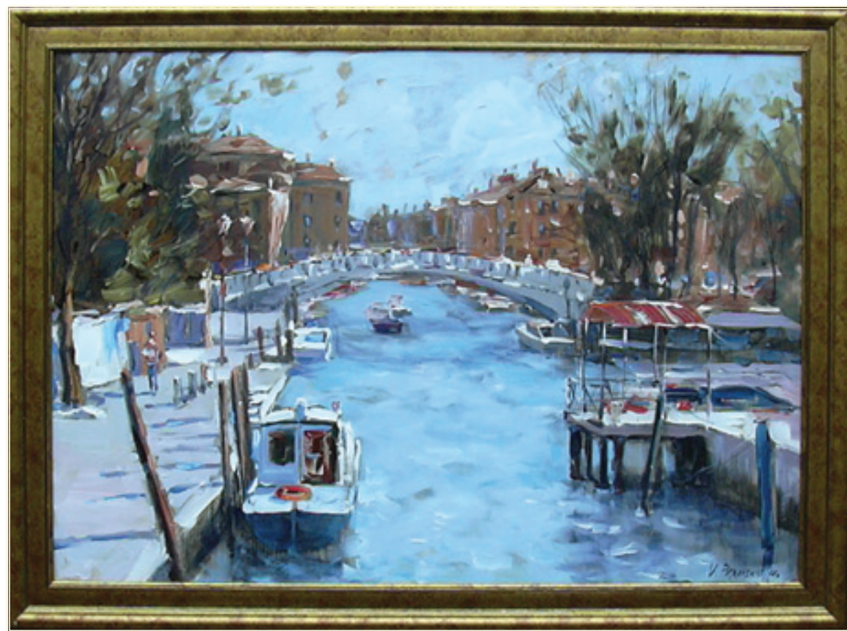
43. «Венеция» холст, масло, 50x70; 2008 «Venezia» tela, olio; 50x70; 2008