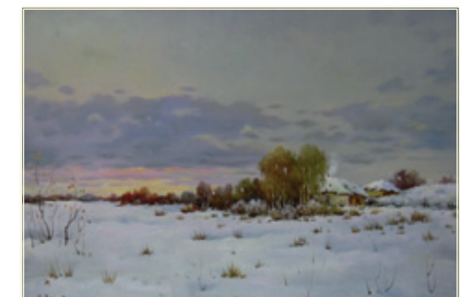
31. «Зимний вечер»