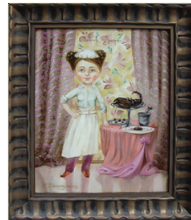
15. «Скорпион или шоколадный скорпион» холст, масло, 25x20; 2011 «Scorpio o scorpio di cioccolato» tela, olio; 25x20; 2011

Р одилась в казацком городе Запорожье в 1976г. В 1995 г. окончила Львовский колледж декоративного и прикладного искусства им. Ив.Труша. Во Львове для себя открыла мир икон в связи с чем в дальнейшем выбрала факультет сакрального искусства при Львовской академии искусств, которую окончила в 2001 г. С 2001 г. жила и творчески работала в Италии, в 2002 г. посещала курсы современного сакрального искусства и архитектуры при Istituto Superiore di Scienze Religiose «G.Toniolo» в Пескаре. Брала участие в многочисленных коллективных выставках и конкурсах, а также представила 3 персональные выставки: «Sette giorni, sette eventi» - г. Каттолика 2003 г., «Il mondo delle icone» - г. Авеццано 2004 г., «Colori... Simboli... Passione...» - г. Л'Аквила 2005 г. Для украинской церкви в г. Маквиллер (Франция) выполнила витраж «Благовещение». Работы находятся в частных коллекциях Украины, России, Италии, Турции, Франции, Монголии. На данный момент преподаватель на кафедре «Дизайна» в ЗЕТК ЗНУ.