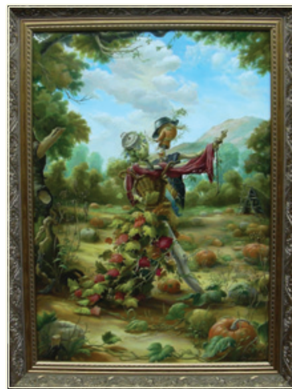
42. «Танго» холст, масло, 70x50; 2010 «Tango» tela, olio, 70x50; 2010

Ultimamente si occupa di decorazione delle case e uffici a Kiev coi quadri. Ho un periodo di assalto delle idee creative.