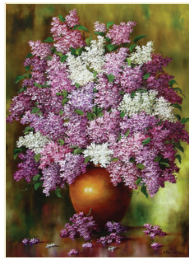
44. «Сирень» холст, масло, 70x50; 2011 «Lilla» tela, olio, 70x50; 2011

Родилась 16.04.1964 г. в г. Киеве. В 1987 г. поступила во Всесоюзную народную академию изобразительных искусств на отделение станковой живописи и графики (преподаватели Александров А. А., Колганов В. М.). Академию окончила в 1991 г.