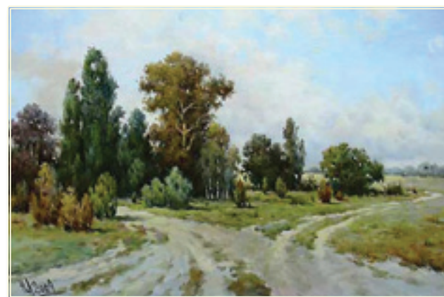
38. «Две дороги» холст, масло, 40x60; 2009 «Due strade» tela, olio; 40x60; 2009

Dopo la dissoluzione dell'URSS hanno sorgiuto le nuove possibilità. Lugovenko si fa conosciuto in Europa.