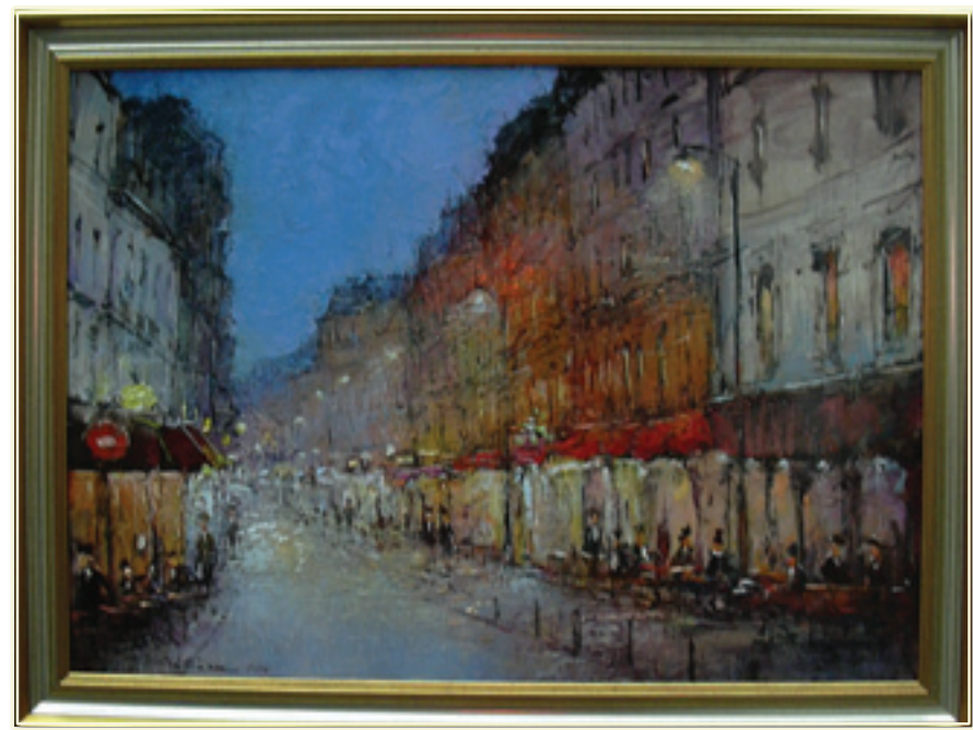
11. «Париж. Монмартр» холст, масло, 50x70; 2010 «Parigi. Montmartre» tela, olio, 50x70; 2010