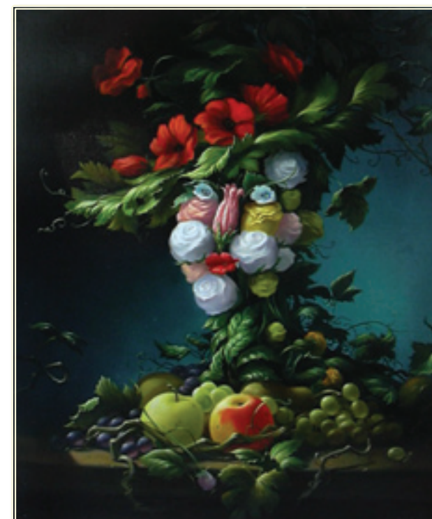
41. «Дамы в шляпе» холст, масло, 60x50; 2010 «Una dam ache port ail cappello» tela, olio; 60x50; 2010