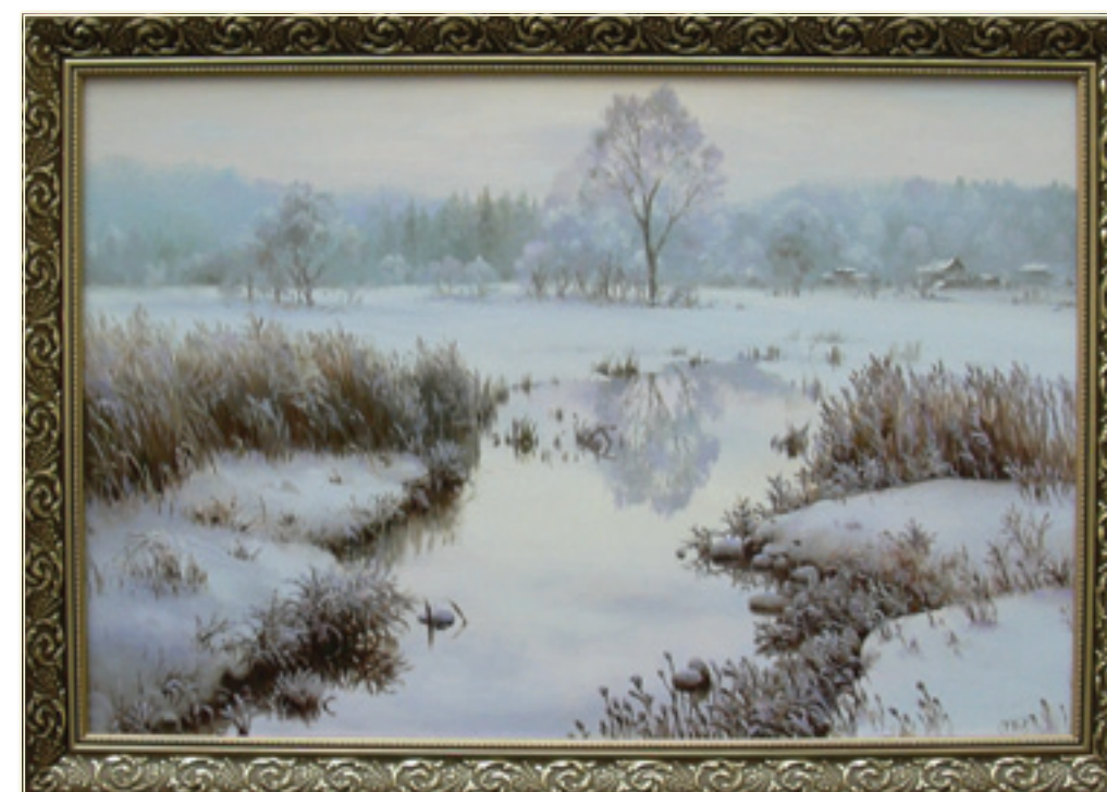
48. «Зима» холст, масло, 50x75; 2010 «Inverno» tela, olio, 50x75; 2010