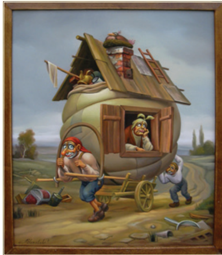
22. «Газда путешественный»