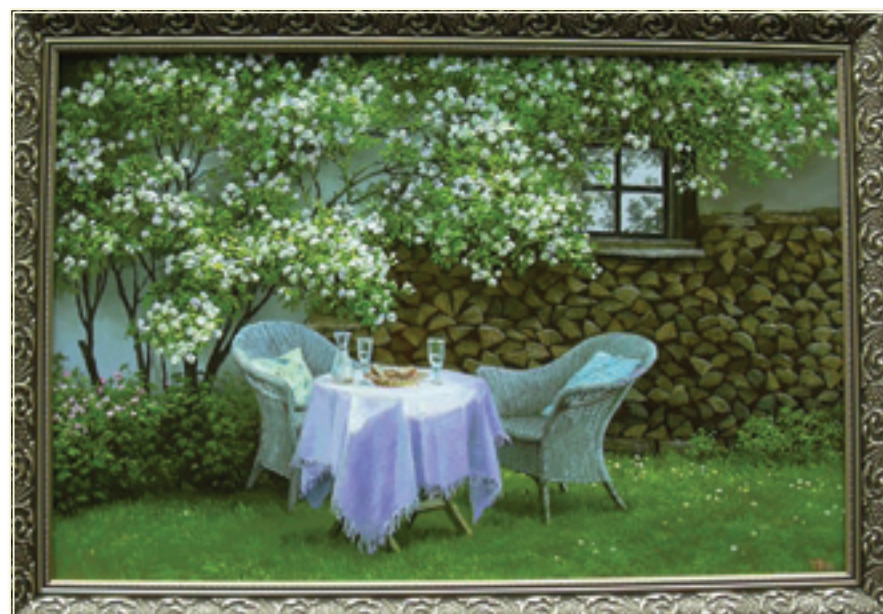
49. «В саду» холст, масло, 50x75; 2011 «In giardino» tela, olio, 50x75; 2011

I suoi lavori sono rappresentati nelle collezioni private di Ucraina e all'estero.