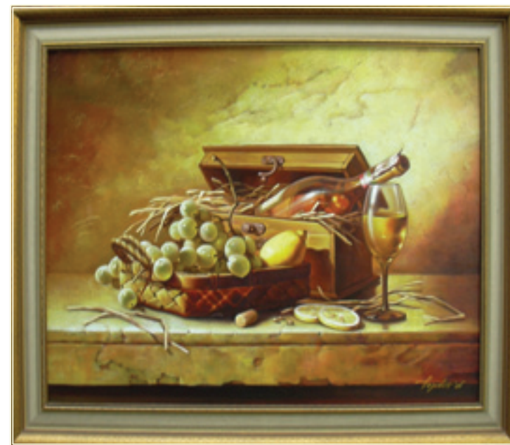
1. «Токайское вино» холст, масло, 60x80; 2006 «Il vino di Tokay» tela, olio, 60x80; 2006