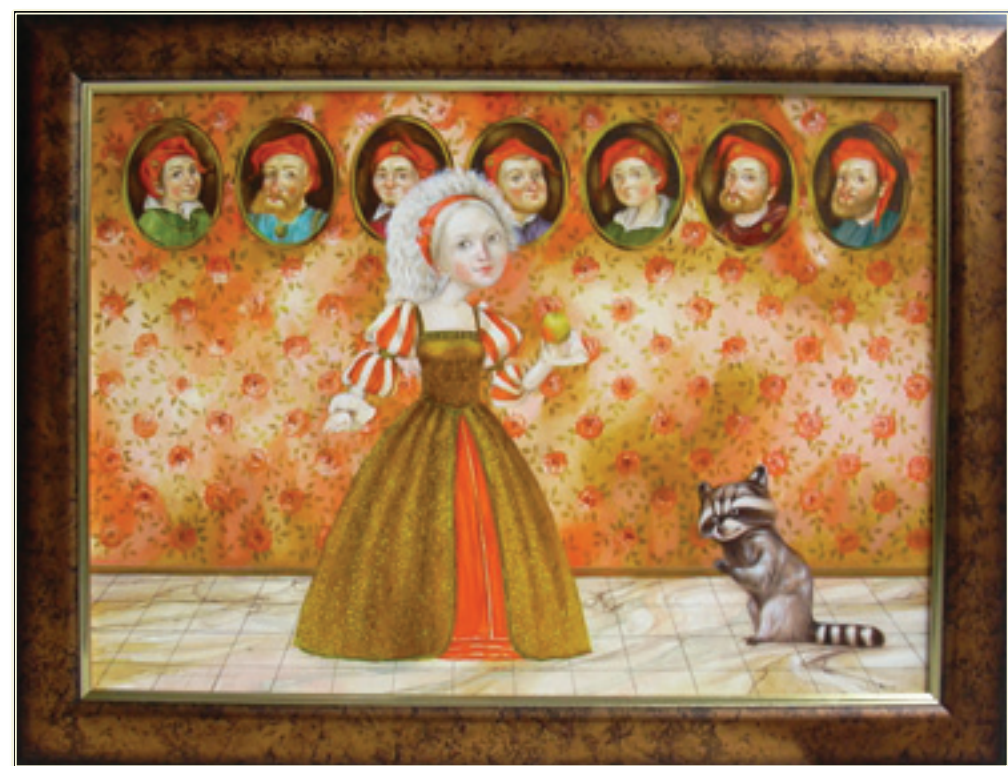
12. «Белоснежка» холст, масло, 50x70; 2010 «Biancaneve» tela, olio, 50x70; 2010