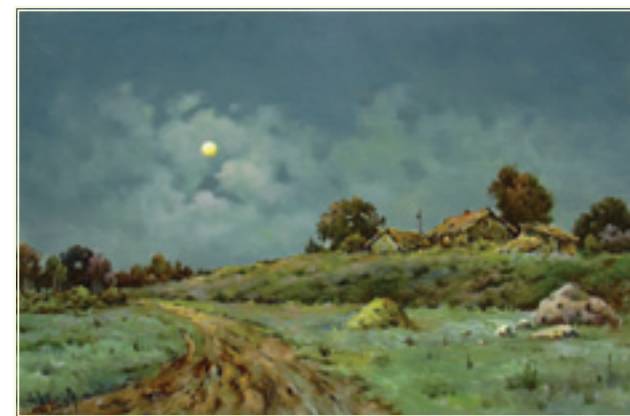
30. «Луна взошла» холст, масло, 40x60; 2009 «La luna si è levata» tela, olio, 40x60; 2009