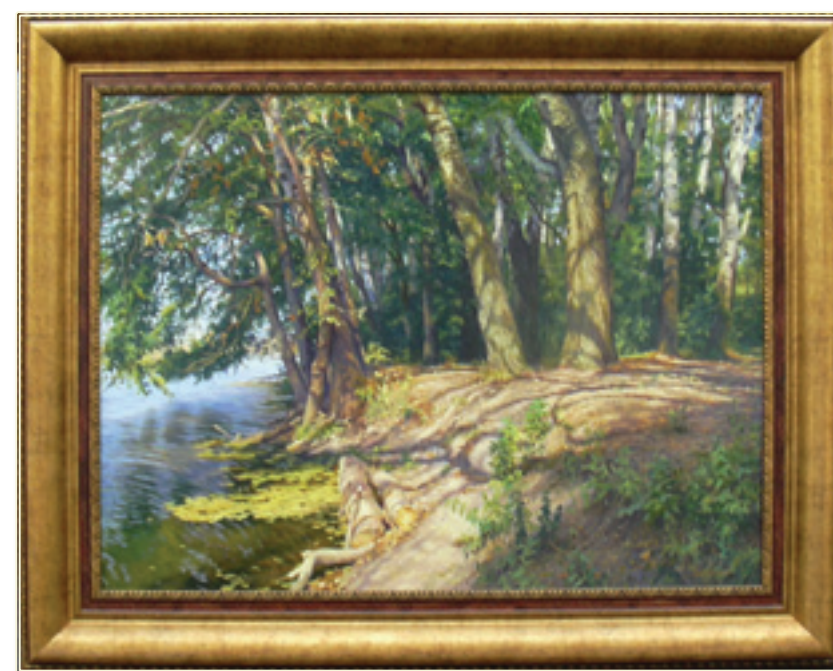
19. «На берегу Айдара» холст, масло, 60x80; 2011 «Alla costa di Aida» tela, olio, 60x80; 2011