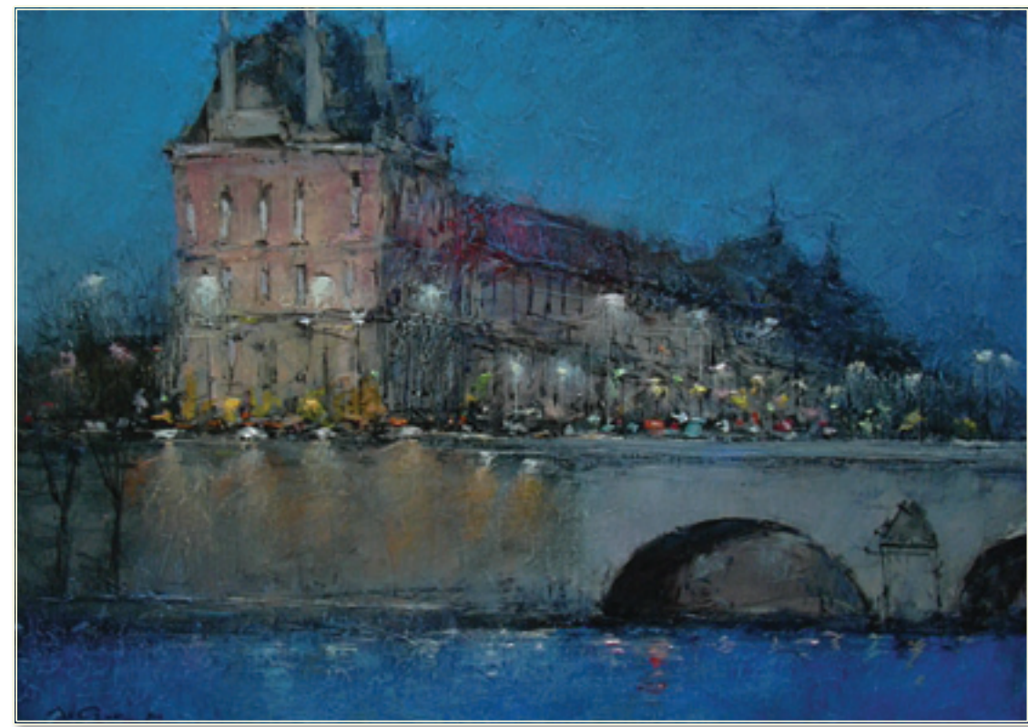
10. «Прогулка по ночному Парижу» холст, масло, 50x70; 2010 «Un passaggio per la Parigi notturna» tela, olio, 50x70; 2010