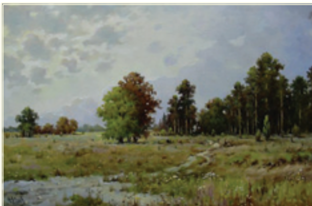
29. «Сосновый лес»