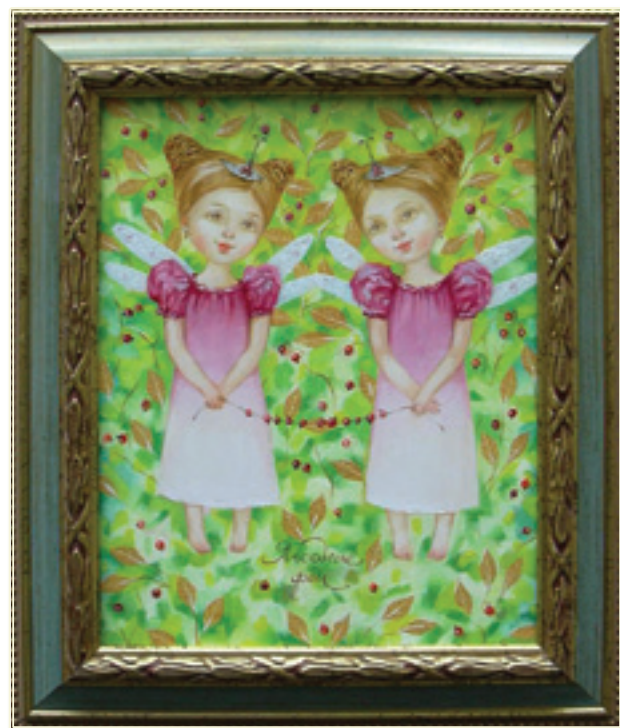
14. «Близнецы или ягодные феи» холст, масло, 25x20; 2011 «I gemelli o le fate baccifere» tela, olio, 25x20; 2011