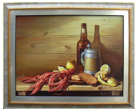
3. «Раки на полке» холст, масло, 60x80; 2006 «I gamberi sullo scaffale» tela, olio, 60x80; 2006

Oggi vive e lavora a Mukacevo della Regione di Transcarpazia.