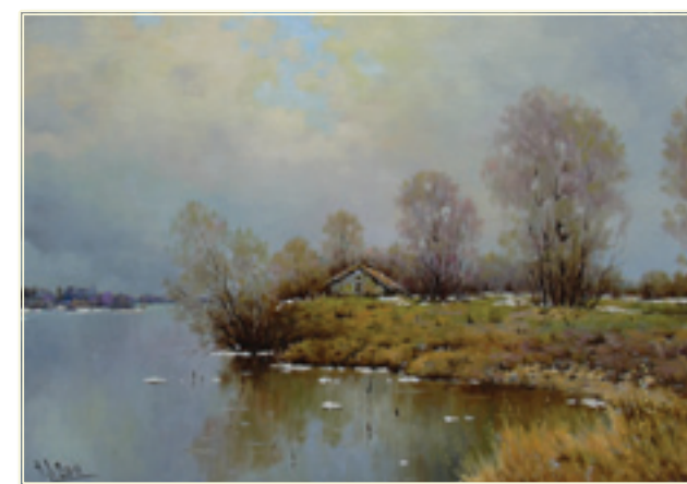
32. «Весна» холст, масло, 40x60; 2011 «La primavera» tela, olio, 40x60; 2011