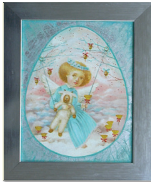
16. «Пасхальные подарки» холст, масло, 25x20; 2011 «I regali di Pasqua» tela, olio; 25x20; 2011