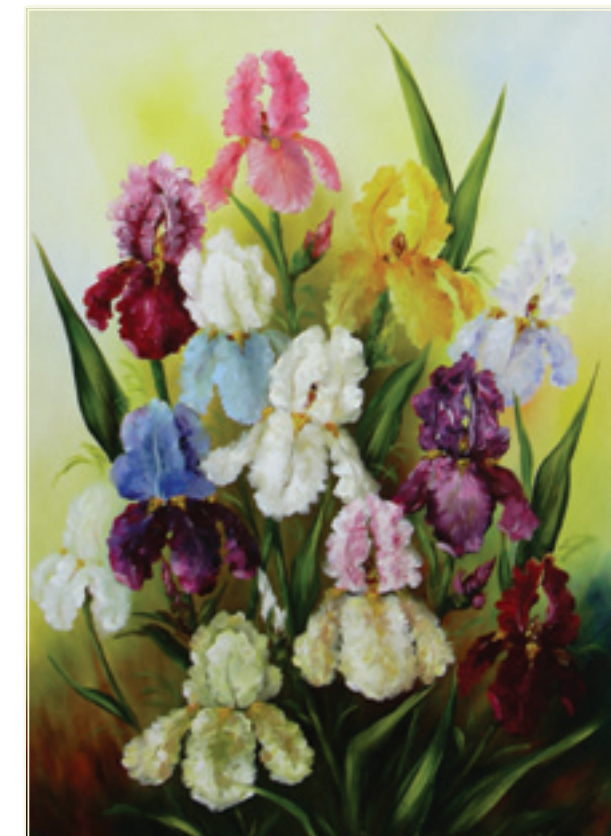
45. «Ирисы» холст, 70x50; 2011 «I giggioli» tela, olio; 70x50; 2011