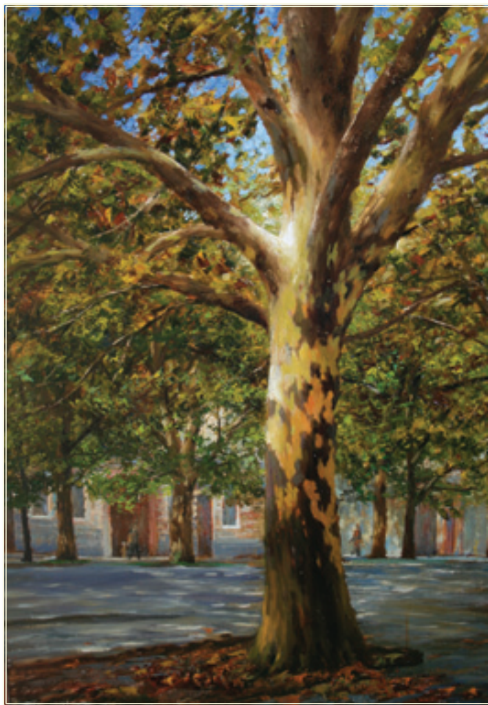
40. «Платан» холст, масло, 80x60; 2011 «Il platano» tela, olio, 80x60; 2011

В 2000 г. Владислав Метёлкин становится заметной фигурой в культурной жизни столицы и г. Одессы: «Киевская весна 2000», арт-проект «Родник», Пятый международный фестиваль искусств, Международная выставка «Наш дом Одесса 2000» и др.