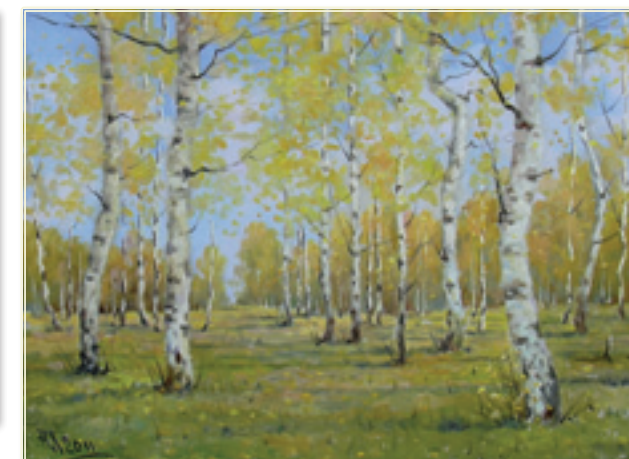
25. «Золото осени» холст, масло, 30x40; 2011 «L'oro d'autunno» tela, olio; 30x40; 2011