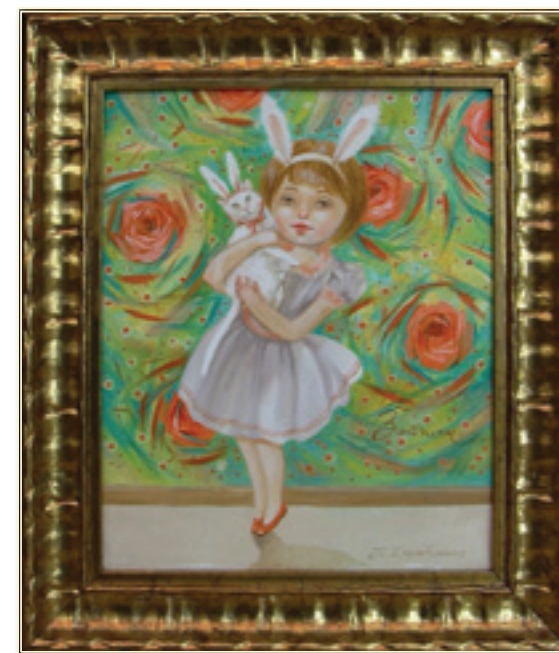
13. «Зайчики» холст, масло, 25x20; 2011 «Le piccole lepri» tela, olio, 25x20; 2011

E nata nella città di cosacco di Zaporozhie in 1976. In 1995. ha finito il Collegio di Arte Decorativa e Applicata di I. Trush di Lvov. A Lvov ha conosciuto il mondo delle icone e dopo ha scelto la Facoltà dell'Arte Sacrale presso L'Accademia delle Arti di Lvov la quale ha finito in 2001. A partire 2001 viveva e faceva l'attività creative in Italia, e in 2002 frequentava i corsi dell'arte sacrale moderno ed architettura presso l'Istituto Superiore di Scienze Religiose «G.Toniolo» a Pescara. Ha partecipato in molte esposizioni e concorsi collettivi ed ha rappresentato 3 esposizioni personali: «Sette giorni, sette eventi» - la città di Cattolica, 2003, «Il mondo delle icone» - la città di Avezzano, 2004, «Colori... Simboli... Passione...» - la città di l'Aquila, 2005. Per la chiesa ucraina nella città di Macviller (Francia) ha fatto una vetrata «L'Annunciazione». I suoi lavori sono rappresentati nelle collezioni private di Ucraina, Russia, Italia, Turchia, Francia, Mongolia.