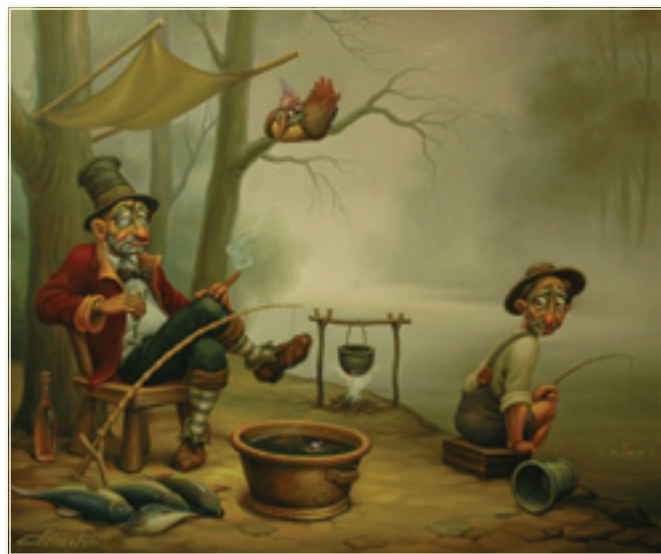
23. «Патриций и плебей»