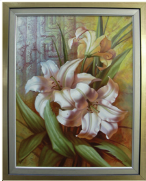
2. «Белые лилии» холст, масло, 80x60; 2006 «I gigli bianchi» tela, olio, 80x60; 2006

Р одилась 26 мая 1965 года в городе Стрый Львовской области.