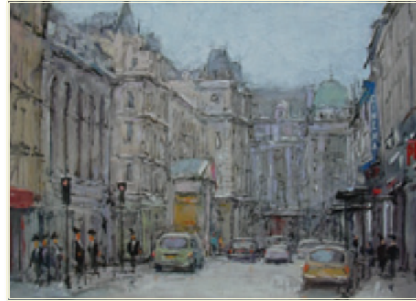
8. «Лондон. Англия» холст, масло, 50x70; 2010 «Londra. Inghilterra» tela, olio; 50x70; 2010