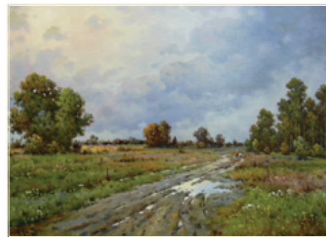
36. «После дождя» холст, масло, 50x70; 2011 «Dopo la pioggia» tela, olio, 50x70; 2011