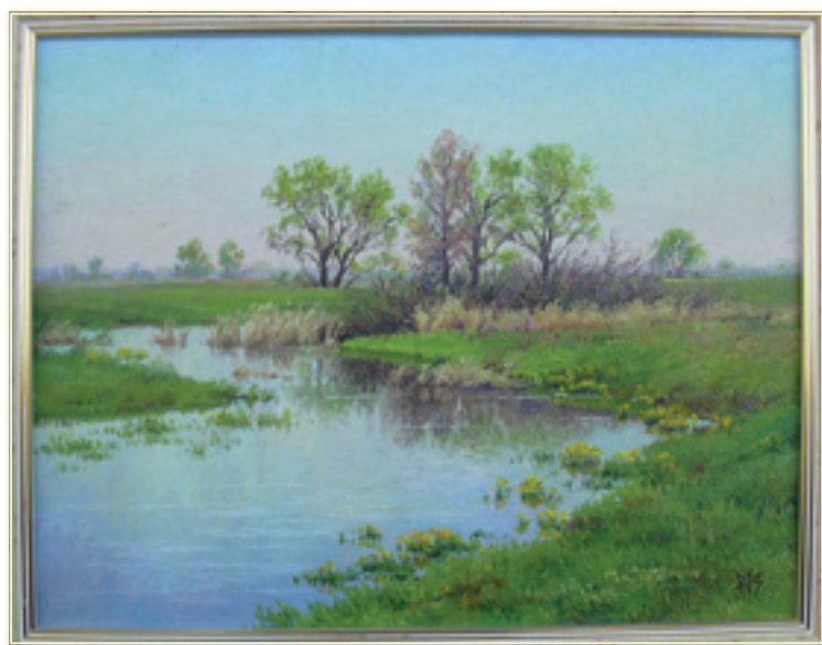
18. «Апрельский разлив» холст, масло, 27x35; 2004 «Il fiume d'aprile» tela, olio, 27x35; 2004