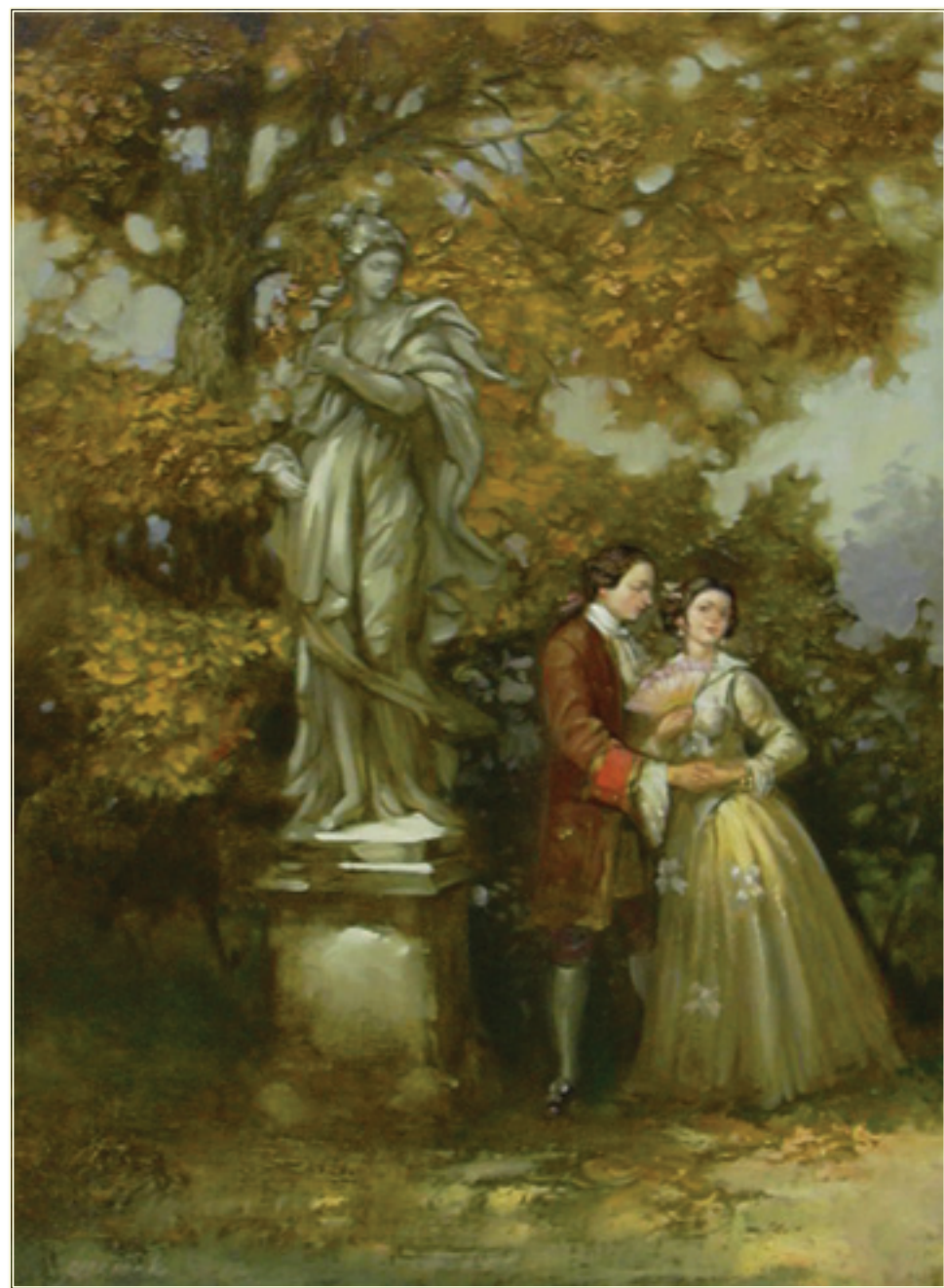
50. «Тайное свидание» холст, масло, 70x50; 2006 «L'appuntamento segreto» tela, olio, 70x50; 2006

Р одился 01.08.1957г. в г. Кривой Рог. Образование: Художественная школа №1 г. Кривого Рога 1971-1975 гг. Криворожский государственный педаго- гический институт художественно-графи- ческий факультет 1979-1984 гг.