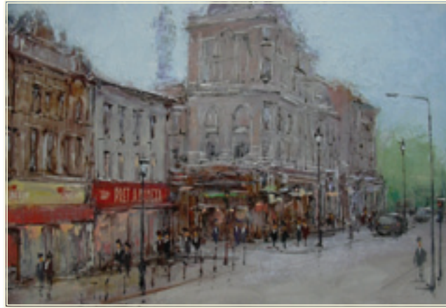
9. «Лондон» холст, масло, 50x70; 2010 «Londra» tela, olio, 50x70; 2010