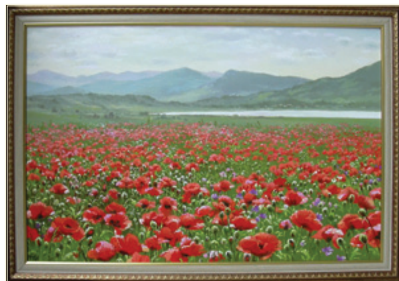
47. «Крымские маки» холст, масло, 50x75; 2011 «I papaveri di Crimea» tela, olio, 50x75; 2011