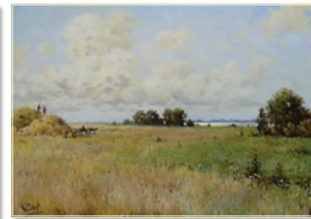
27. «Лето» холст, масло, 40x60; 2009 «L'estivo» tela, olio; 40x60; 2009