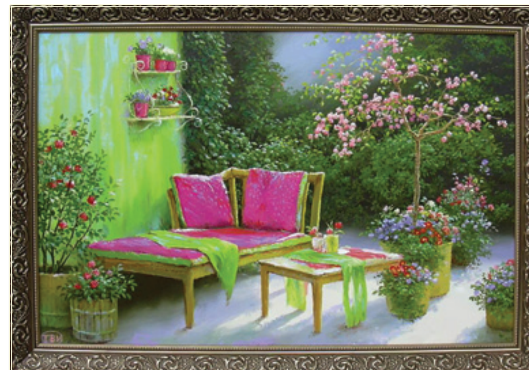
46. «Уголок сада» холст, масло, 50x75; 2010 «L'angolo del giardino» tela, olio, 50x75; 2010