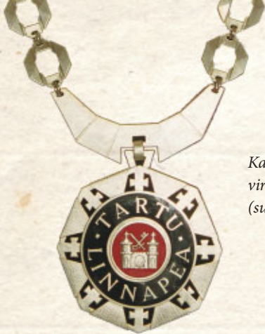
Kaupunginjohtajan virkatunnus (suunnittelija Ene Valter)