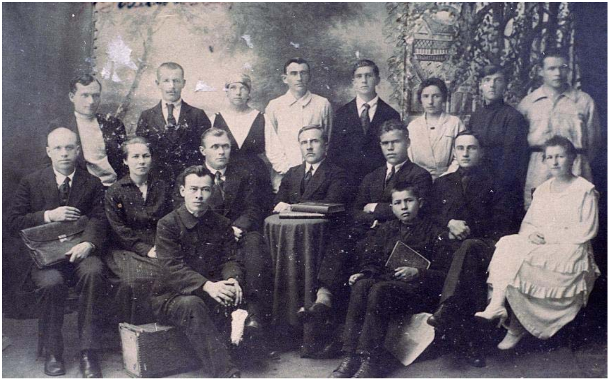
Члены заводоуправления и фабричного комитета. 1923 год