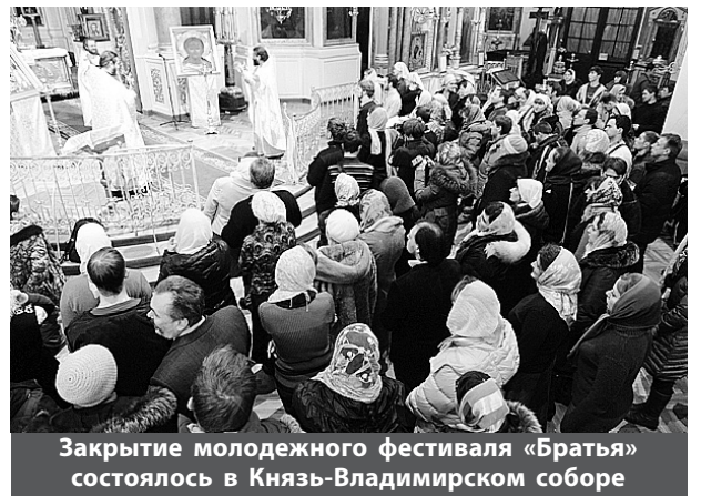
Закрытие молодежного фестиваля «Братья» состоялось в Князь-Владимирском соборе

и способствовало укреплению церковного единства среди молодежи.