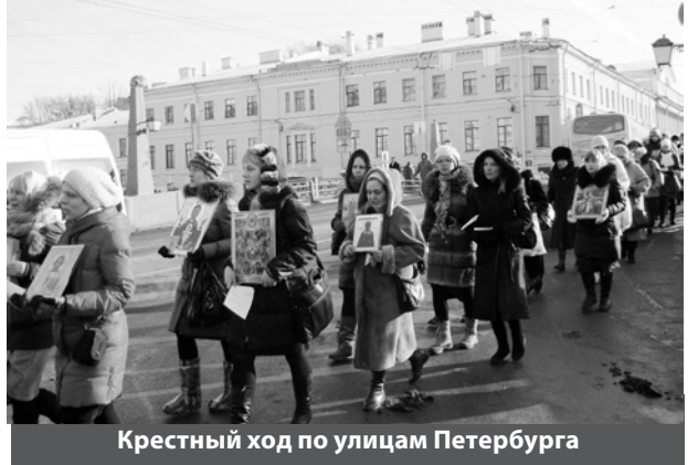
Крестный ход по улицам Петербурга