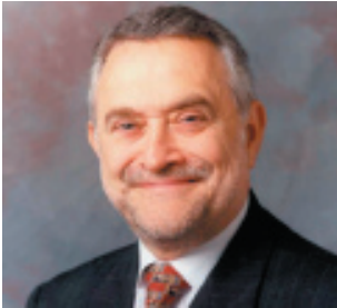
Professor Salvador Moncada

Degrees: MD, University of El Salvador; PhD, Royal College of Surgeons, UK Current position: Director, Wolfson Institute for Biomedical Research, University College London