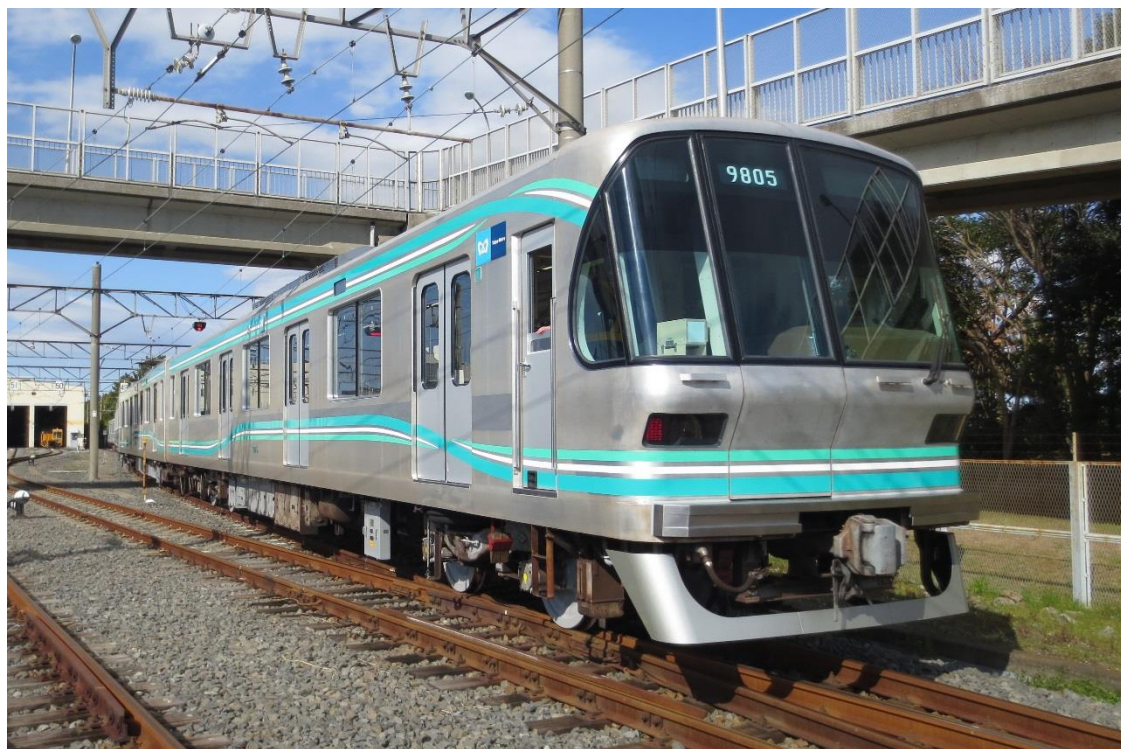
南北線9000系1次車リニューアル外観