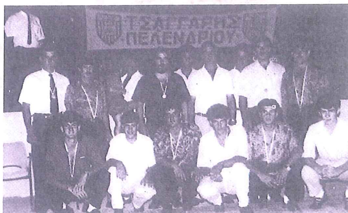
Η Ομάδα του Τσαγγάρη Πελεντρίου κατά την περίοδο 1989-90.

Σχεδόν κάθε Σάββατο το 1949, συγκεντρώνονταν στο Σωματείο της ΑΕΛ εκπρόσωποι των αγροτικών Συλλόγων. Το επόμενο έτος, καθώς το ανεπίσημο αγροτικό πρωτάθλημα συνεχιζόταν, οι απανωτές εβδομαδιαίες συσκέψεις αρχίζουν να δίδουν καρπούς. Ωριμάζει η ιδέα της ίδρυσης της Αγροτικής Ομοσπονδίας. Οι συσκέψεις θα συνεχιστούν μαζί με τα δυο πλέον πρωταθλήματα το 1951. Τον Οκτώβριο του 1951 όλα δείχνουν να είναι έτοιμα για τη δημιουργία μιας Επαρχιακής Αγροτικής Ομοσπονδίας.