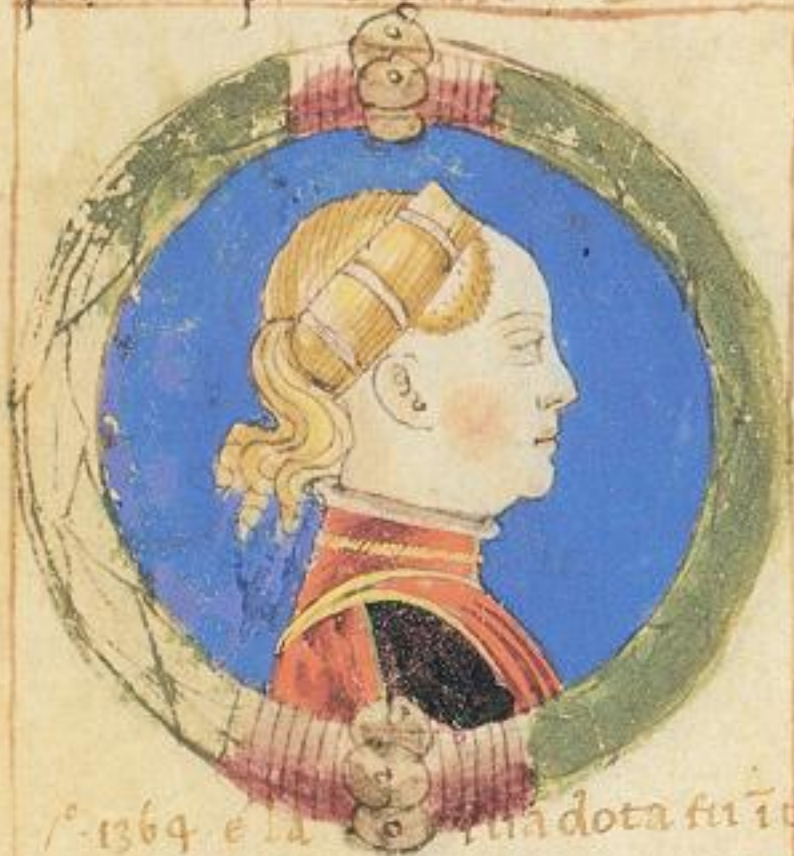
1364 e la sua dota fu i tuto duo 26386.