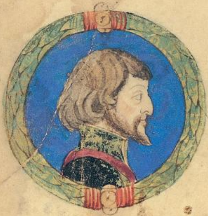
Ramaldo fu fiolo de questo Acgo e mori del .1751.