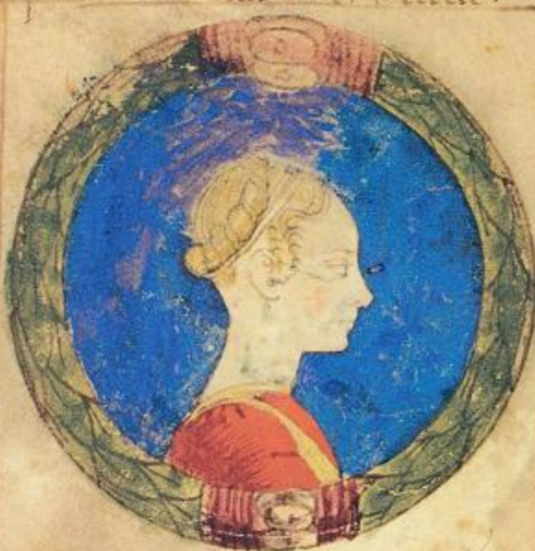
Isota e fiola & de dicto Ramado. naturale. e del. 1474. uue