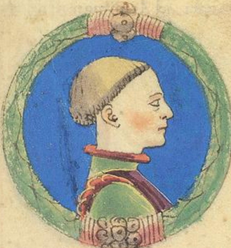
Ramaldo de fiolo de Obigo mori del 1363.