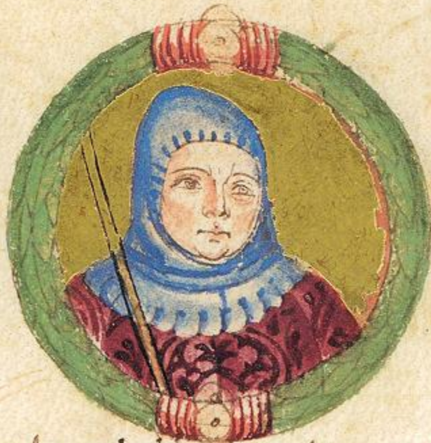
Acgo fiolo del s to Acgo de vigo fu il terço s re & primo inuesti p Signore da la chiesa mori .1224. et e al mone de la viga di ca