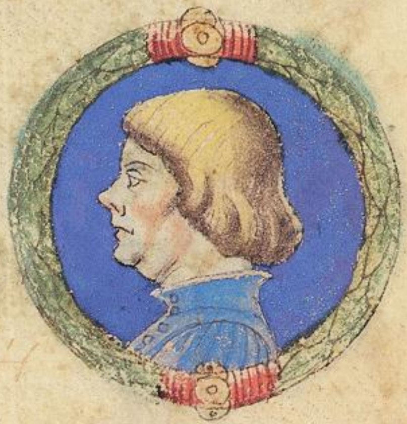
Ramaldo fu fiolo del s to Aldrouan o de' Obigo de Ramaldo.