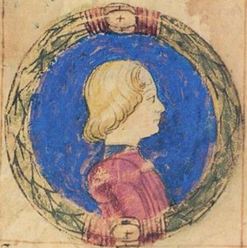
Sig o mondo de dicto fiola. et e naturale. uue. 1474.