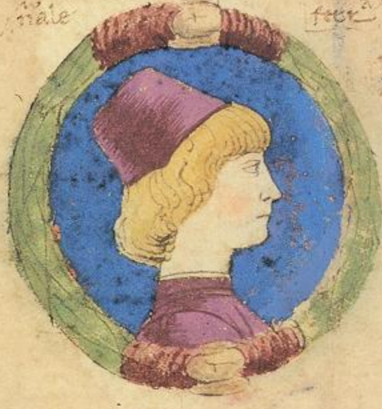
Nicolo e fiolo de Guron de Nico lo s. et e naturale et e chierico vnie. 1474.