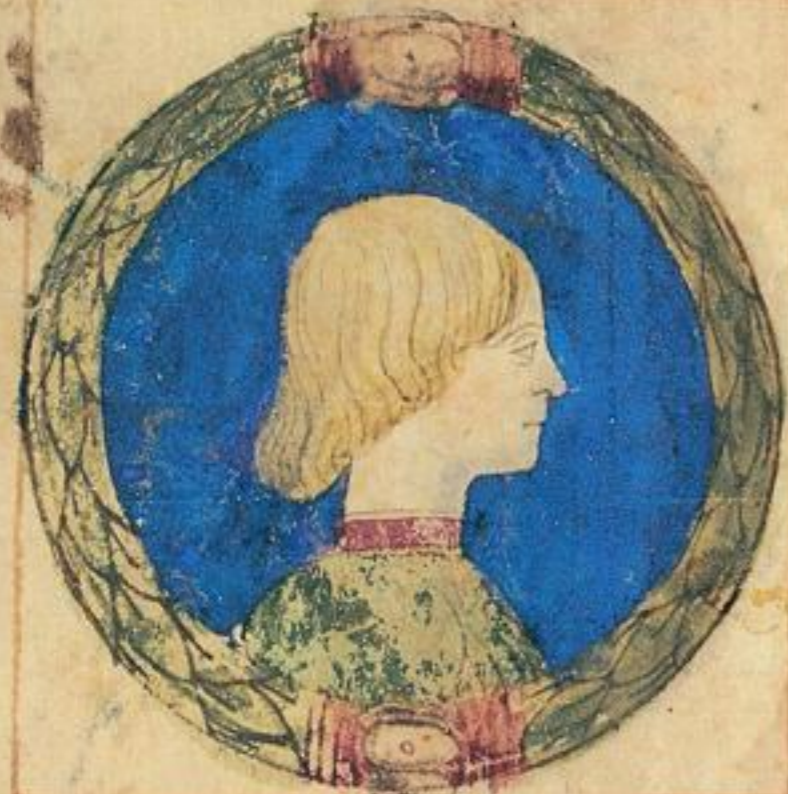
Sico e fiolo uale de Ramado de Nicolo s co s co uue. 1474.