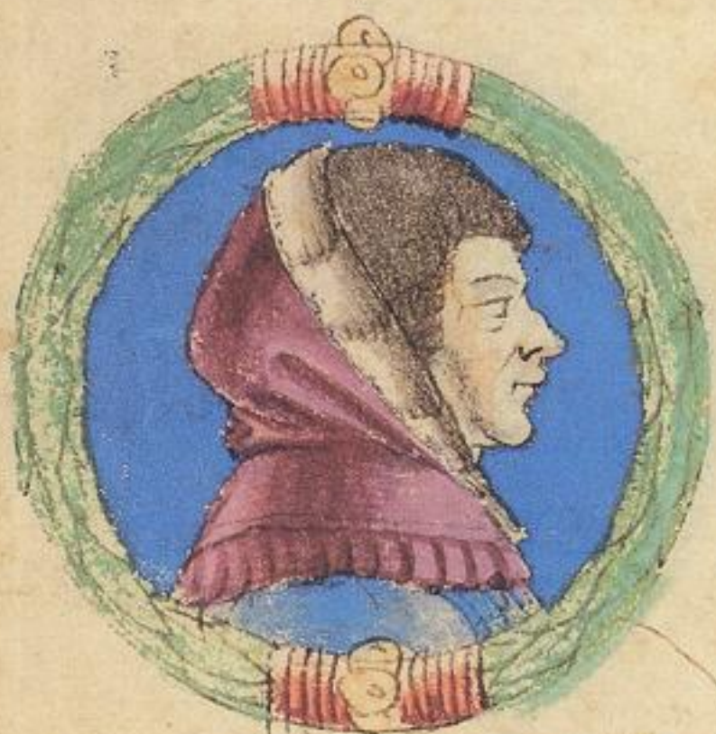
Francesco fu fratello del mto Aggo de Ramaldo de obizzo e asco dnico.