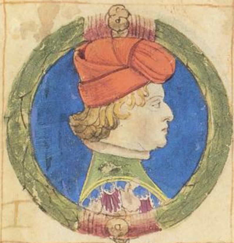
Alberto fu & fiolo de obizo de pro scripto. Signore.