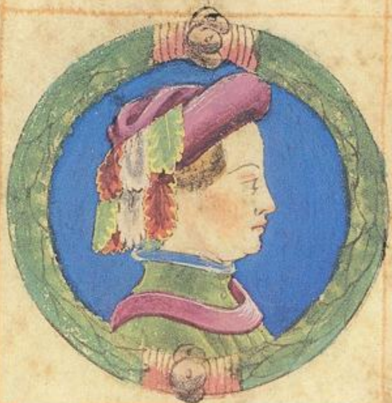
Acço fu fiolo nãle del ssto Ramaldo de Aldrouandino e morite del 1371.