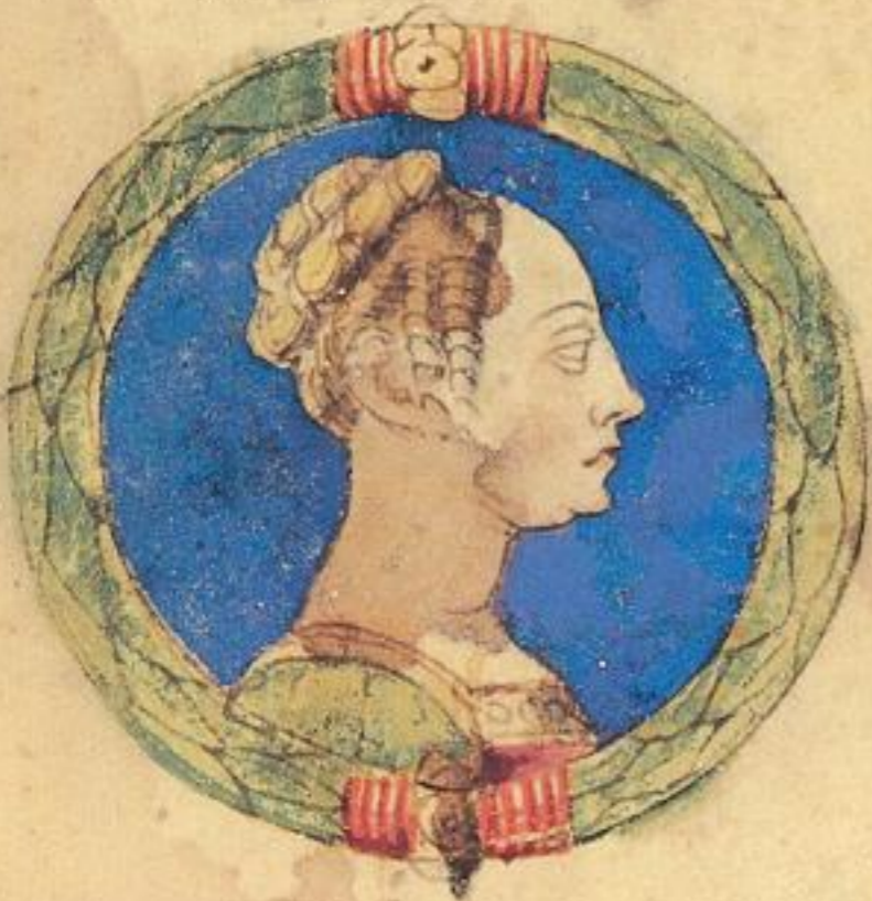
M. Carlana fu moie de Ramaldo pmo moite del .1762. ad. 13. nobre.