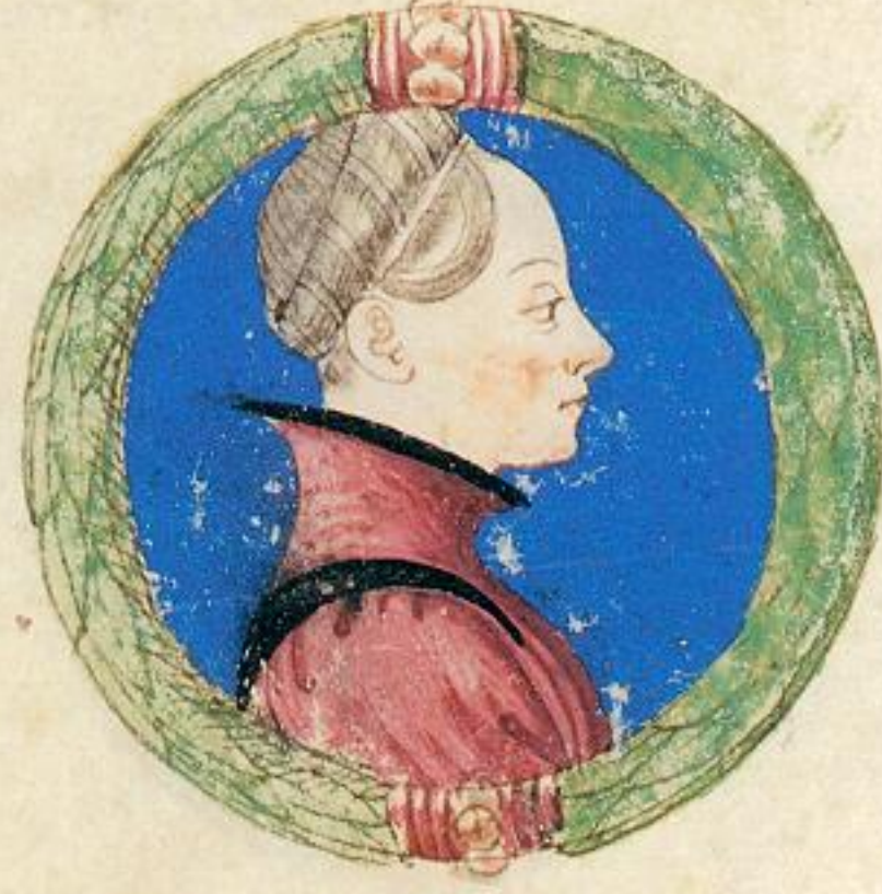
Contessa de cellano fuit moier de Vgo & ne naque lo mto Acco.