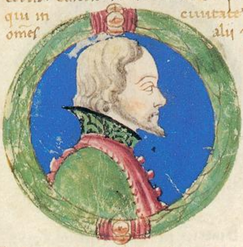
Ugo fuit filius de Alberto Acco. 3

Incaum illustrium dominorum Marchionum Esten. fuit Galia. unde uenerunt Italiam in anno. 880. Et per unum Imperatorem de domo francie facti Marchiones dotati fuerunt in terris paduano Marchie tiulane: est et multis terris. Castris. villis. feudis & possessionibus: et 1095. Alberto Acco fuit primus qui ex polieno terris apliunt qui in omnes ciuitate terr. ha buit dominus et a d. p. cessunt alij r.