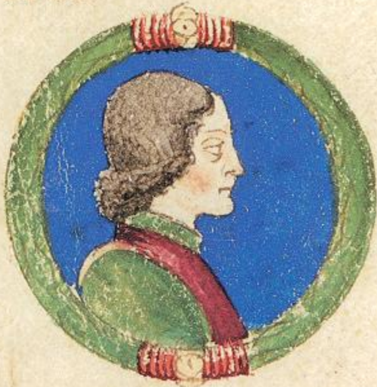
N Folco fu fratello nãle di s ti dui