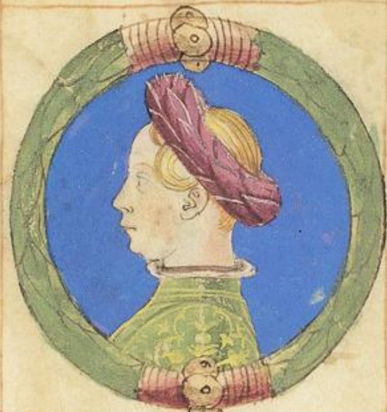
Elisia sorella di contrascripto