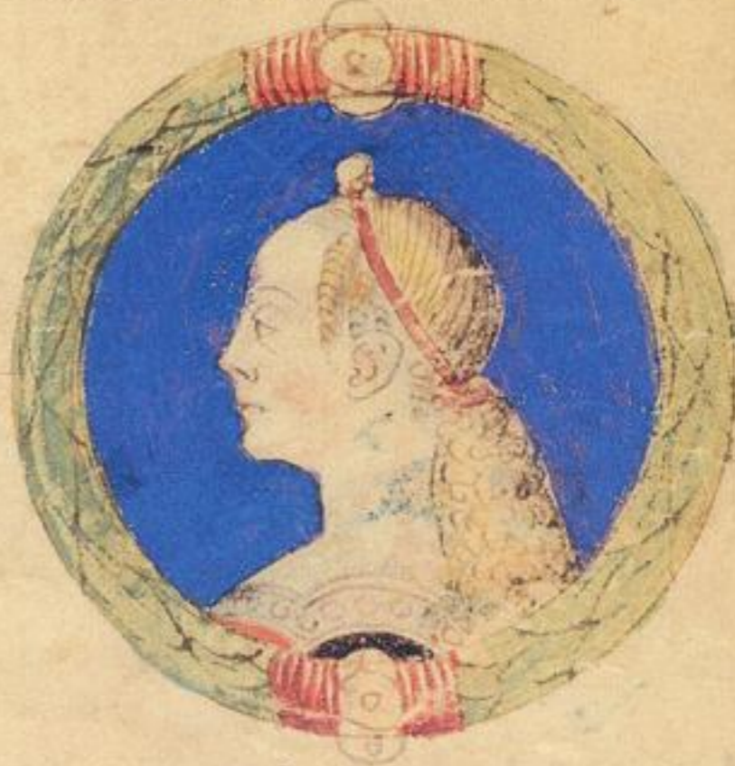
fu fiola del Sto Ray. de Acgo de Obigo e fu marita i casa di rangoni i Modena.