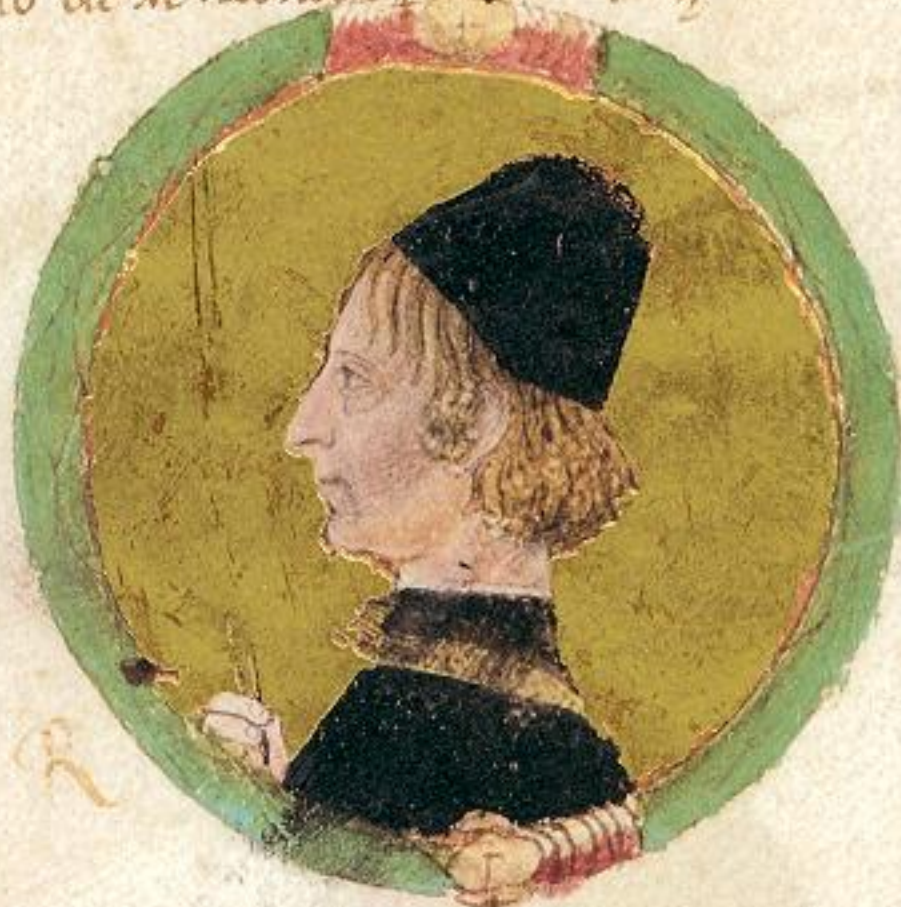
Hercule fu fiolo del suprascripto Nicolò S o l o imo e n o ale et fu el sedo duca ca. 24.