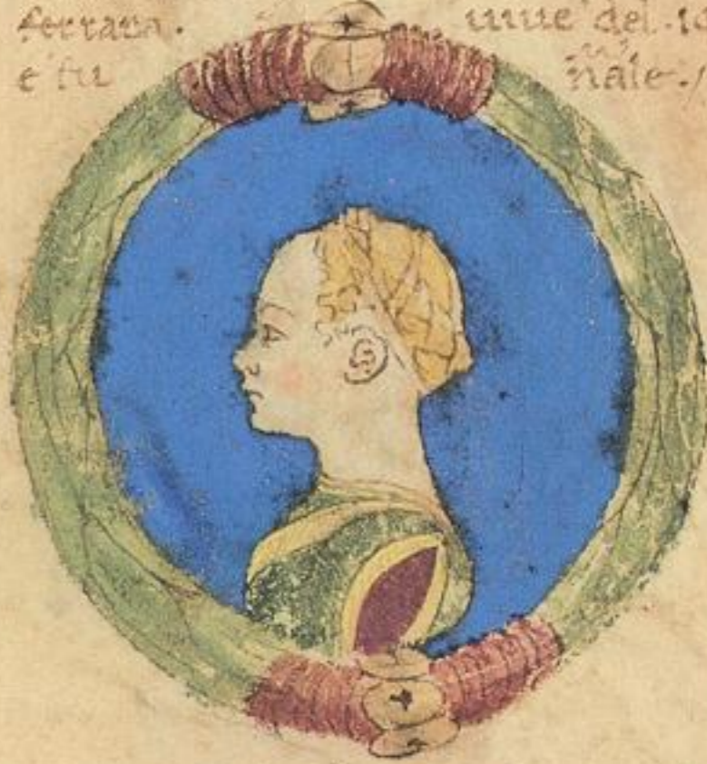
Isota. fi. e fiola dei sto m. Sigismo do naturale. 1474. unue.