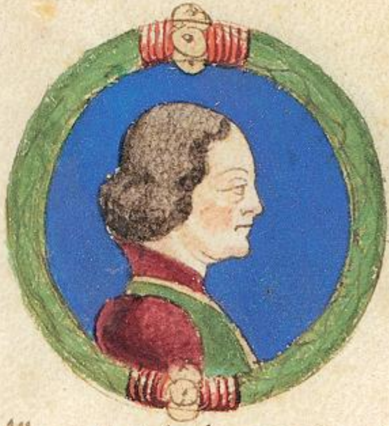
N Alberto fu fiolo de questo Acgo s re & mori inanci il pre, era nãle.