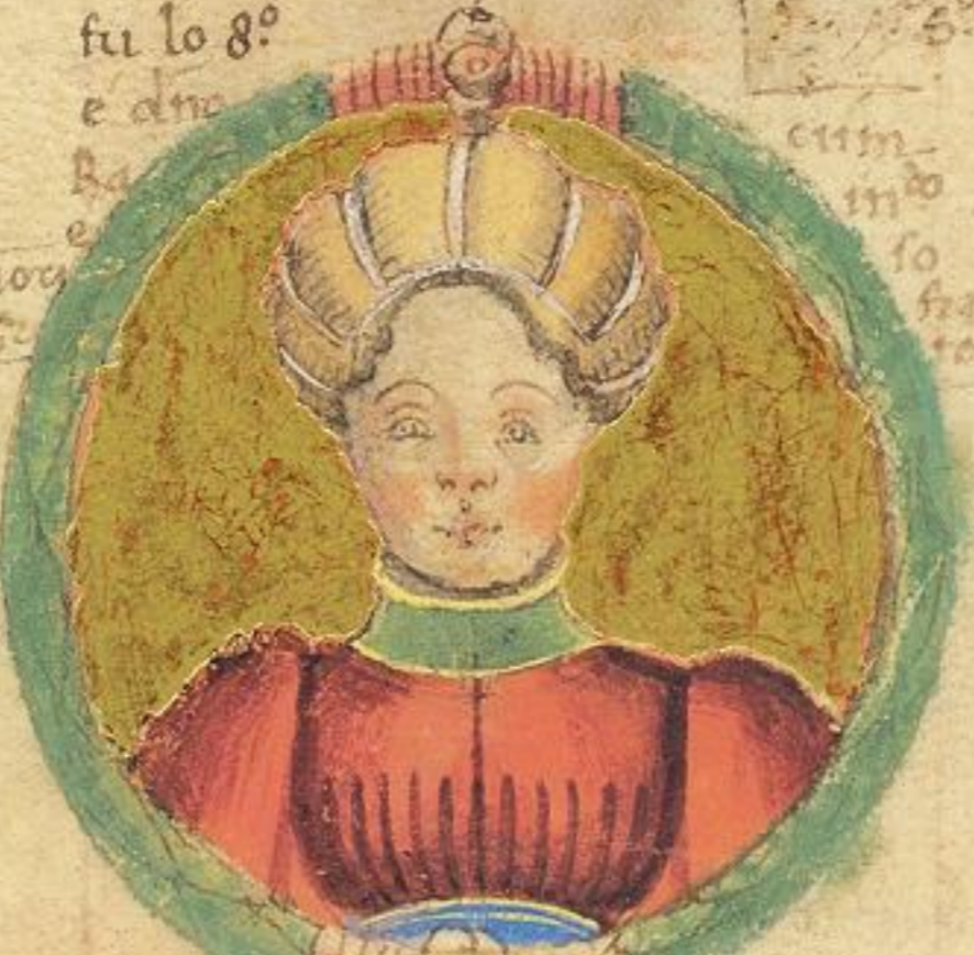
M l lippa di areosti da fu more de questo Obigo. Bologna mori del 1347