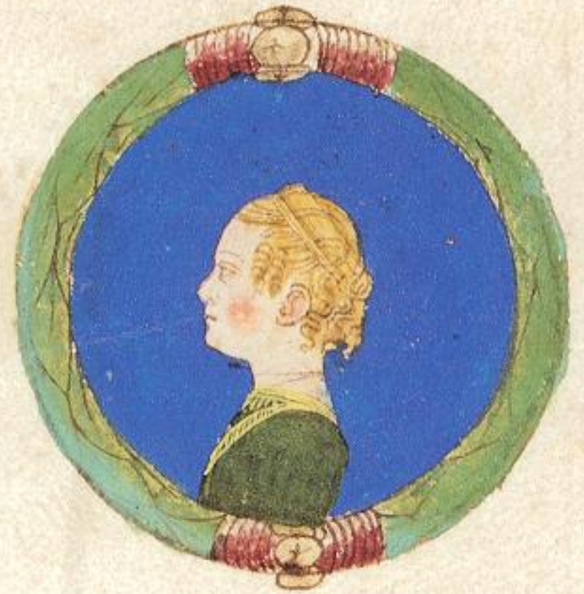
Lucretia e fiola de Hercules na- turale.