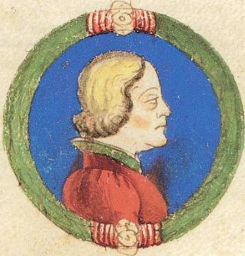
N Acgo fu fratello del s to Alberto et era nãle.