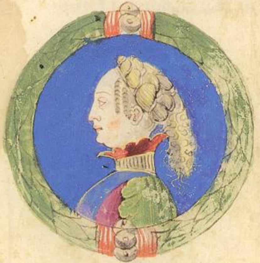
Questa m. Julia fu sorella dela contrascritta cubitosa.