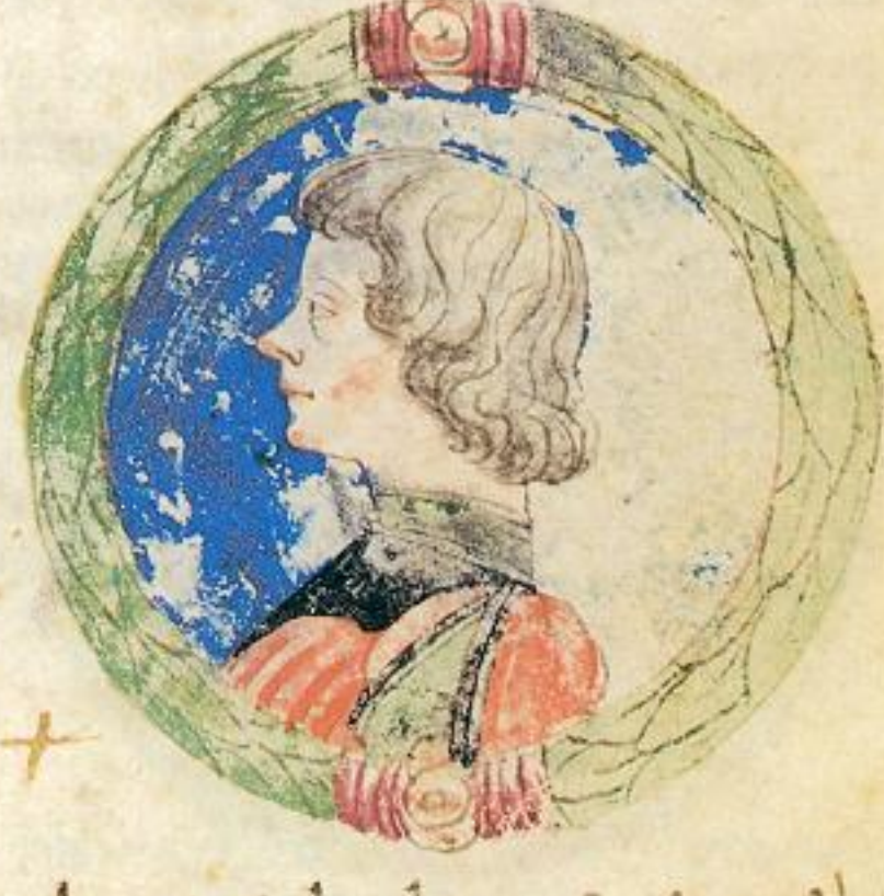
Acco fuit filius de questo supra scripto Vgo. 3