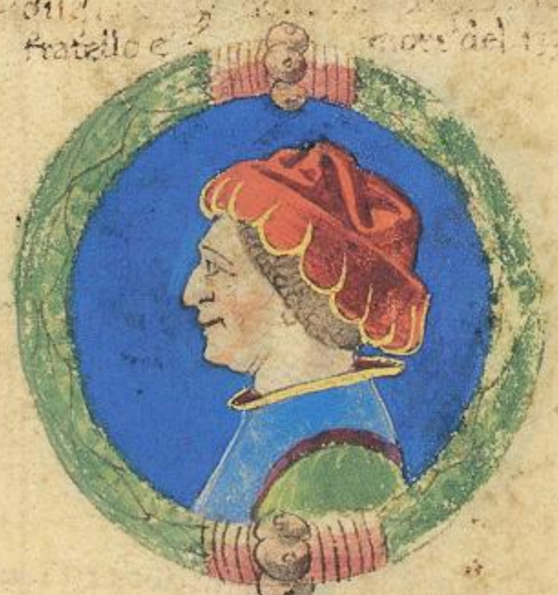
Vgo fu fiolo de de questo Obigo e mori del 1376 adi 1 o d'Agosto