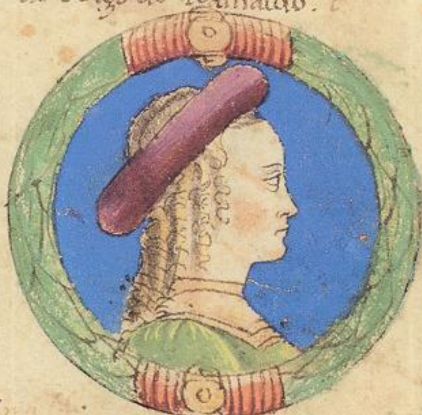
Biatrice fu fiola de dco obizzo fu moie de m Galeac di uesconti da milano.