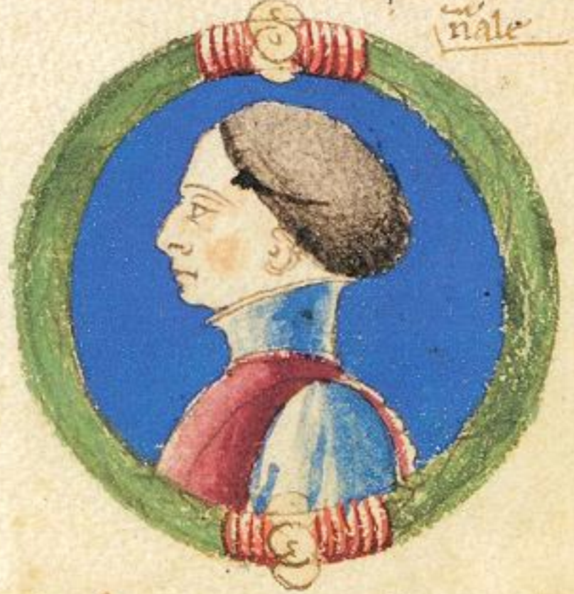
N fu fratello ultimo e nãle di suprascripti quatero.