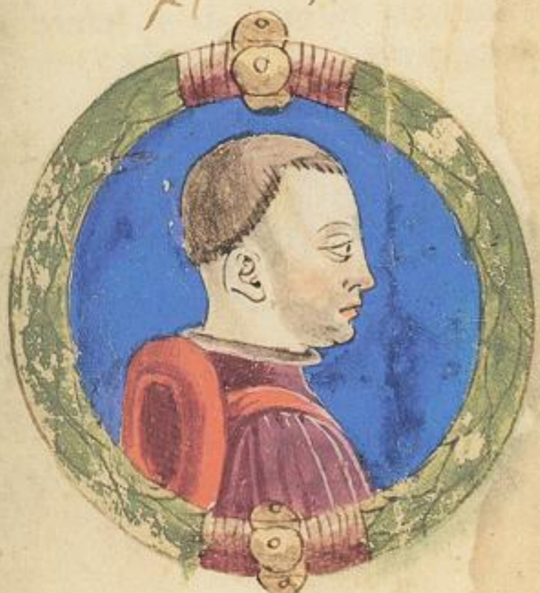
Tadio fu & fiolo de Aldrouan? mori del .1448.