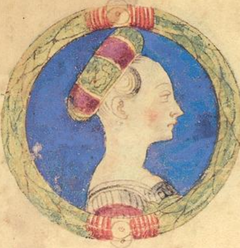
fu fiola de qsto Acgo e fu marita in .