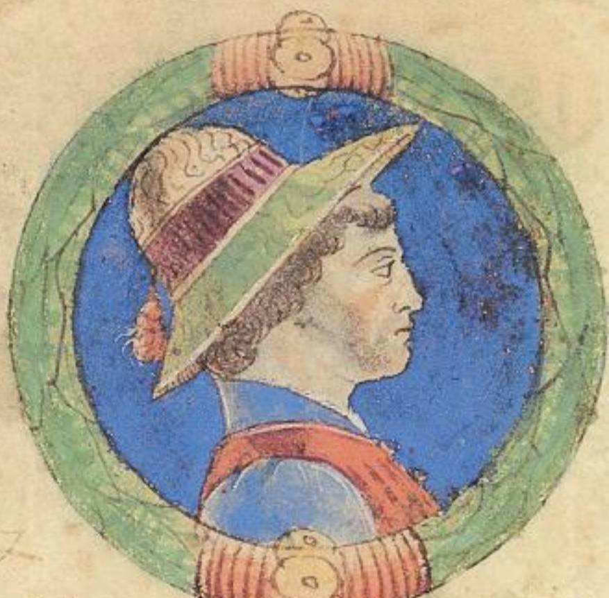
Obizzo fu fiolo de Aldrouandino de obizzo de Ramaldo.