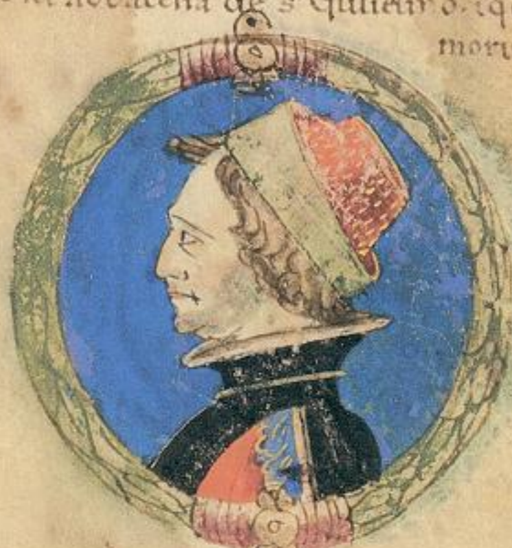
Bertoldo fu fiolo del supracelto Tadio.