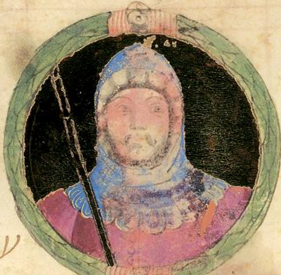
Fresco fu fiolo de' ... et in sancto Campolo fu sepolto. Et era fiato.