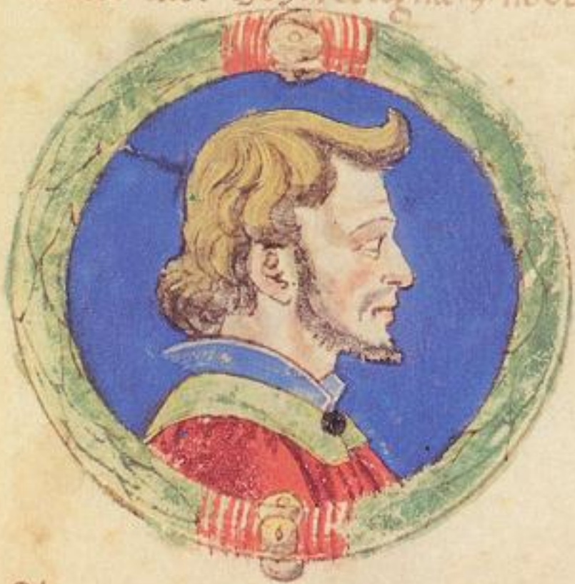
Obigo fu fratello del isto Ramaldo de' Nicolo.