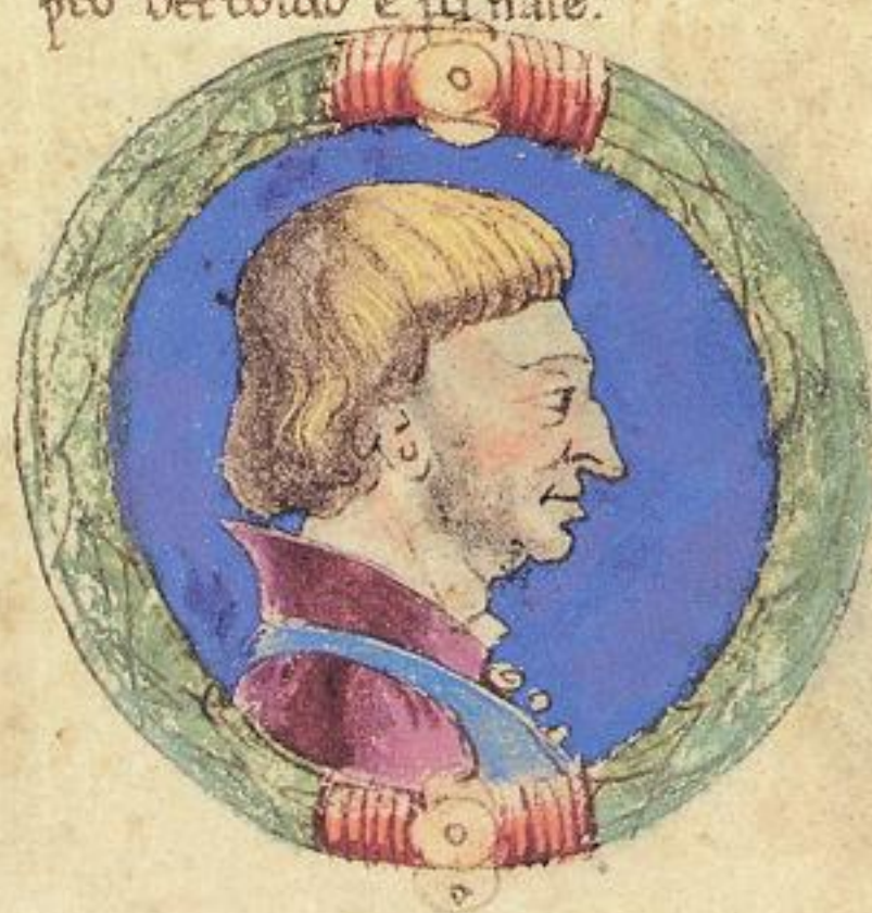
Freico fu frate lo de' Tadio s to n ale .