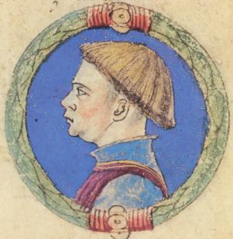
Nicolo fu fratello de' questo Ramaldo n ale .