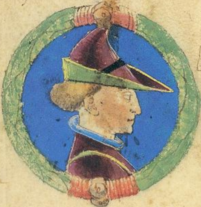
Nicolo fu fiolo de Obigo