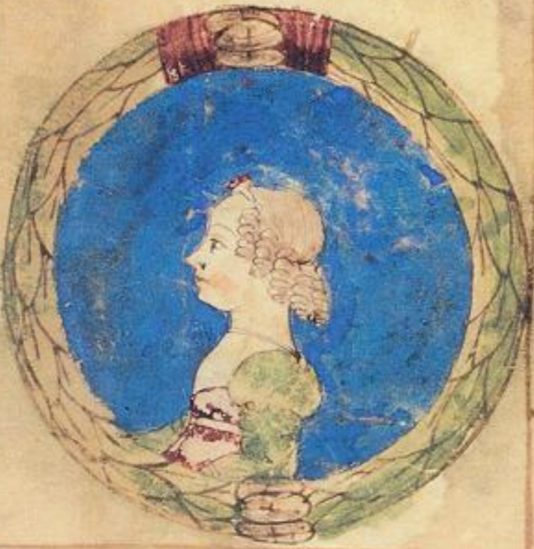
Lucretia e fiola uale del supralceto Sig o fratello del duca hercole uo et e sorella d'Isota che s'io et ha anni