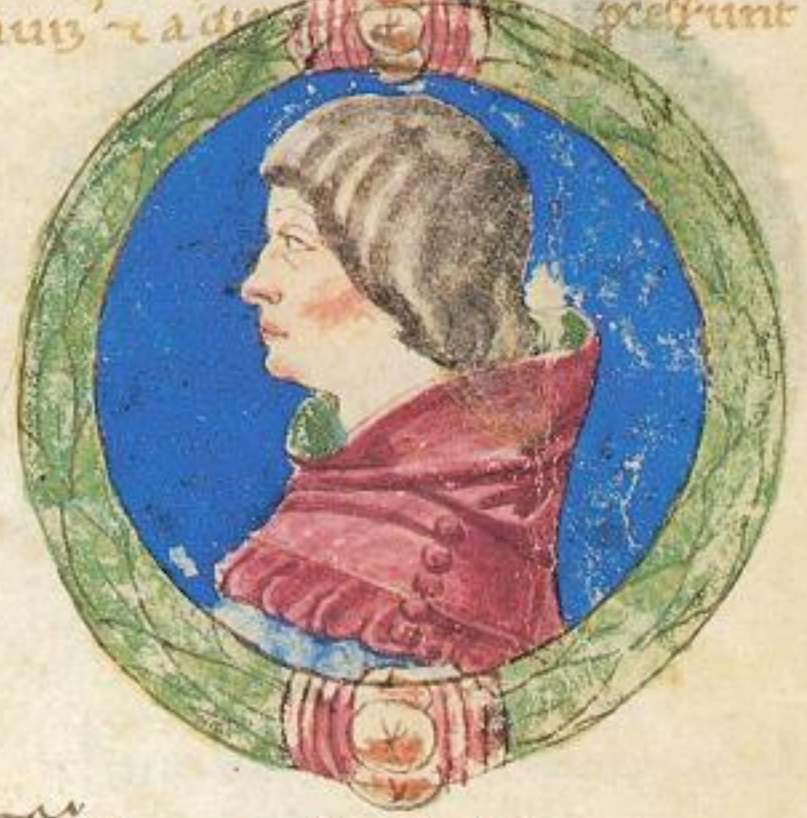
Folcho fuit filius de Alberto acco.