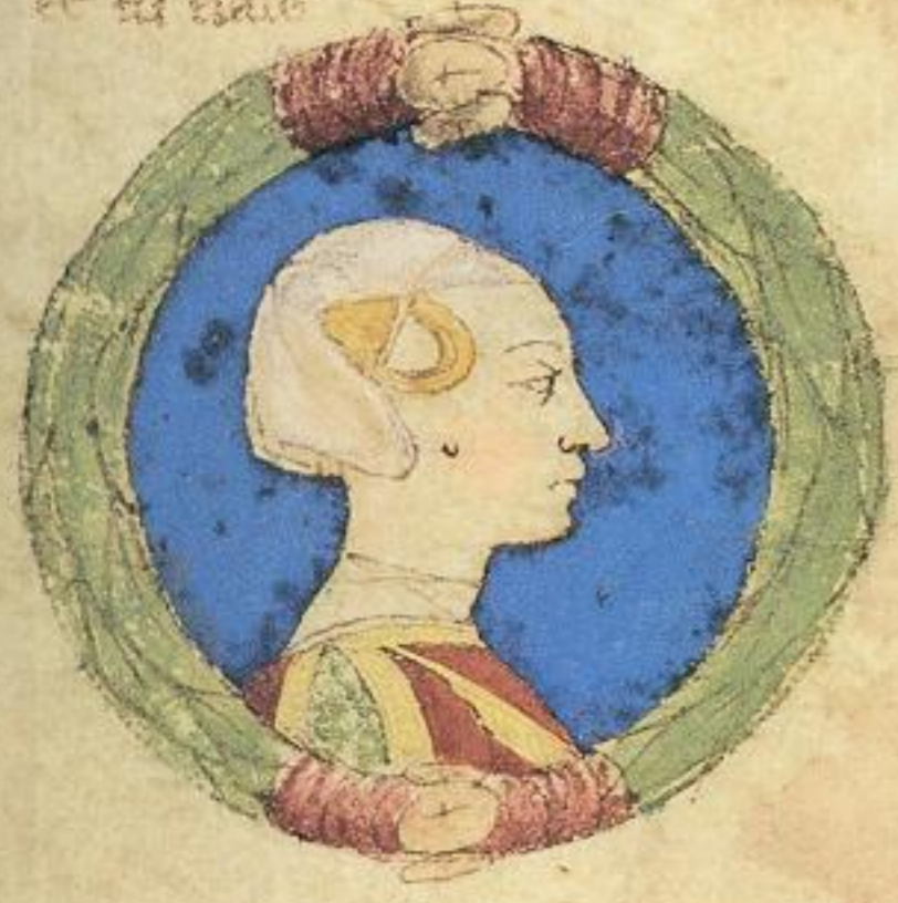
Isota fiola de Miliaduce. del. 1474. e sora de sancto Guilmo. et fu niale.