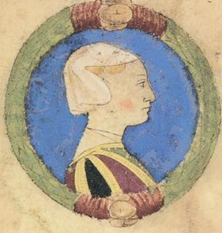
Lucretia fiola de Miliaduce. more d Pietro dal sacro. et fu niale i ferr.