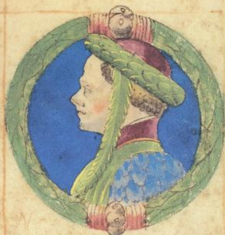
Aldrouandino fiolo nãle de questo Ray fu epo de Adri. Modena e dy ferr. morite del 1377.