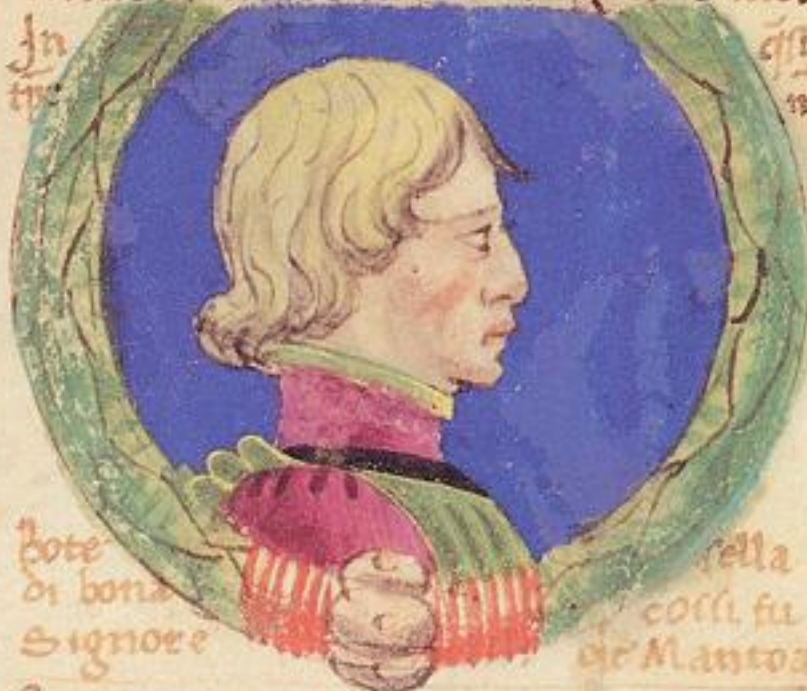
Guron fu fiolo de' brolo de' Ago. supra scripto. In tte. pote di bona Signore. Nella colla fu de' Mantua.