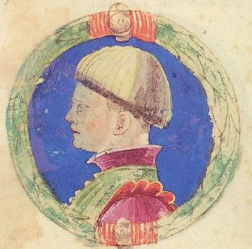
Jacomo fu fiolo de' de Guron. 2.