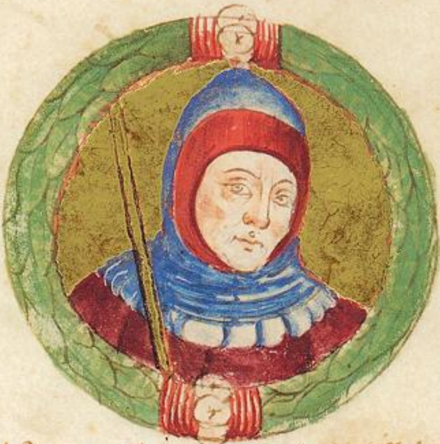
# Questo Obigo fu fiolo de horo horo de de Acço e fu el quarto de de de de