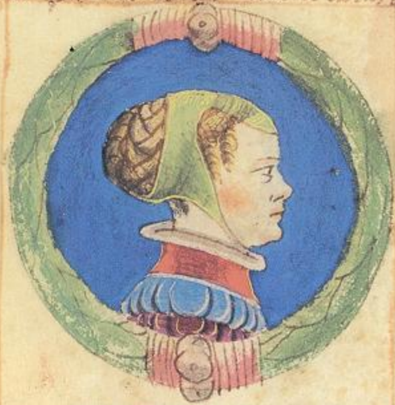
M de questo Acço de Ramaldo et era de pua. fu more