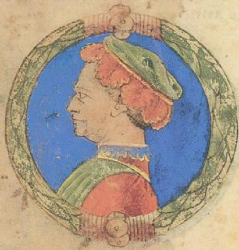
Acco fu il quarto fiolo d'Aldrouandino e y' lu fu la guerra da porto del .1302. ad .12. aprile. er in fine ando