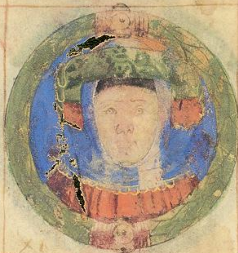
Questo Aggo fu fiolo et de isto obizo de adrouandino de obizo