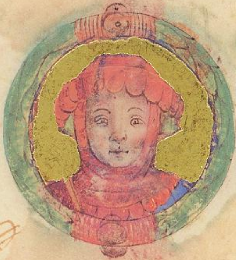
Ago fu fiolo de' obigo. de' Raynaldo proxime scripto fu S. d'Ancona. ferr. Modena z Rege se conte de' pma Andria. mori del. 1407. e se as Duce.