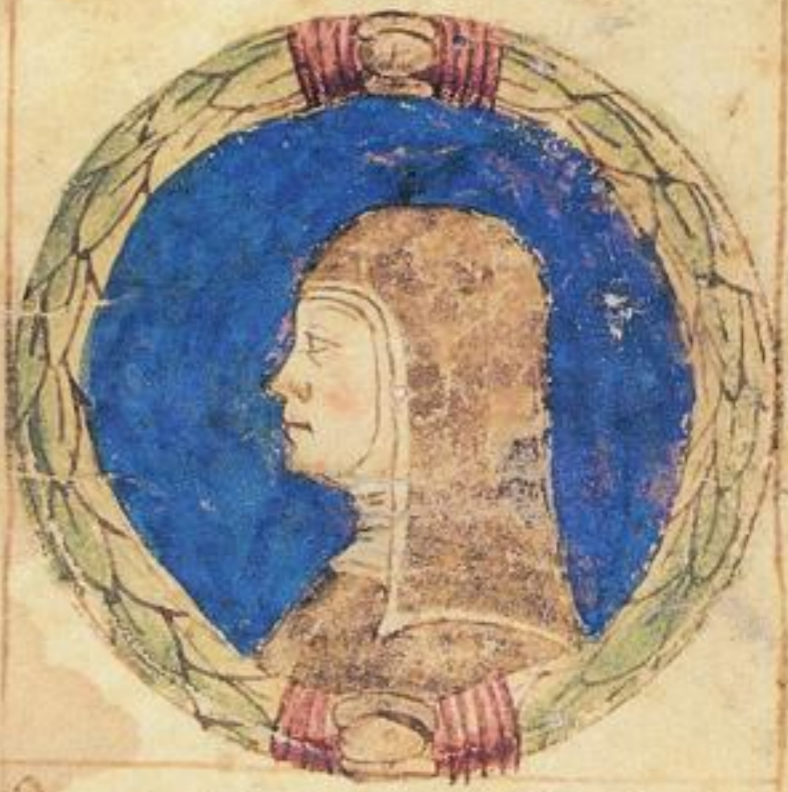
Questa laura soe de s co Antonio fu pure fiola de nihaduce s co la non sia cum le altre sorelle et fi uale uue m. 1474.