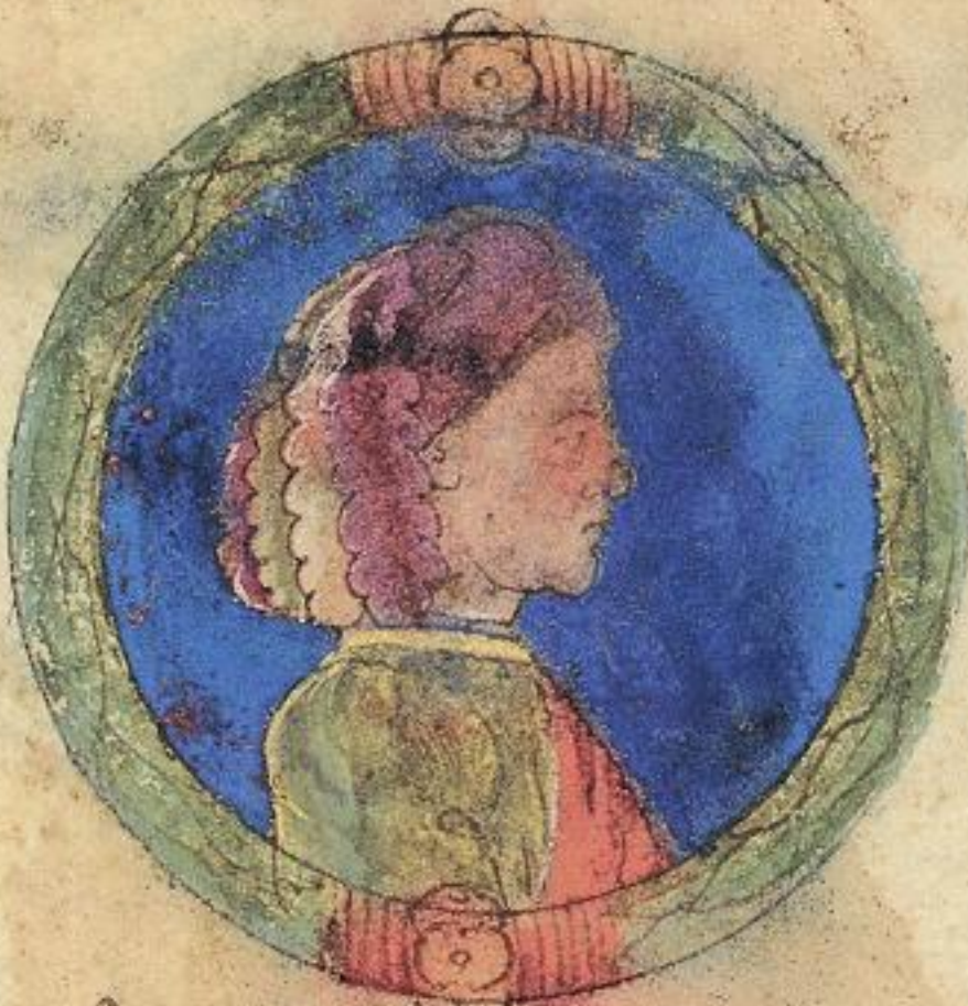
Francesco fu fiolo del contras to pto Aldrouandino.