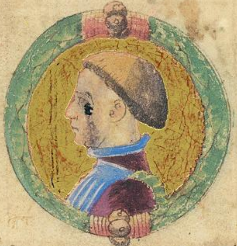
fratello e mori del 1336