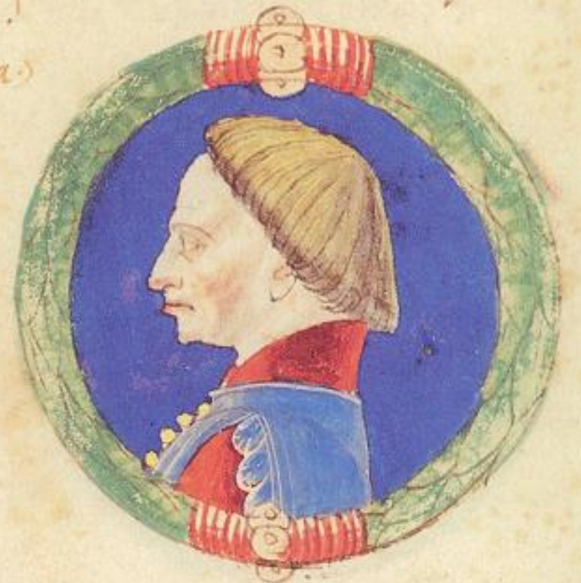
Francesco fu fiolo del isto Guron. 4