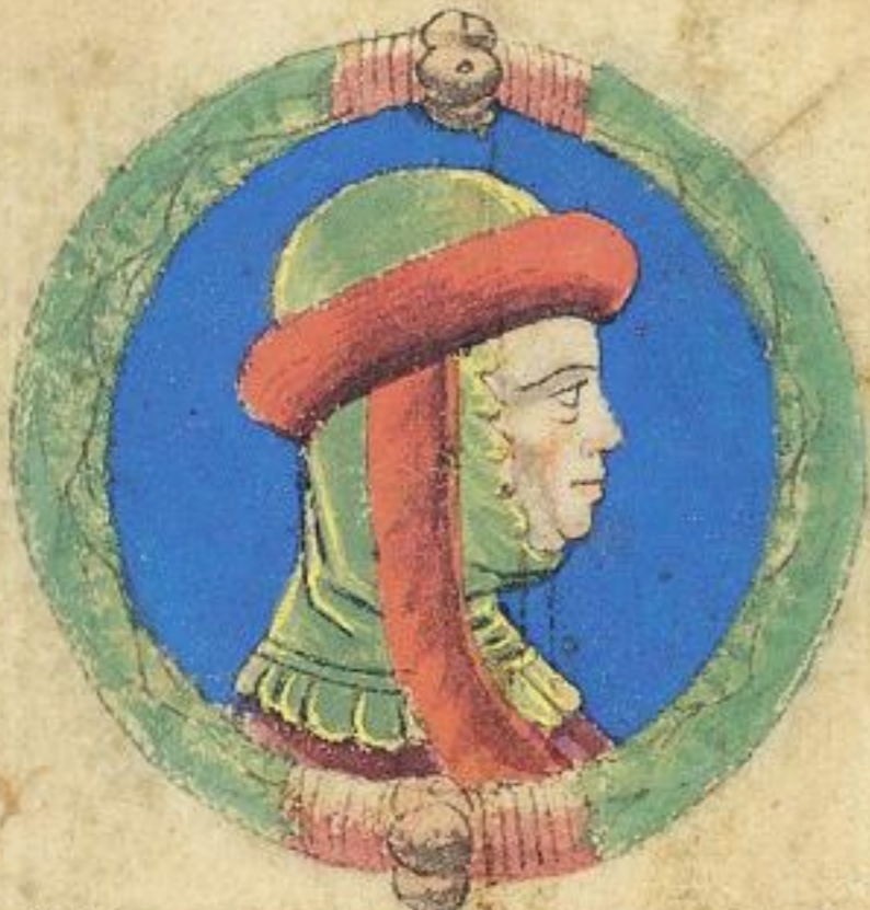
Aldrouandino fu fiolo de questo Obigo.