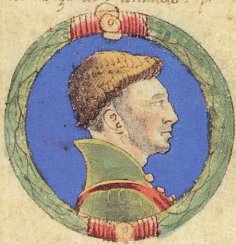
Questo Tadio fu fiolo del suprase to pto Bertoldo e fu n ale .