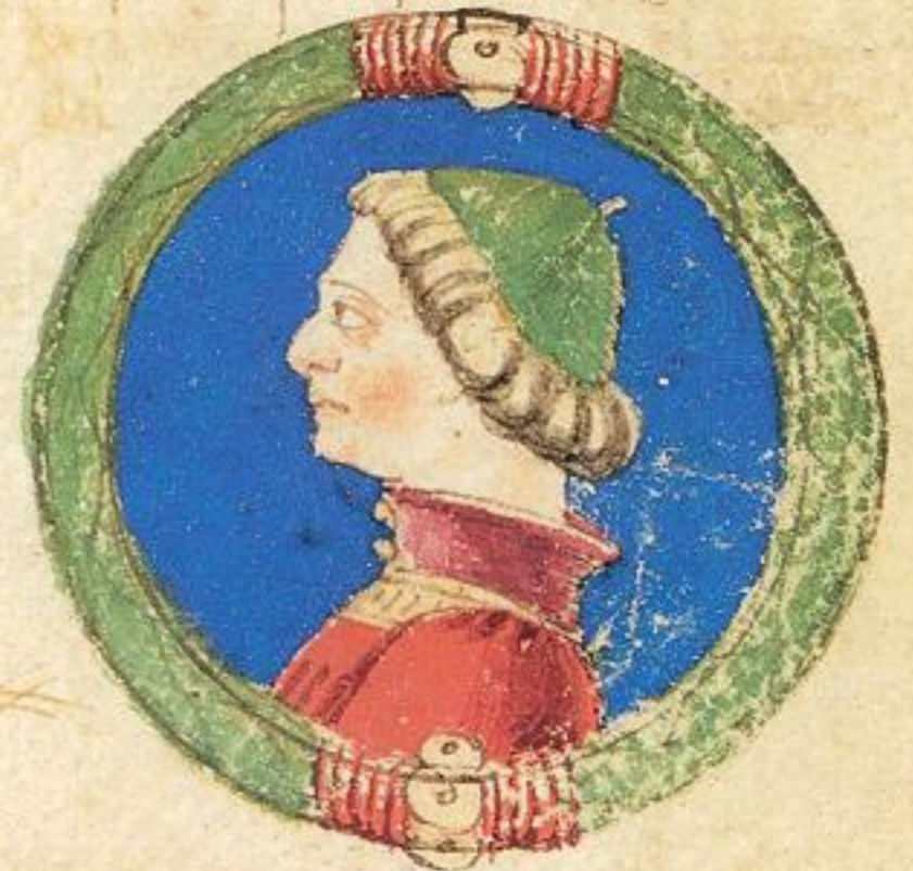
N Acgo fu fiolo de questo Rainaldo s