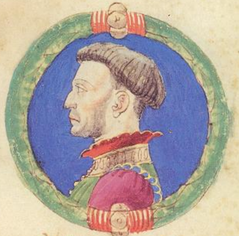
Francesco fu z fratello di scripto.