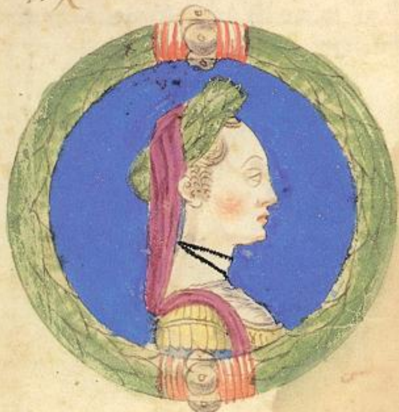
Questa m. Cubitosa fu fiola del sto Ray de Aldrouandino de Obizo de Ramaldo