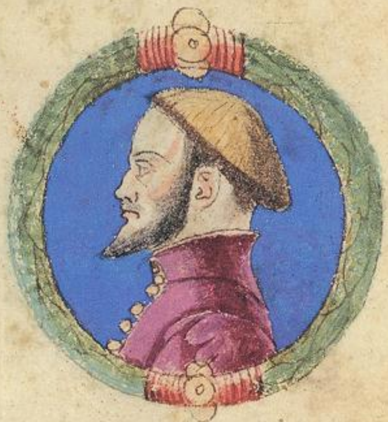
Bertoldo fu s to del dco Tadio.