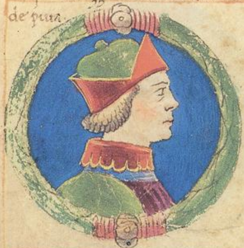
Obigo fu fiolo de questo Acço