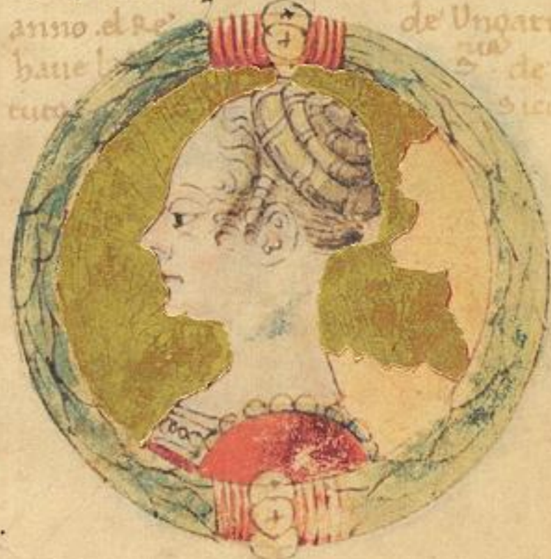
M. biatrice fiola del Re Carlo fu la seconda moie de lo ito Obigo.