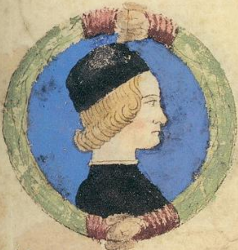
Nicolo fiolo de m. Miliaduce. naturale unue. 1474. e sta. Mode na.