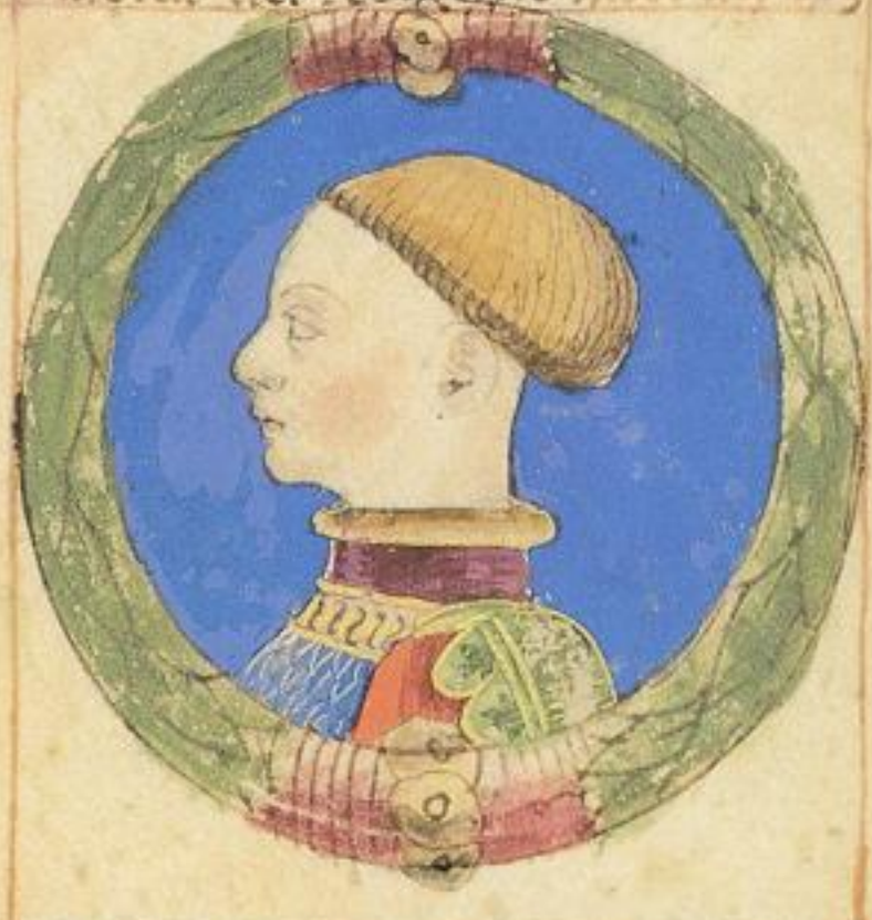
Aggo fu fiolo del isto Rainaldo fra tello di dicti fratelli moie 1371