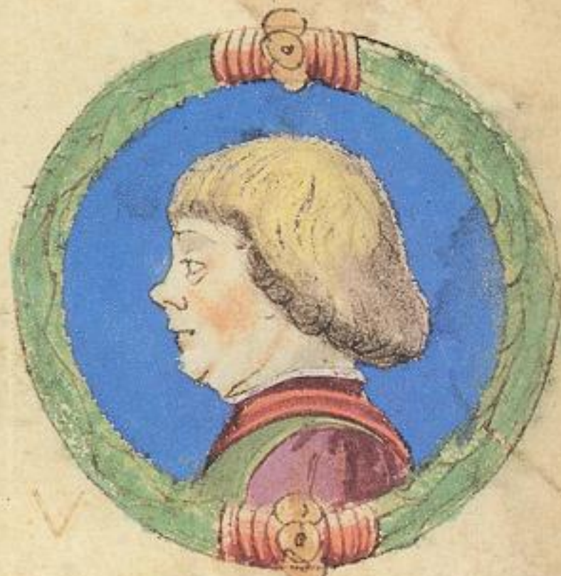
Aldrouandino fratello del contra scripto Aggo mori i bologna del. 1376.