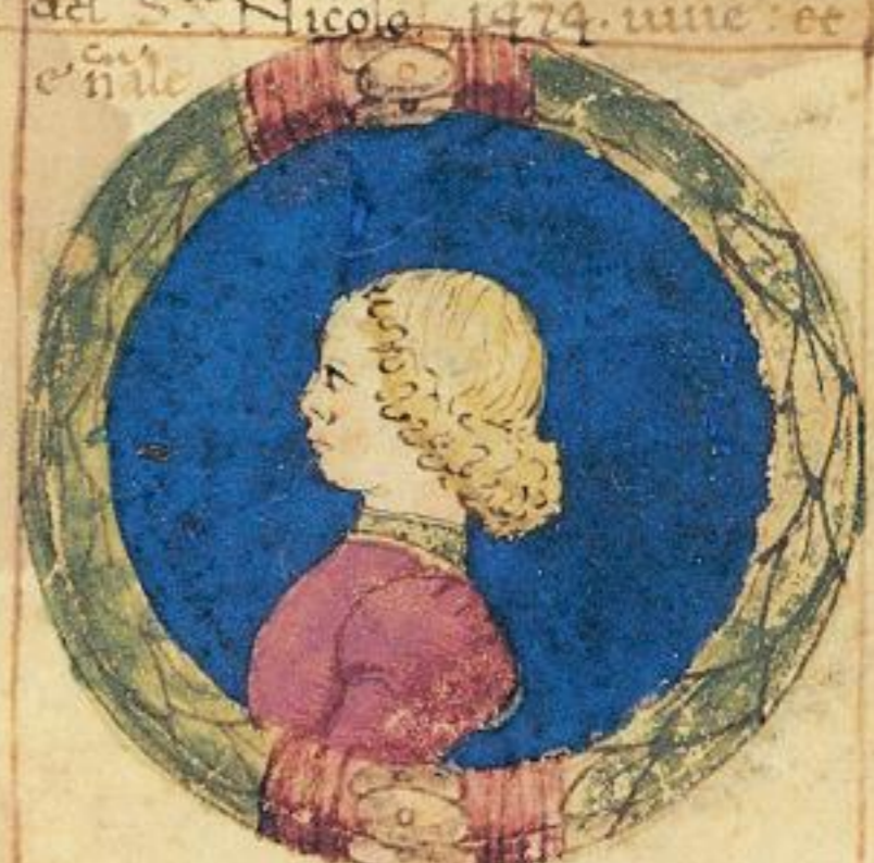
Berto e fiolo de Alberto de Nicolo de Alberto. 1474. uue. et e uale