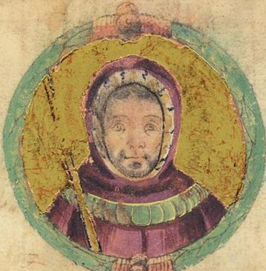
Obigo fiolo del Sto. A. di Obigo fu lo 8 o e dno