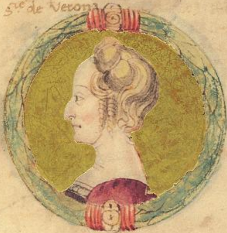
M. Tadea da la scala fu moie de qsto Acgo signore. seconda.