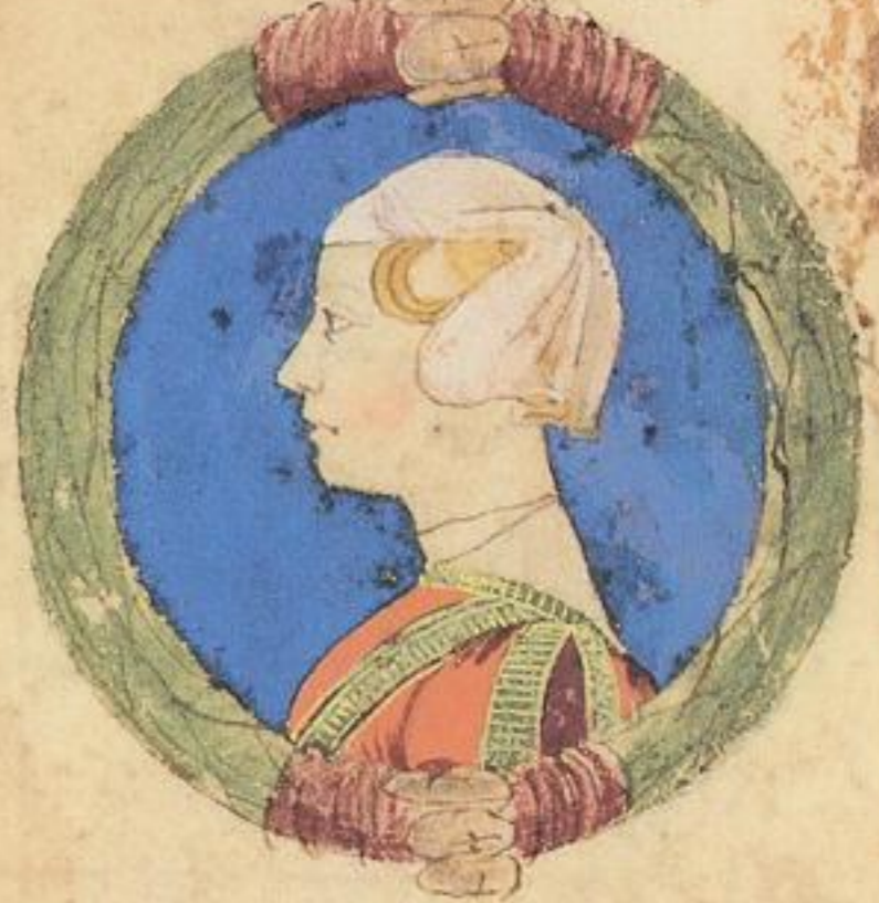
Polisena fiola et de Miliaduce. z more de n. Goanne de romio da Ferrara. unue dei. 1474. e fu niale.