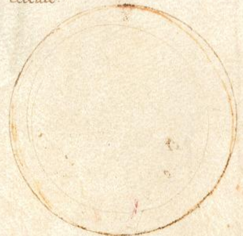
Questa Biatrice naque del. 1474. adi 27. de giugno de li Illu o M. Duchessa leonora e del duca Hercules. Na- que del. 1475.