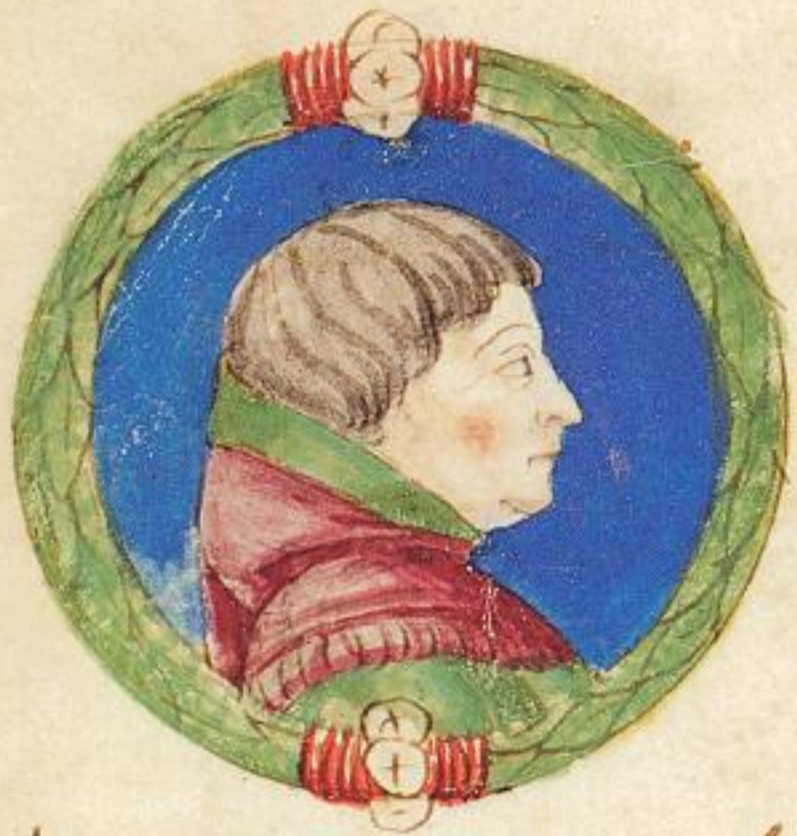
Acço fu fiolo de questo Obigo. 6.