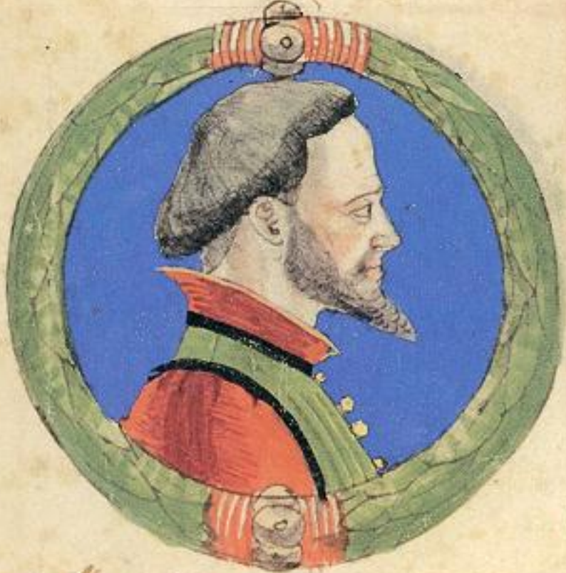
Acco fu et fiolo de' Guron.