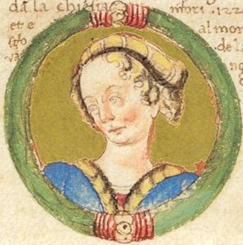
N de puia fu moie de questo Acgo Signore?