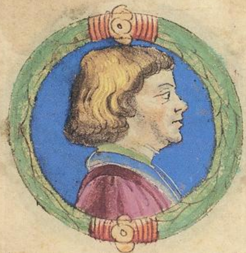
Aggo fu fiolo del mto obizzo de Ray.