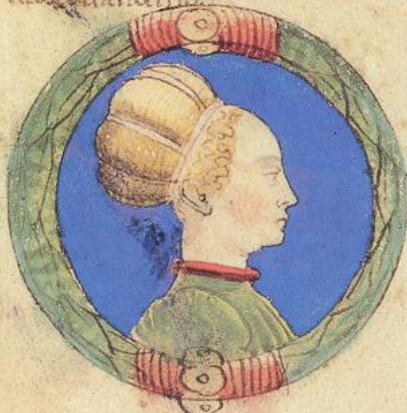
M a Jacoma de' Romio di pepur da bologna fu moie' del contras to pto Obigo de Aldrouandino. 1317. e menola a Roigo doue' il stava.