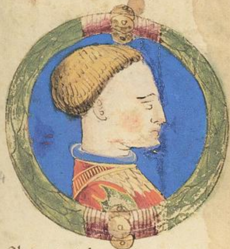
Obigo fu fiolo de qsto Aldrouan?