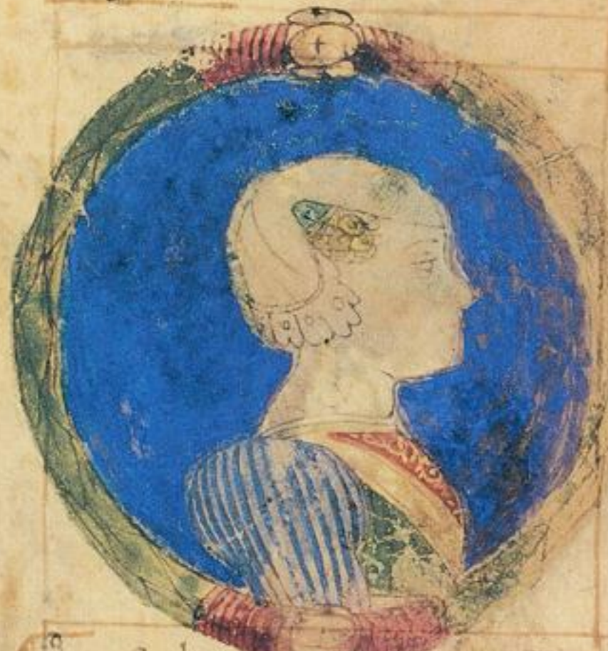
Questa lucretia uale fiola del s co de Monferato e moie de Ra o de Nic o s co