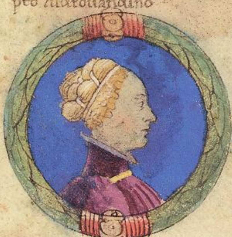
Elisia fu s ta fiola del s to scripto Aldrouandino.