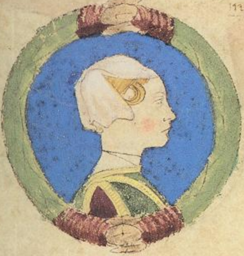
Pantea fiola de dco Miliaduce. e Sor de sco Antonio i ferr. 1474. et fu niale.