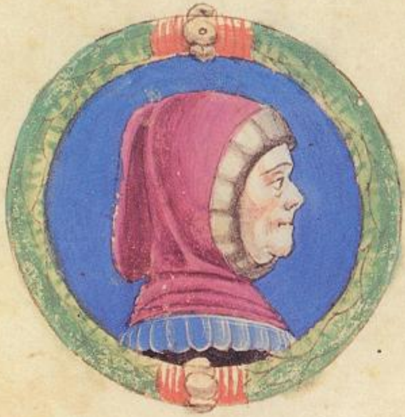
Ramaldo fu fiolo de' Nicolo predicto. morite' del. 1369. itologna s nobre.