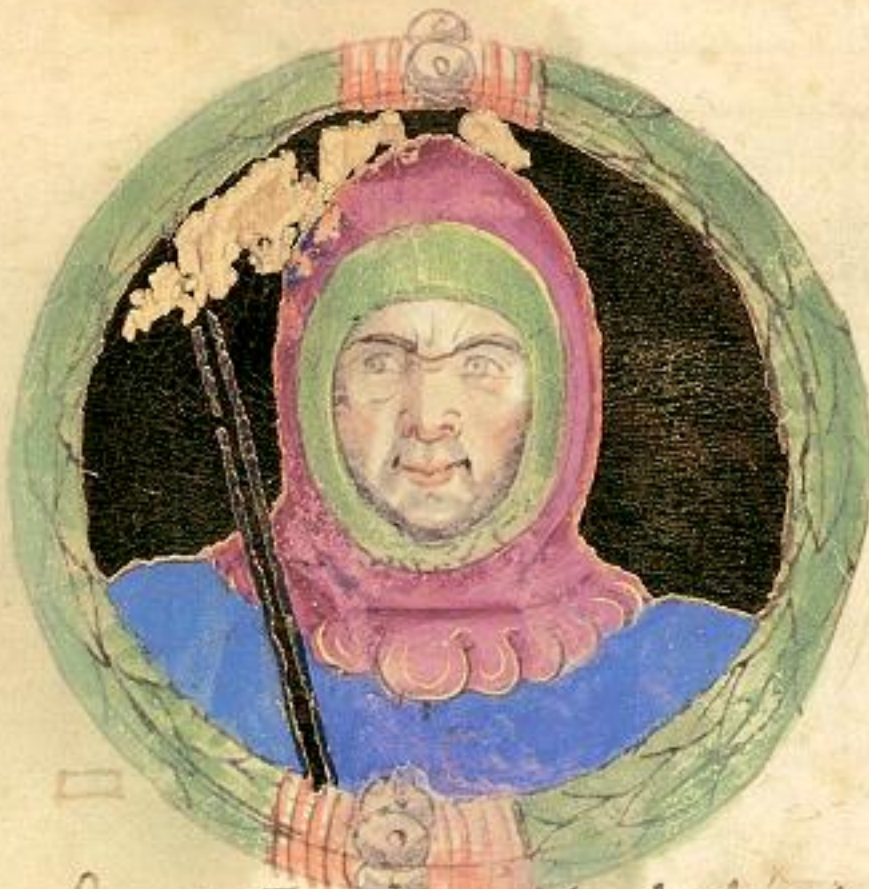
Questo Francesco fu fiolo de Obizo de ... et domino cum la chie sa poi fu cagato da epia chie. el se re- dusse astare iuso el polesene. z tande fu morto suso la porta del Leon del 1312. fu il 7. et Dalmato et Ra- maldo fratelli di bagnoli fueno che lo amaciono. Et ferraresi tue se deteno a Venetiam li quali quat mesi e meco la teneno cum chi po- terati m. m. Vitale da cha michele et m. Coane sourango. Et poi la chie- sa se la tolse cum quera re alpo de papa chimento. q.