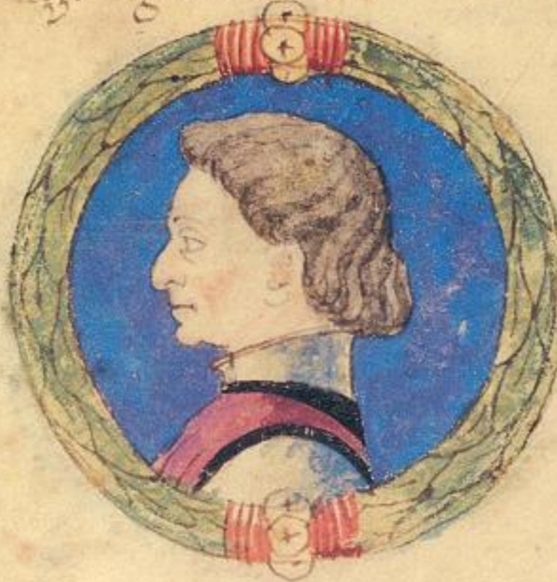
Questo Obigo fu fiolo del Ramaldo e fu S. de .