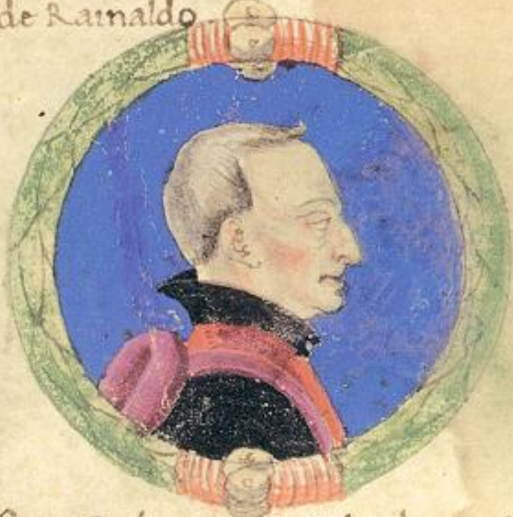
Questo Jacomo fu fiolo de questo ste Francesco d' Obizo e mori del 1349. p.