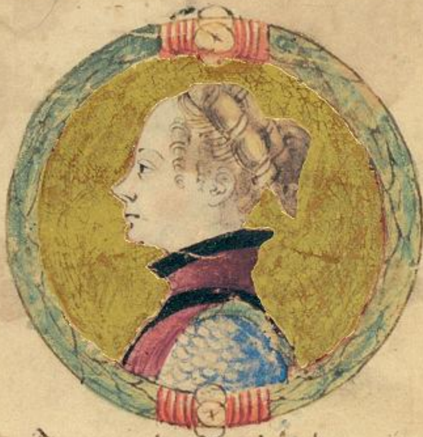
M. Joanna di urini fu la pma moie de lo ito Obigo del .1782. et in dco anno d. re. de Ungaria haue l. de Sicilia.