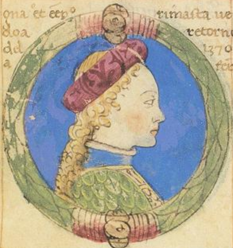
Alda & sorella de questa Biatrice fu moie de n' lud. da goncaga. 1356.