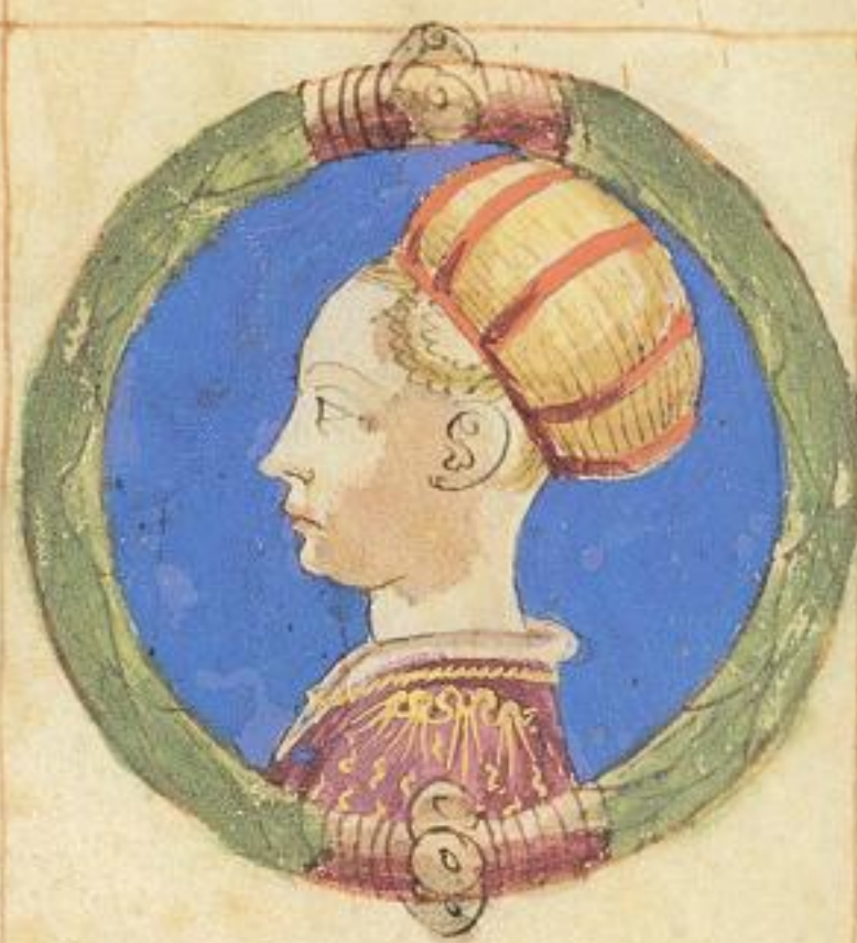
Constanza & sorella di dicti. fu marita ad Arimino moie del 1373