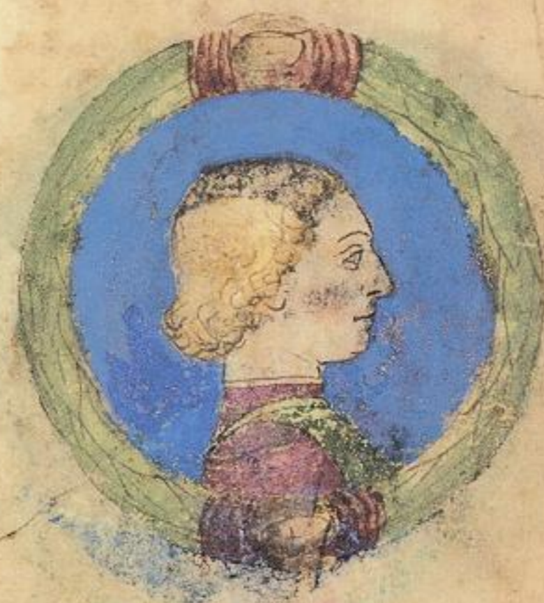
Scipion fiolo de Miliaduce. e pue naturale. 1474. unue. i ferr.