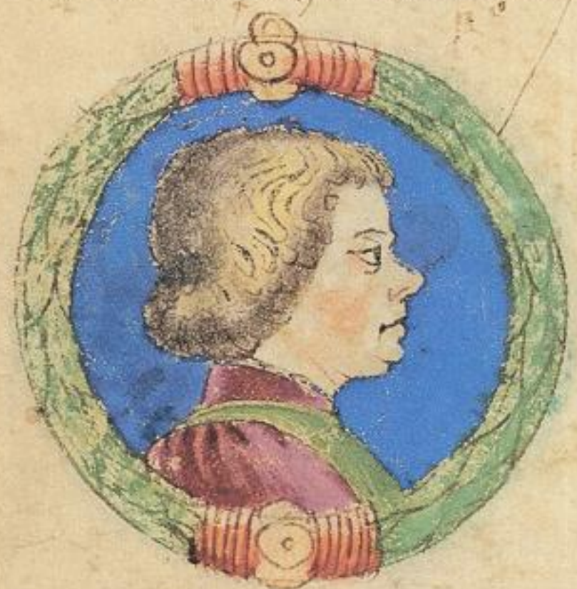
Aggo fu fiolo del mto francesco de. e mori del. 1318.