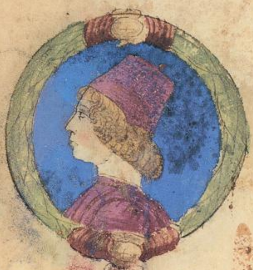
m. Polidoro fiolo de Miliaduce. e pue re niale. et e chierico. 1474. unue.