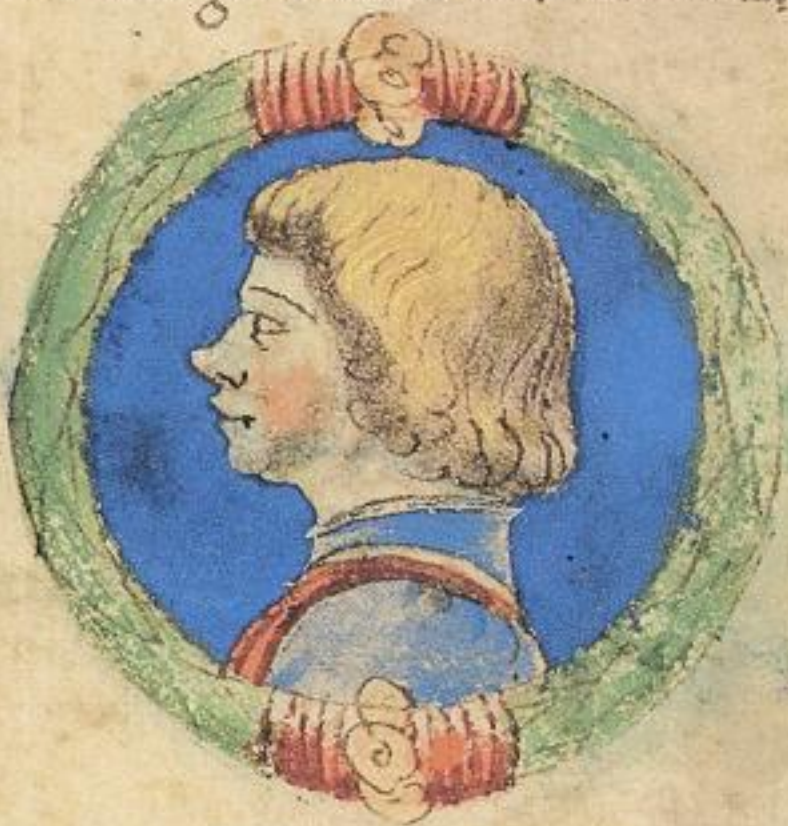
bertoldo fu fiolo et del mto Aggo de francesco.