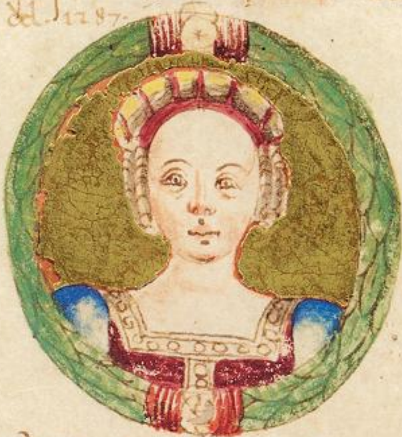
M da Fiola del S to da la scala fu la terza moie de questo Obigo. Madra