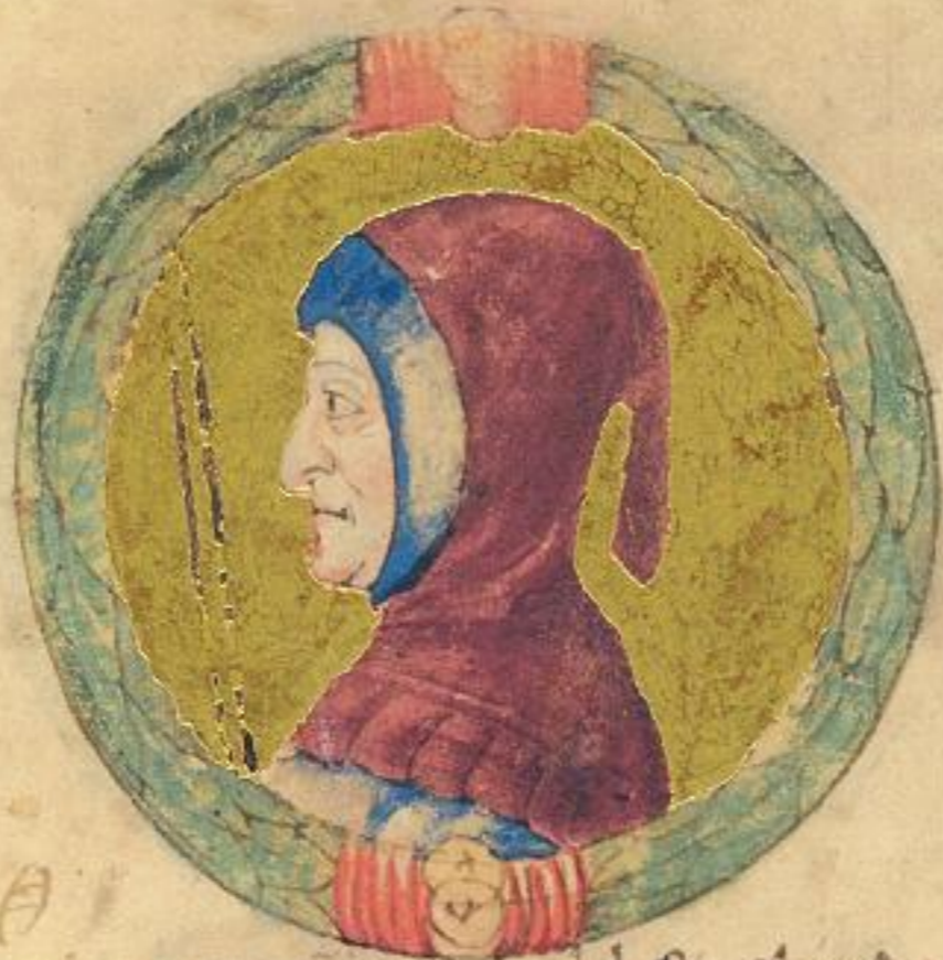
Acgo quinto S. fu fiolo del Sto Obigo Ray. fu el quinto S. e scdo mnestito. fu S. de Verona.