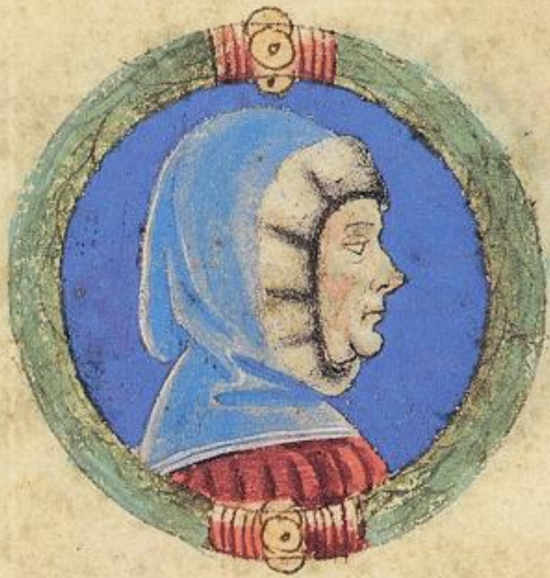
U' - Franco fu fiolo del s to Agostino de' Obigo de Ramaldo.