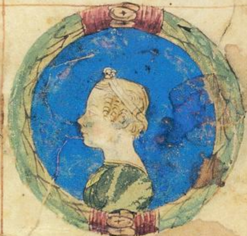
Margarita e fiola del s co Alberto del s co Nicolo. 1474. uue. et e uale