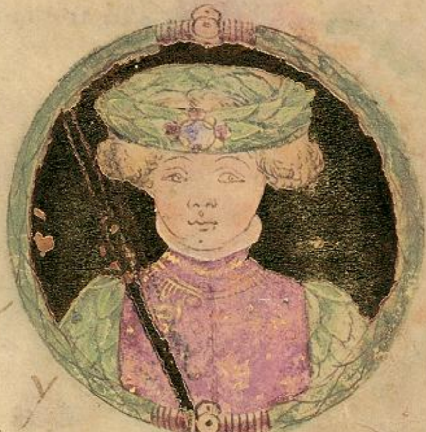
Aldrouandino fiolo de Obigo e fu il .9. S re mori del .1361.