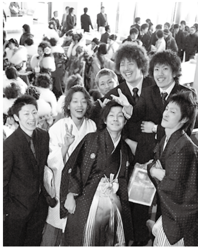
写真 de もりおか