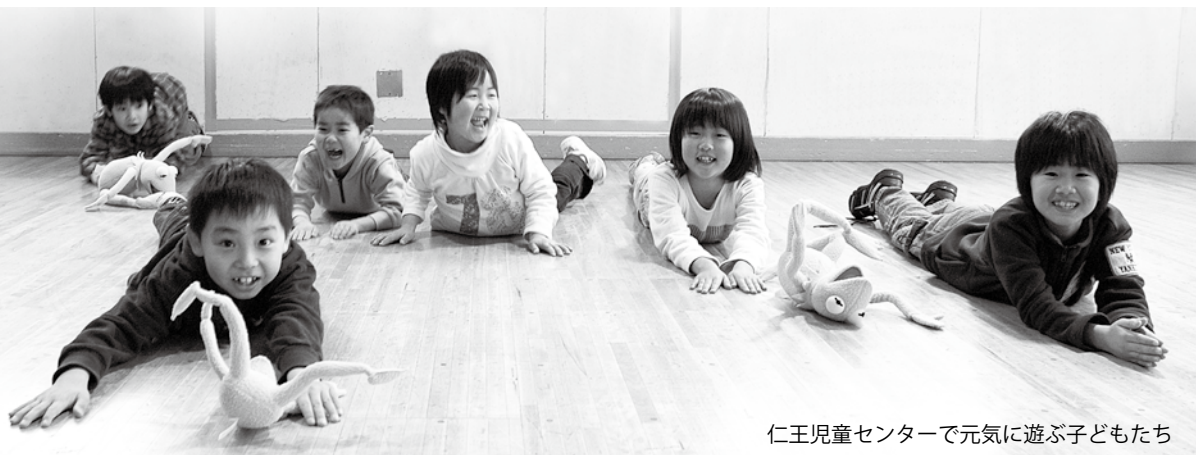
仁王児童センターで元気に遊ぶ子どもたち

児童センターや児童館は、主に小学生が楽しく安全に放課後を過ごすための施設です。読書のほか、一輪車などさまざまな遊具で遊ぶことができます。また、児童厚生員や専門の講師が遊びなどを指導します。担当は児童福祉課。