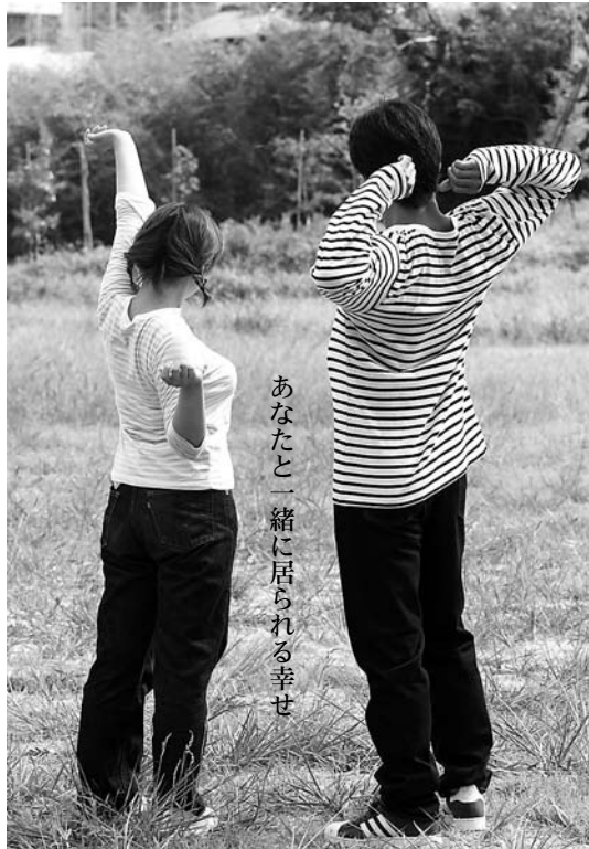
あなたと一緒に居られる幸せ