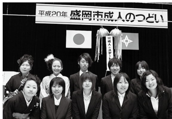
今年の成人のつどい実行委員の皆さん