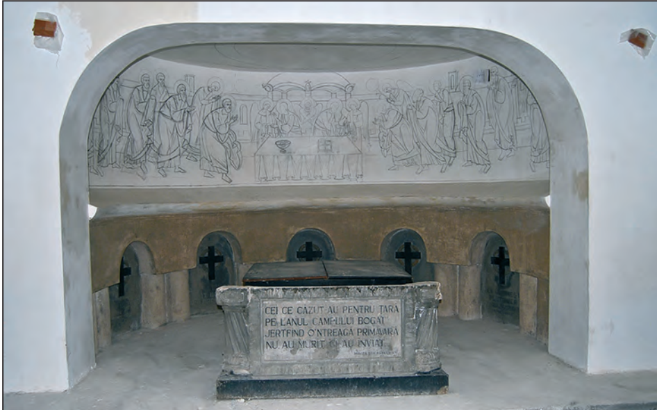
Detaliu de la intrare

Ultima statistică 13 privind numărul eroilor din mausoleu datează din anul 1943, menționându-se că osemintele a 762 de militari au fost depuse în criptă 14 și în firdi individuale 15 .