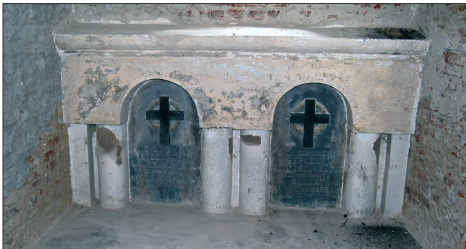
Detaliu cu cripte individuale