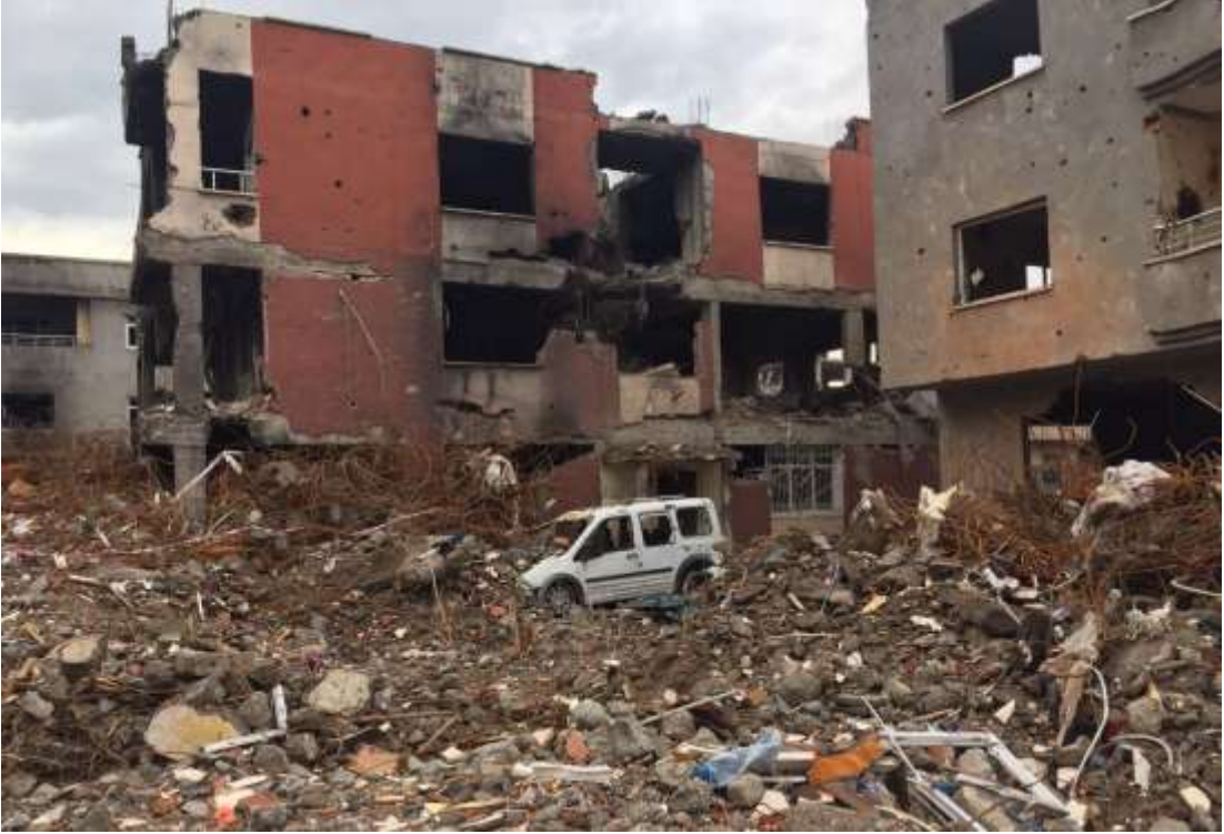
Foto 7. Narin Sokak'taki bodrumun yer aldığı binanın molozla düzlenen hali