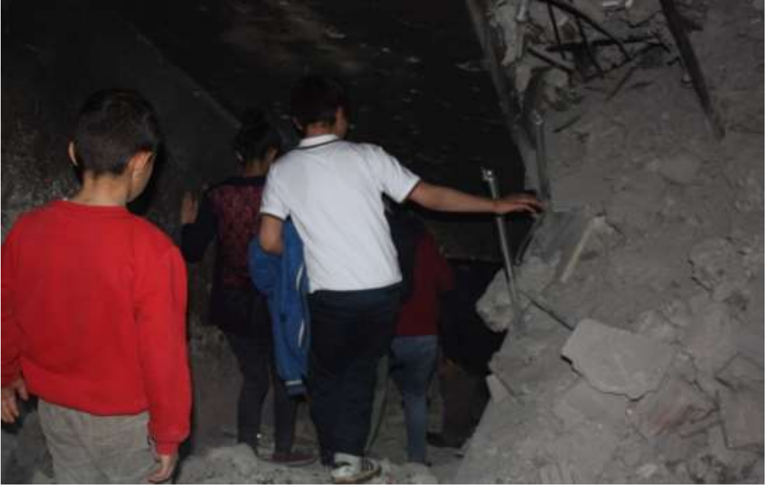
Foto 6. Bostancı Sokak'taki bodrumun girişı