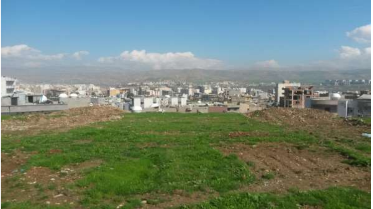
Foto 4. Sur Mahallesi yamacında iki tankın ilçeye doğru mevzilendiği söylenen noktalar

“Gençliğin de hatası vardı, buralarda çoluk çocuk var ama bomba yerleştirmişler. Bombanın yeri mi burası! (Bombanın evin yakınına yerleştirildiği yeri gösterdi, evin yanındaki yamaça yerleştirilen bombanın kablolu ve uzaktan kontrollü olduğunu belirtti.) Evet, nöbet tutturuyorlardı. ‘Niye ben nöbet tutuyorum da bu ev tutmuyor?’ diyordu bazıları. Her evden bir kişi gidiyordu nöbete. Biz çıktıktan sonra evime askerler yerleşmiş, evin içi mahvolmuş. (Ev yamaçta olduğu için yanında iki tankın Cizre şehir merkezine doğru mevzilendiği yerler görüldü. Buradan şehir merkezine doğru top atışları yapıldığı iddia ediliyor.)