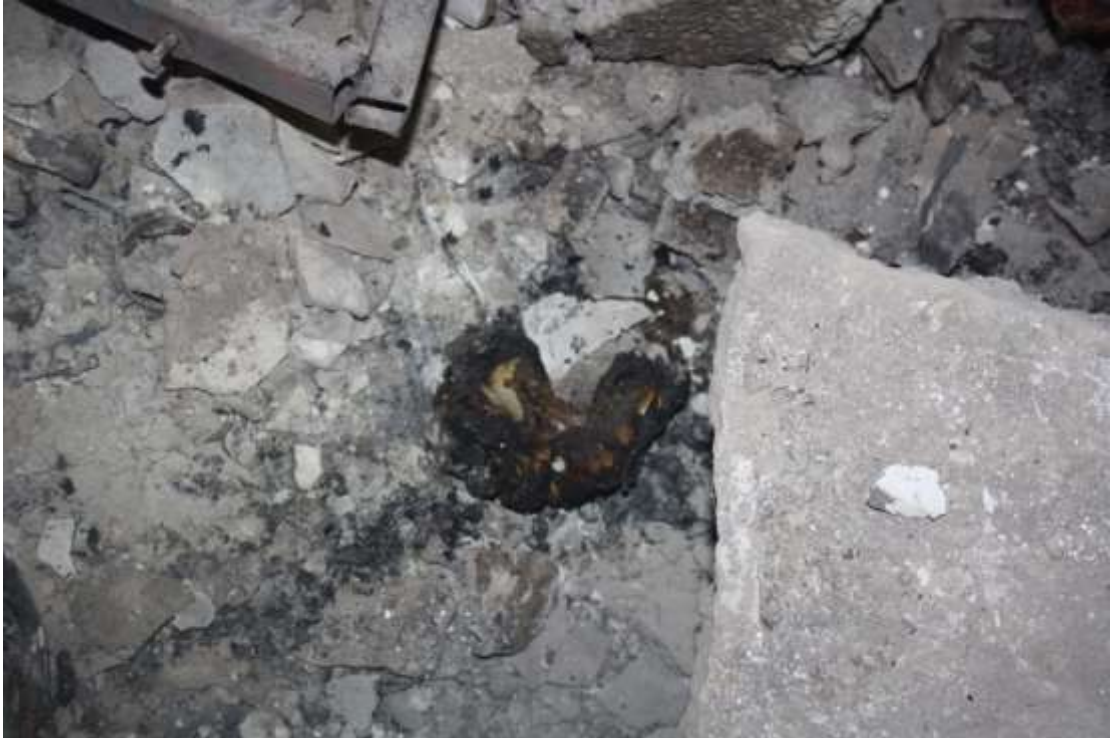
Foto 8. Bostancı Sokak'taki bodrumda yapılan incelemede karşılaşılan ve kısmen yanmış bir insan ayağı kemiği olduğu düşünülen bulgu.