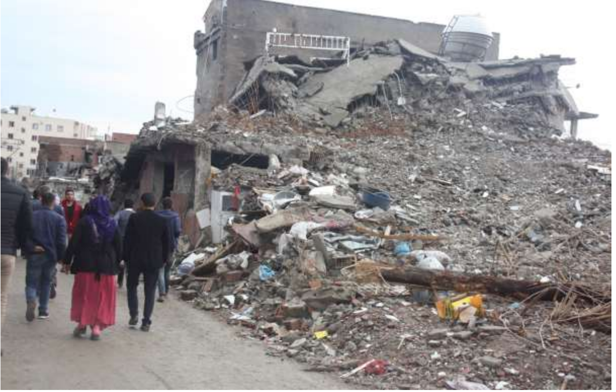
Foto 1. Bostancı Sokaktaki bodrumun dıştan görünüşü

-Yasak öncesinde YDGH'nin keyfi tutumları olduğuna yönelik iddialar var. Kimlik sorma, kontak kapatma ve anahtarı alıkoyma gibi eylemlerden bahsediliyor. Bu keyfi tutumlar denetlenemez miydi?