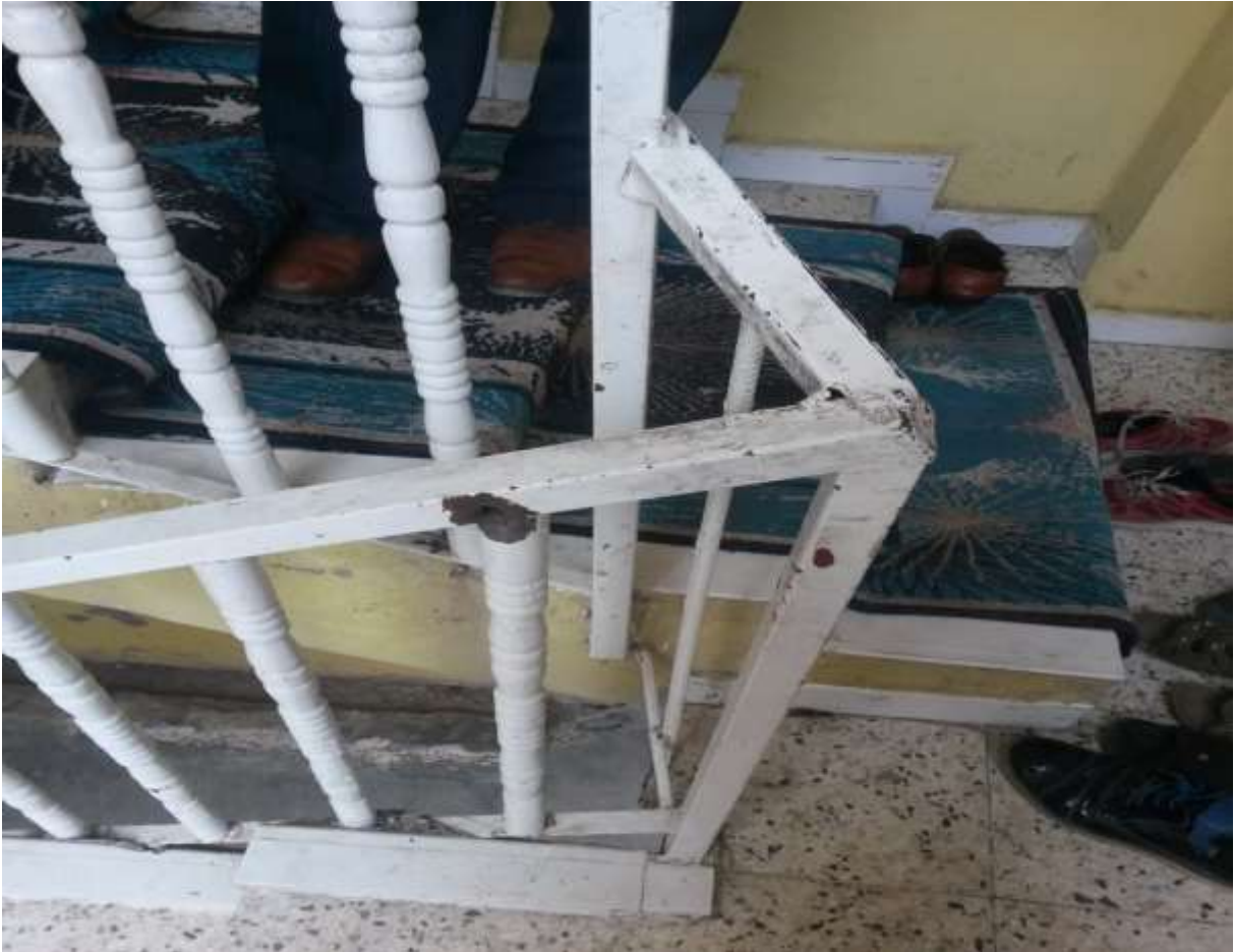
Foto 2. Miray İnce'nin vurulduğu iddia edilen noktada görülebilen bir kurşun izi

(İki katlı evin merdivenleri karşı tepeden rahatlıkla görülebiliyor, önü açık durumda. Miray'ın amcasının işaret ettiği tepe merdivenlere ve bahçeye hakim olup, polislin mevzilendiği iddia edilen bir nokta.)