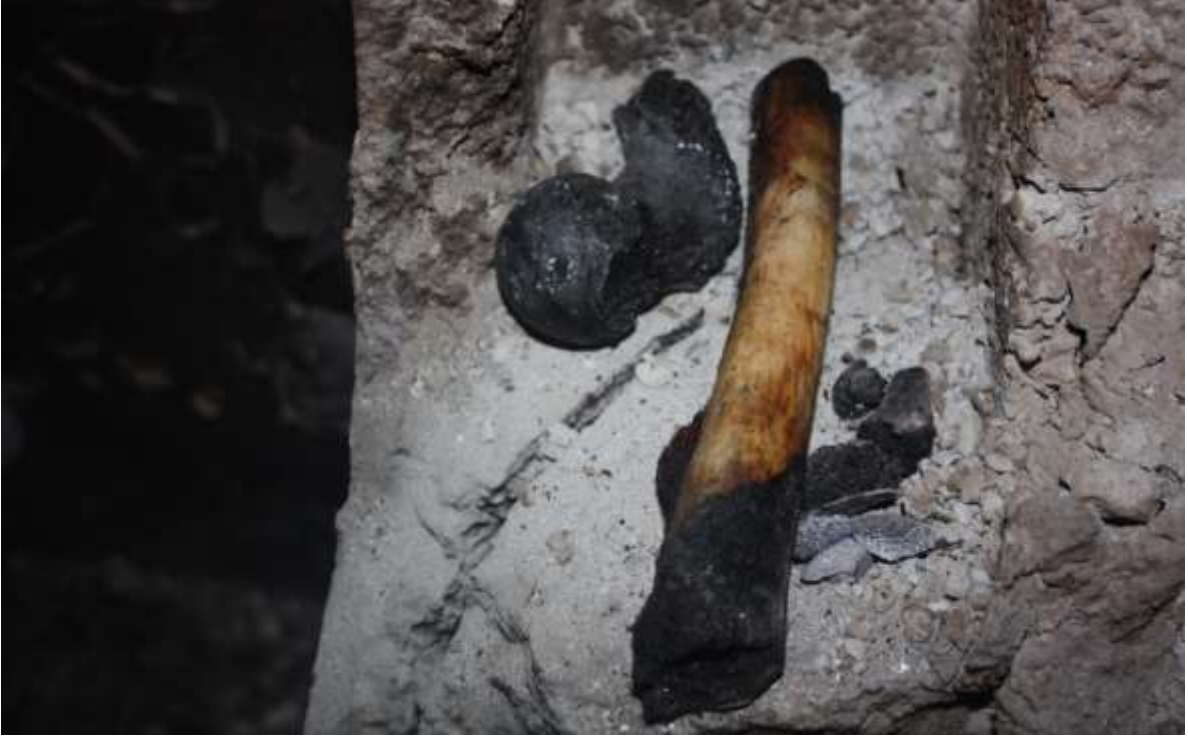
Foto 3. Bostancı Sokak'taki bodrumda yapılan incelemede karşılaşılan ve kemik olduğu düşünülen bulgular.

Osman Duymak: “İMC TV izliyorduk, ambulans çıkıyor haberi çıkar çıkmaz hemen bomba sesini duyuyorduk”.