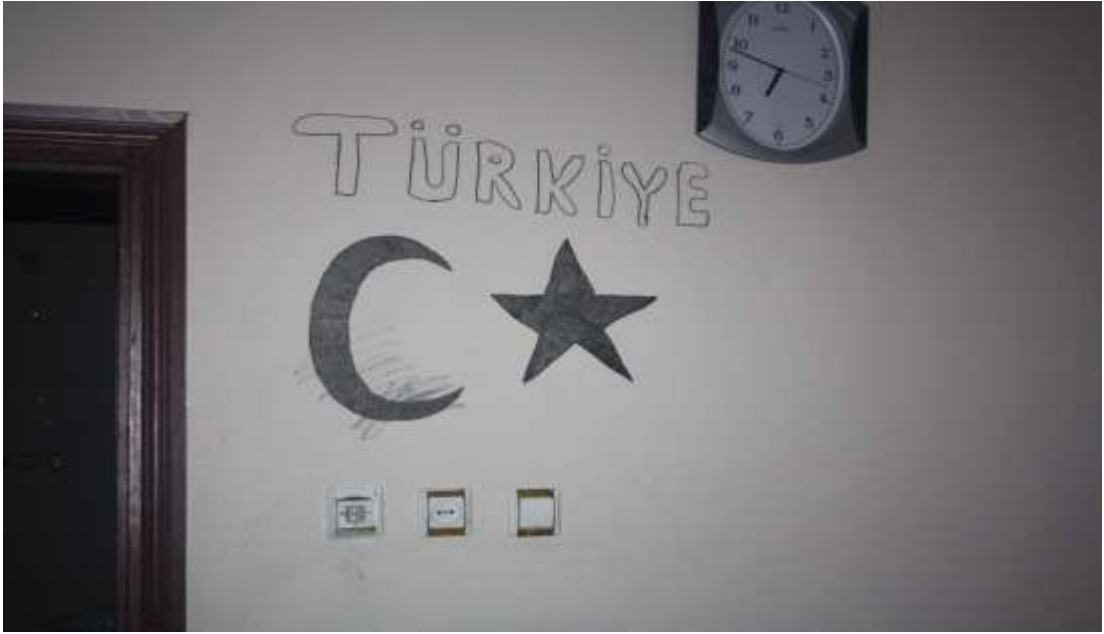
Foto 5. Ev içinde bir duvar yazısı