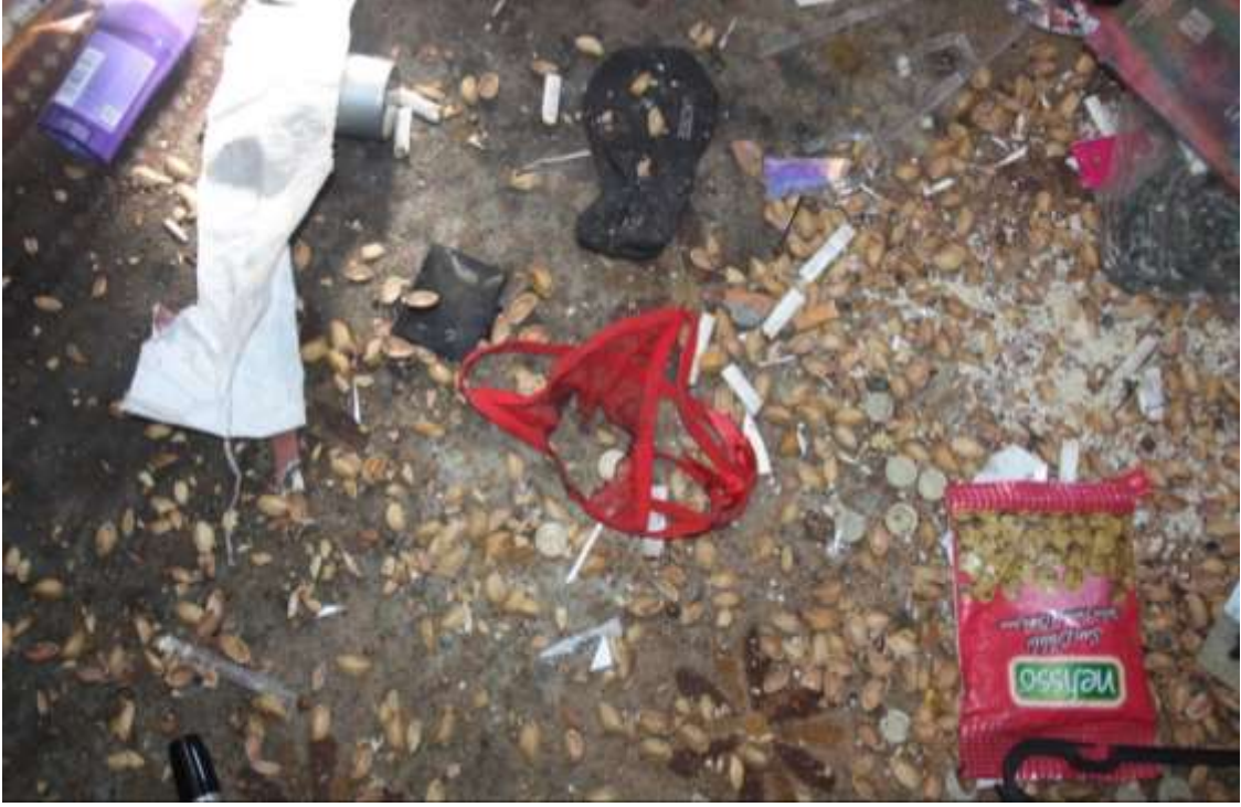
Foto 10. Kullanılan bir evin zemini ve kişisel eşyalar karıştırıldıktan sonra yerde bırakılan bir kadın iç çamaşırı.

34. Kaymakamlık ve Savcılık ile yaptığımız görüşmelerde heyetlerimize bilgi verilmesinin uygun görülmemesi nedeniyle saha gözlemlerimiz esnasında edindiğimiz bazı kanaatlerin ve şüphelerin cevaplanması mümkün olmadı. Bu nedenle aşağıdaki hususlar ve dile getirilen iddialar karşısında kamuoyunun tatmin edici şekilde bilgilendirilmesinin ve gerekli açıklamaların yapılmasının gerekli olduğunu düşünüyoruz: