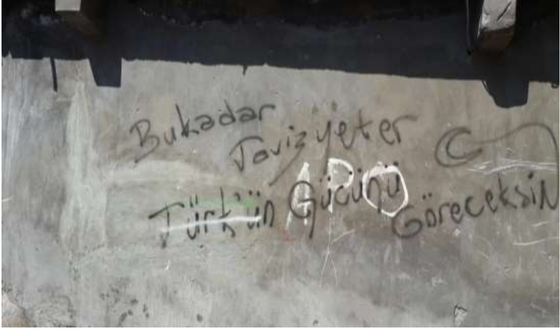
Foto 9. Bir duvar yazısı.