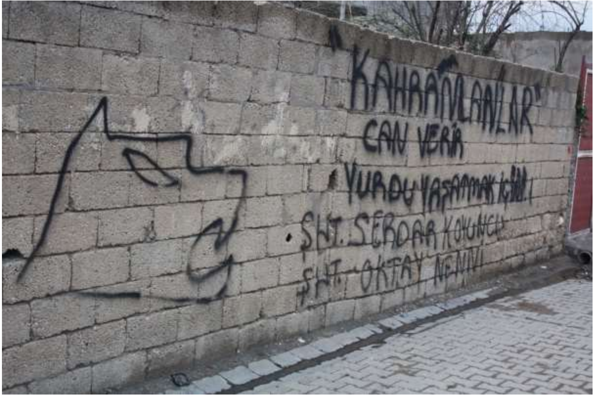
Foto 11. Bir duvar yazısı