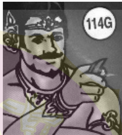
Gambar 6. Aspek tanda gestur seksual yang dikaitkandengan aspek seksual pada tokoh Bima pada kemasan produk jamu.

Apabila mengacu pada sikap budaya di atas maka pemaknaan terhadap tipe tanda yang didasari religi dan ideologi yang berperan sebagai latar budaya menyatu membentuk tanda simbolik. Konvensi ini ketika sudah mulai dilupakan latar budayanya pada masyarakat modern maka intrepetasi tanda tersebut kembali melalui ikonositasi. Tanda gestur seksual dewasa ini lebih bertipe ikonik karena latar budaya Jawa yang mendukung makna simbolik tersebut semakin tidak dipahami.