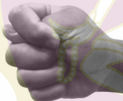
Gambar 1. Tanda Gestur Seksual, (Sumber: foto Samodro, 2010)

Tanda gestur seksual tangan sebagai sinyal merupakan gerak isyarat tangan atau gestikulasi yang ditentukan secara kultural merupakan simbol adalah konvensional (Zoest, 1993: 135). Oleh karena itu dalam melakukan interpretasi terhadap tanda tersebut, pengamat harus memahami latar budaya, yakni konvensi budaya masyarakat pendukung tanda tersebut.