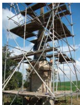
Mohyla u HJ v lešení