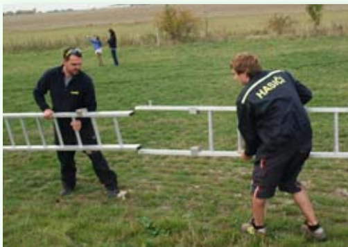
Hasiči po akci skládají žebřík