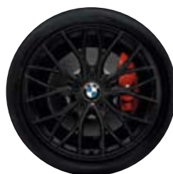
M Double-spoke Performance 405M, matně černá.

Palivová účinnost: E Přilnavost za mokra: C Vnější valivý hluk: 72 dB