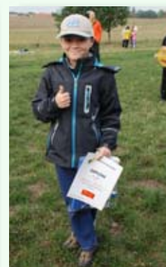
Jeden ze šťastných vítězů