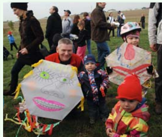
Vítězů jsme měli spoutu