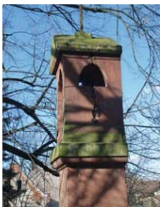
Zvonička před obnovou