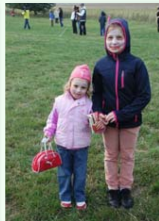
Malovalo se na obličej