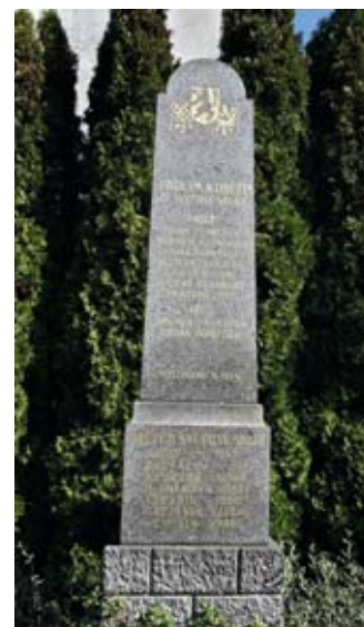
Pomník padlým v Osnici