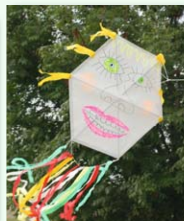
Tak příště ahoj