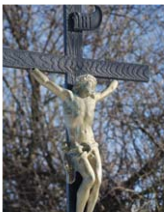
Křížek hřbitov Osnice