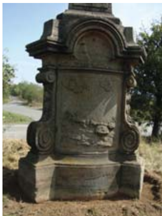
Spodek s reliefem