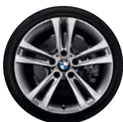
Double Spoke 397, ferricgrey.

Palivová účinnost: F Přilnavost za mokra: E Vnější valivý hluk: 72 dB