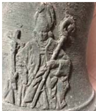
Zvon sv. Prokopa