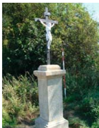
Obnovený křížek u Osnice