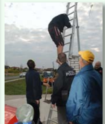
Hasiči vyprošťovali uvízlého draka ve spolupráci s městskou policií