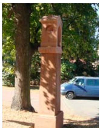
Zdiměřická zvonička nyní