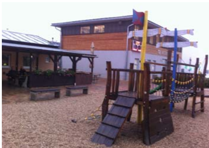
Text a foto: Soňa Vondráková

jímavými dřevinami. Parkem vede naučná stezka zaměřená na místní faunu a flóru. Od rybníka vede cyklotrasa směrem na Šeberov, kde se dovíte fakta o naší sluneční soustavě. Zajímavostí je, že vzdálenost jednotlivých planet od sebe je ve zmenšeném měřítku skutečnou vzdáleností planet naší soustavy. Nedaleko od Vesteckého rybníka je fotbalové hřiště s restaurací, kde se můžeme zahřát, odpočinout si a najíst se.