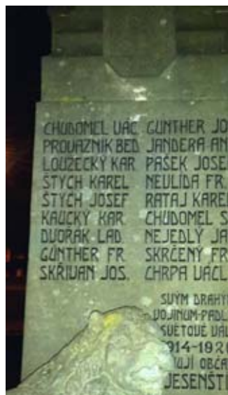
Pomník padlým v Jesenici