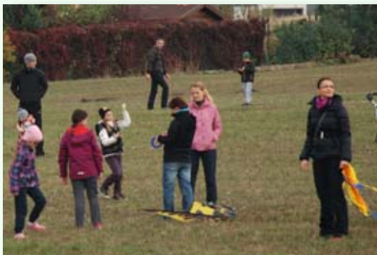
Draci se pouštěli na poli