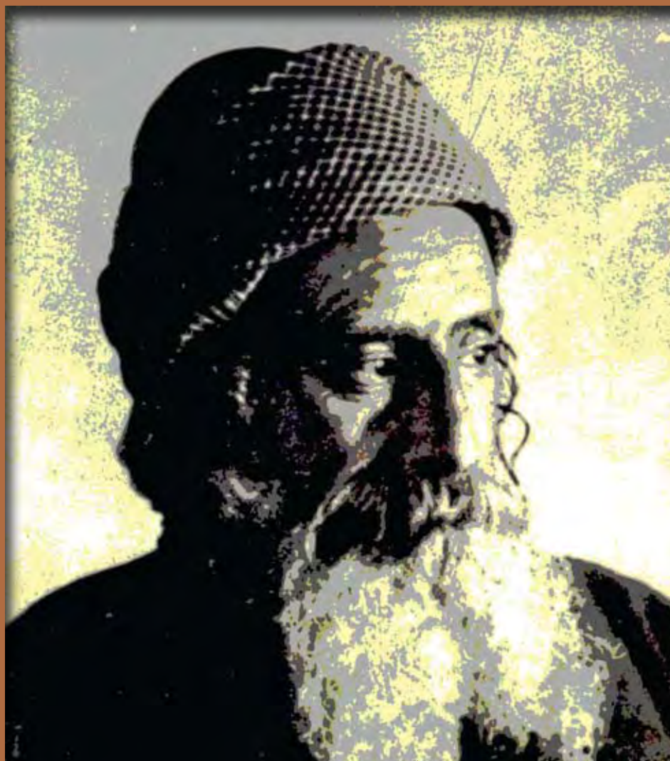
הרב יחיא יצחק הלוי