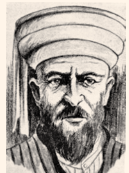
האימאם יחיא, שליט תימן בשנים 1918-1948