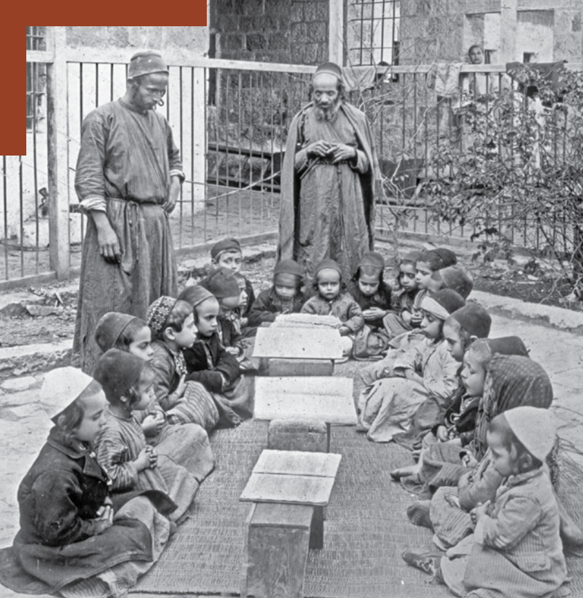
תינוקות של בית רבן

במקום כתב את תשובתו, מפני לחץ השואל שהוא רוצה לשוב לעירו.