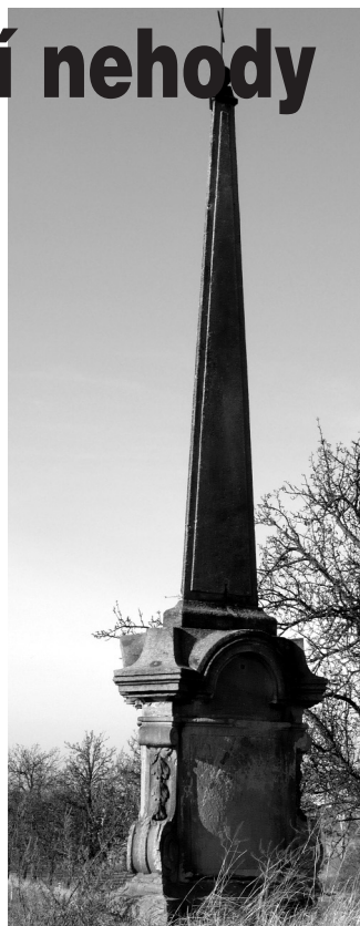
Pohled na pomník

Detail reliéfu v pískovcovém podstavci zobrazující tragickou událost, která se tu roku 1706 udála.