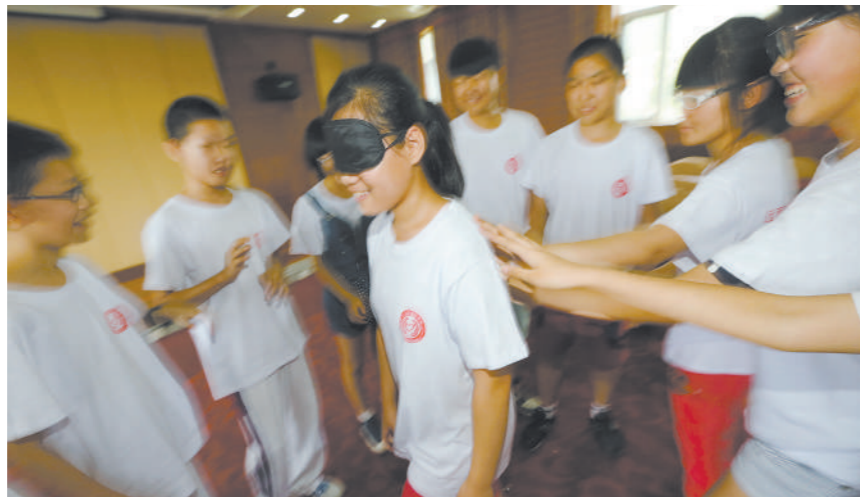
昨天,在昌平区小汤山,同学们在老师的带领下进行互动游戏,亲身体会在毒品和其它不良事物的诱惑面前自控力的重要性以及涉毒后遭到社会和家人排斥的无助。

当前,全市禁毒志愿者已达2.8万名,覆盖全市16个区县,人员构成包括学生、教师、学者、公务员、社区居民等各个群体,一张禁毒大网已在首都铺