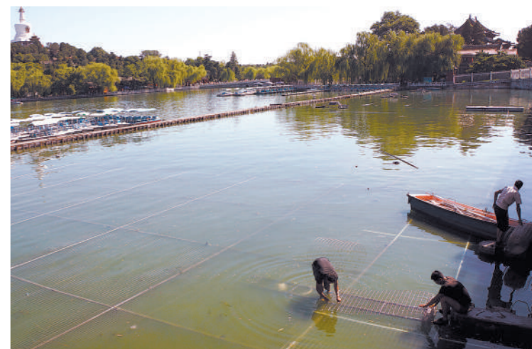
为解决北海大桥上总是有人违规钓鱼的“老大难”问题,近日北海公园在北海大桥北侧的公园所属水域铺设约两千平方米的水中网,昨天已基本完工。不锈钢网铺在水面以下,利用它阻止钓鱼。