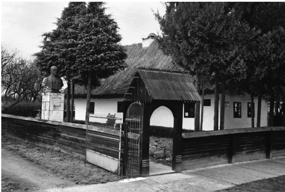
Casa memorială Vasile Lucaciu din Apa

După cum se știe, în 1814, după izbucnirea primului război mondial, Vasile Lucaciu, în fața unor iminente represalii, trece munții și începe să desfășoare o prodigioasă activitate națională, culturală și diplomatică în favoarea românilor ardeleni și a Unirii, activitate dusă atât în țară cât și în străinătate. Dar, odată războiul încheiat, Unirea înfăptuită, Vasile Lucaciu ia hotărârea de a se întoarce acasă, în Sătmar. Am să mă opresc asupra acestui moment, al revenirii lui Vasile Lucaciu acasă, în toamna anului 1919, fiindcă el este elocvent pentru adevărata dimensiune a personalității, pentru starea de spirit a sătmărenilor după unire, pentru