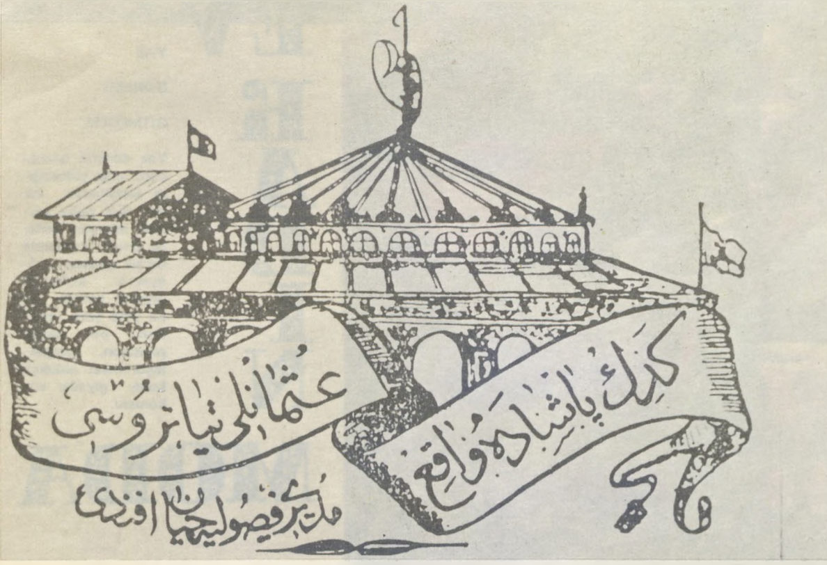
Gedik Paşa'da Güllü Yakup Efendi'nin kurduğu «Osmanlı Tiyatrosu».

da Ebuzziya Tefvik, Ahmet Mithat, Recaizade Ekrem, Şemseddin Sami'nin adlarını ilânlarda sık sık görmekteyiz.