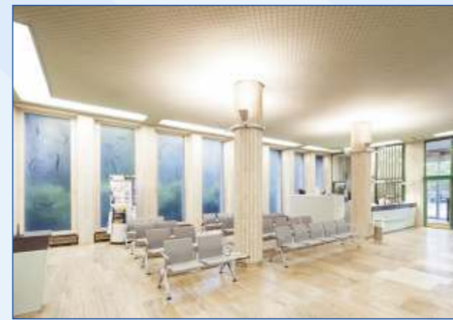
Blick in die Eingangshalle

Entworfen wurden die Fenster vom Halfmannshof-Künstler Eduard Bischoff. Wer genau hinschaut, erkennt unter anderem Figuren wie einen Kämmerer mit Schlüssel und Waage, eine Muse mit Harfe oder die Gesundheit.