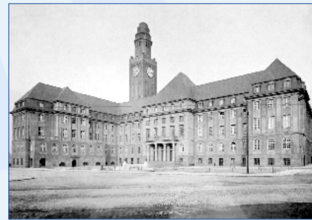
Das Rathaus kurz nach seiner Fertigstellung

Das Rathaus selbst besteht aus zwei unterschiedlich alten Gebäudebereichen: Einem Altbau, der 1910 bis 1912 gebaut wurde, und einem Erweiterungsbau, der in den 1950er Jahren entstanden ist.