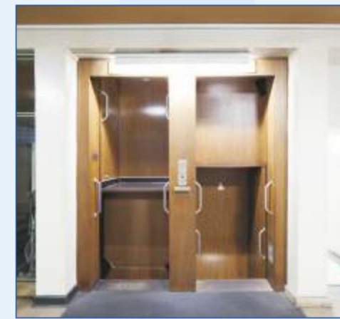
Paternoster im Obergeschoss

Etwas Besonderes ist der Paternoster vor allem, weil es von seiner Sorte nicht mehr sehr viele gibt. Seit Anfang der 1970er Jahre dürfen in Deutschland nämlich keine neuen Paternoster mehr gebaut werden. Die, die bereits vorher in Betrieb waren, dürfen zwar weiter laufen, müssen dazu aber ganz bestimmte Vorgaben erfüllen. Der Paternoster im Rathaus Buer ist seit 1988 als technisches Denkmal eingetragen und unter Denkmalschutz gestellt. Er ist in einem noch nahezu originalgetreuen Zustand wie 1954 - und bis heute voll einsatzfähig. Zu ganz besonderen Anlässen, wie etwa dem Tag des offenen Denkmals, wird der Aufzug auch wieder in Gang gesetzt.