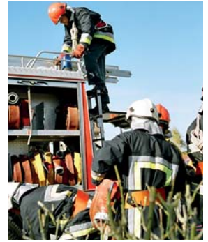
Die Feuerwehr Oberer Sempachersee bei einem Einsatz