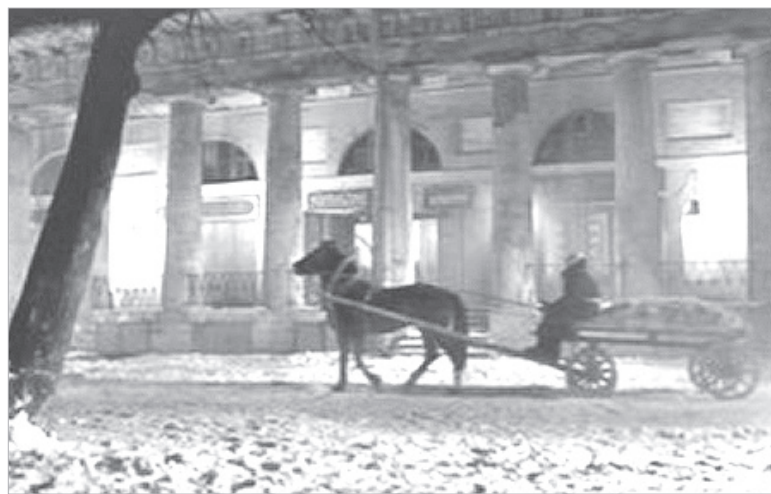
Кадры из фильма "Собачье сердце"

не сгружать сразу все бревна, так как по команде "На исходную!" им придется для следующего дубля поднимать бревно обратно на телегу. Полные энтузиазма "грузчики" меня не послушали, дважды разгрузили телегу полностью, на 5-7 дублях снимали по 3-4 бревна, и только когда счет дублей перевалил за десяток, стали беречь силы: снимали одно бревно, поднимали второе и удерживали его до команды "Стоп! Снято!" Какой из дублей попал в фильм, я не знаю.