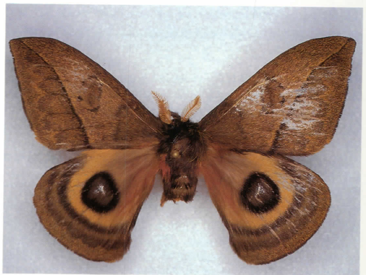
Fig. 1. Automeris iguaquensis Lemaire et Amarillo, n. sp. ♂ holotype (71mm).

MALE (Fig. 1).— Tête : brun noir, palpes labiaux brun noir; antennes quadripectinées jaune paille. Thorax : brun noir avec quelques écailles jaune terne sur les tegulae et roses à la base des ailes postérieures; pattes brun noir, tarsi roses, épiphyse mesurant environ les deux tiers de la longueur du tibia; un épéron médian, en plus de la paire apicale, sur le tibia des pattes postérieures; tarsi dépourvus d'épines. Aile antérieure : brun noirâtre avec un léger semis d'écailles jaune terne principalement sur l'aire médiane; ornementation habituelle des Automeris , rayures brun noir, l'interne un peu anguleuse, l'externe très légèrement préapicale, un peu concave, finement liserée de jaune proximale; tache discocellu-