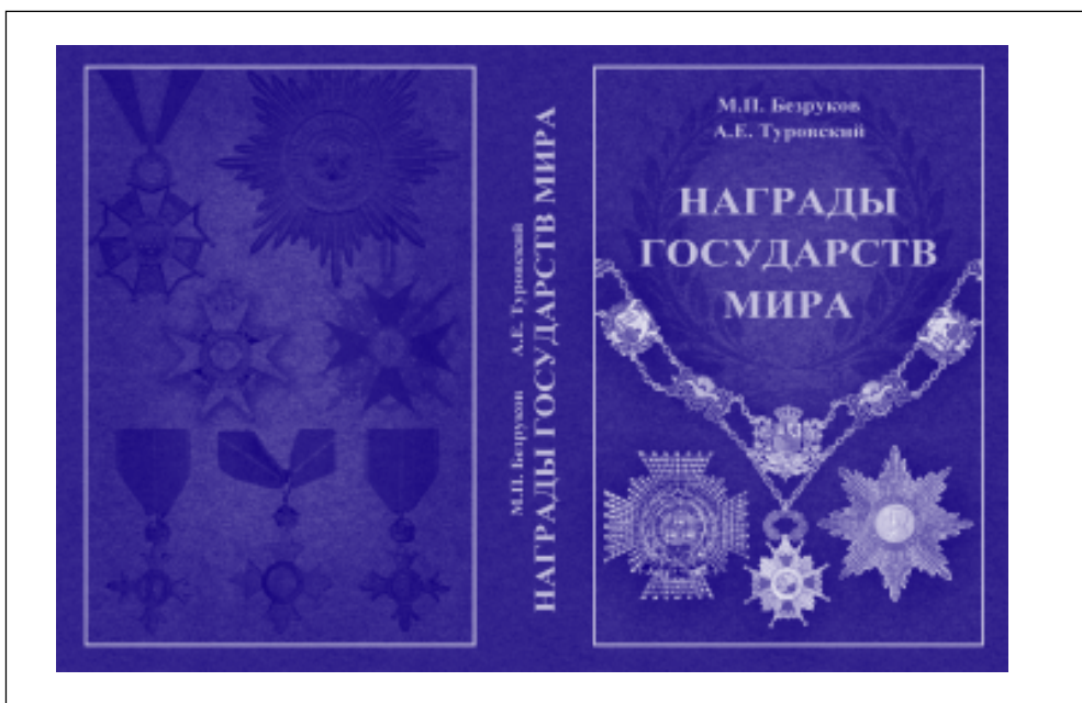
Рис. 2. Обложка издания «Награды государств мира»

Наградная система государства, наряду с флагом и гербом, является символом его суверенитета. С другой стороны, фалеристика вместе с вексиллологией и геральдикой всегда привлекала внимание специалистов и широкого круга читателей, активно интересующихся историей, символикой и смежными с ними научными изысканиями.