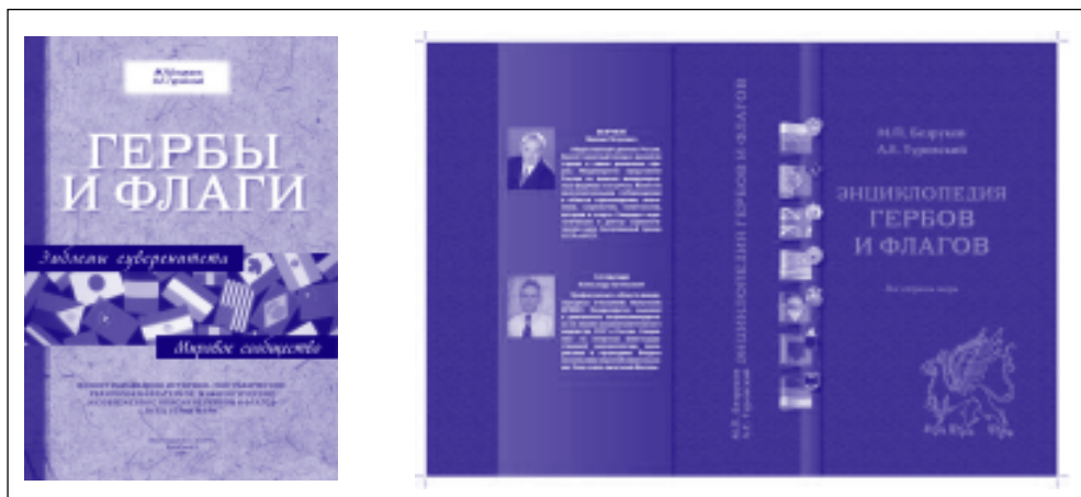
Рис. 1. Обложки 2-го и 3-го изданий «Энциклопедии гербов и флагов»

ющие малоизвестные ранее либо совсем незнакомые страницы истории. Вот авторы и начали с базовых вещей, дающих почувствовать принадлежность к великой стране, – символов государственности.