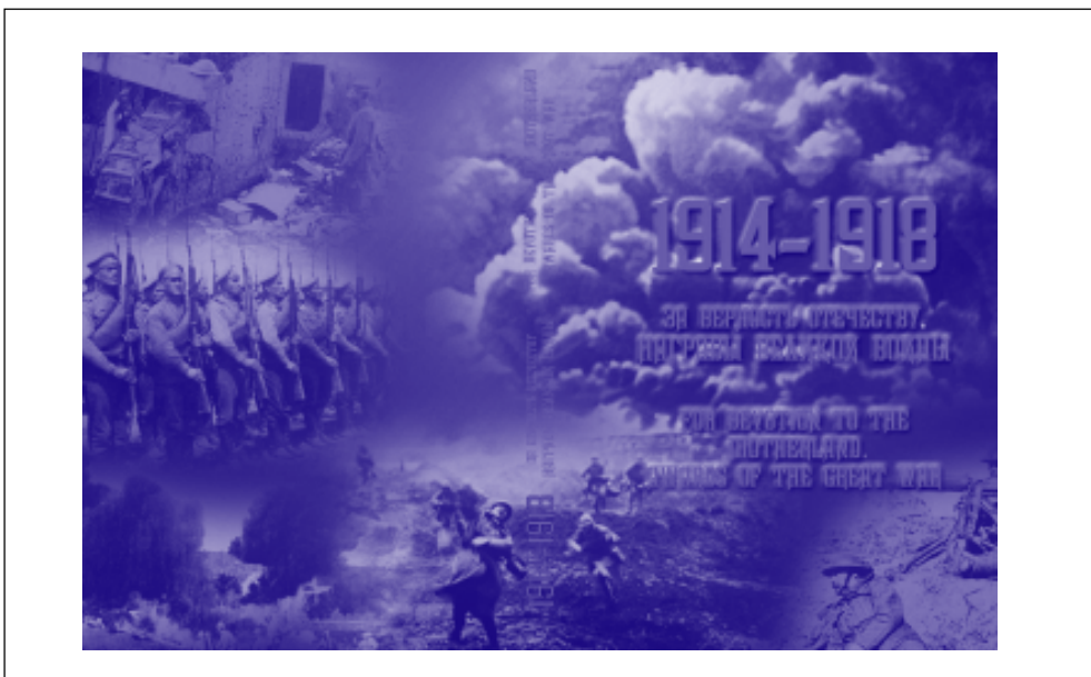
Рис. 5. Обложка издания «1914–1918. За верность Отечеству. Награды Великой войны»

вославному, породило вековые традиции русского воинства: «любой ценой выполнить», «ни шагу назад», «русские не сдаются», «велика Россия, а отступать некуда» и многие-многие другие, пронизанные душевной любовью к Родине, однажды кем-то из доблестных её сынов и дочерей произнесённые сердцем слова стали законами умения воевать.