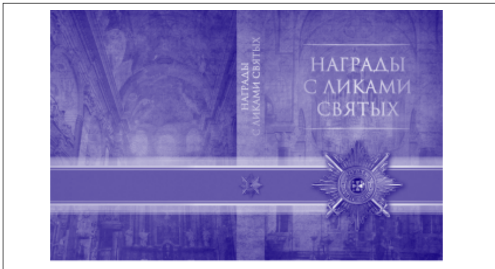
Рис. 4. Обложка издания «Награды с ликами святых»

Т ема, широко развёрнутая в «Покровителях», находит своё логическое, естественное продолжение в новой, уникальной в общемировом масштабе работе – « Награды с ликами святых » (2014 г.) [5], издания с рассказом о церковных орденах и медалях (рис. 4).