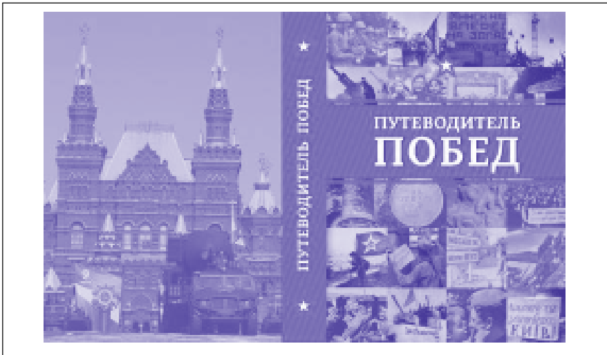
Рис. 6. Обложка издания «Путеводитель Побед»

В канун 70-летия триумфального завершения Великой Отечественной войны вышла в свет книга « Путеводитель Побед » [7] с предисловием статс-секретаря, заместителя министра иностранных дел России Г.Б.Карасина (рис. 6). В ней рас-