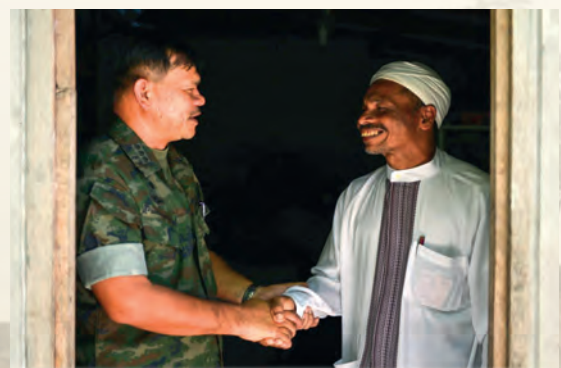
มือประสานมือ เปิดใจ รอยยิ้มแห่งมิตรภาพที่ดี

นาวาเอก สมเกียรติ ผลประยูร ได้รับการยกย่องให้เป็นบุคคลดีเด่นของกองทัพเรือ