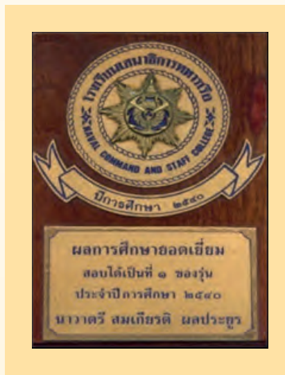
โล่ผลการศึกษายอดเยี่ยม หลักสูตรเสนาธิการทหารเรือ

หลักสูตรเสนา ธิการทหารเรือ ผลการ ศึกษาได้รับโล่ผลการ ศึกษายอดเยี่ยม สอบได้ เป็นลำดับที่ ๑ ของรุ่น