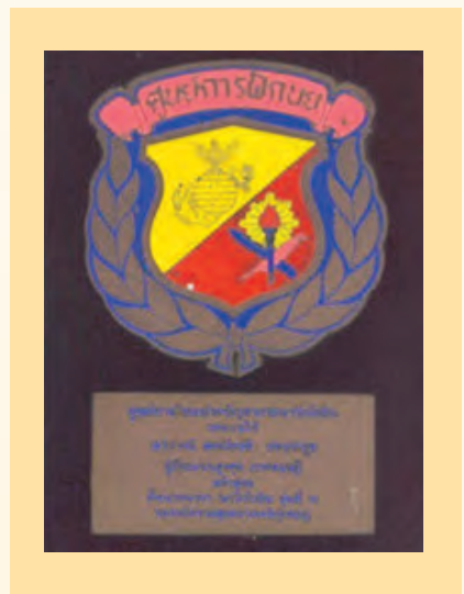
โล่ผู้มีคะแนนสูงสุดภาคทฤษฎี หลักสูตรชั้นนายนาวิกโยธิน