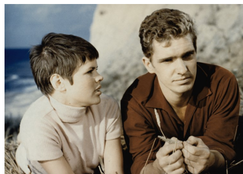
HEISSER SOMMER (Joachim Hasler, 1967)