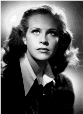
Hildegard Knef in DIE MÖRDER SIND UNTER UNS (1946)