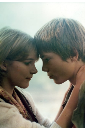
INSEL DER SCHWÄNE (1982)