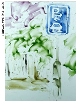
FILMSTILL AUS FRANKFURTER STR. 99a (Evgenia Gostrer, 2015)