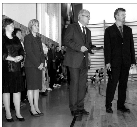
Starosta města Kožlany a ředitel školy při úvodním projevu.

Protože budova původní školy již nevyhovovala, bylo snahou našich předků vybudovat novou prostornější a modernější školní budovu. V roce 1911 žádá městské zastupitelstvo a místní školní rada o výstavbu nové školní budovy a vykupuje na výstavbu řadu stavebních parcel. Stavba je zadána ofertním řízením staviteli Františku Eliáškoví z Nového Strašecí za celkovou částku 130.000,- rakouských korun. Slavnostní položení základního kamene se uskutečnilo 6. června 1912 za přítomnosti c. k. okresního hejtmána Emiliána Schlindenbucha. Po pře-