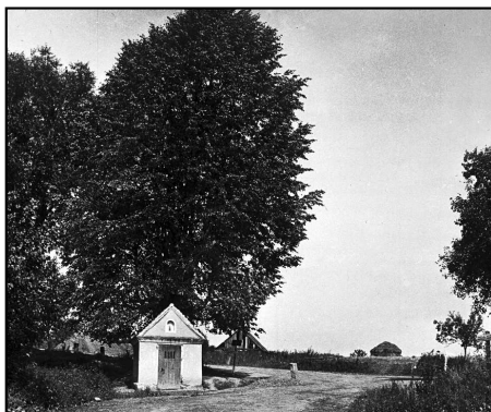
Černovice, kaple u rozcestí do Luhova a Pernarce v r. 1926, fond ZČM.