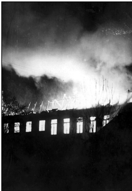
Objekt továrny v Manětíně, vpravo během ničivého požáru v roce 1969 (fota převzatá z publikace 100 let Sokola Manětín 1896–1996).