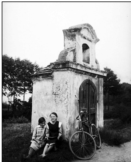
Kozolupy. Stará kaplička u Mže v roce 1915.

bleskem a sloužila také jako orientační bod pro letadla.