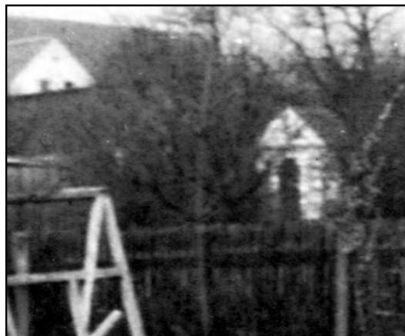
Líšňany. Kaple u cesty ke kostelu (detail z fotografie z obecní kroniky).