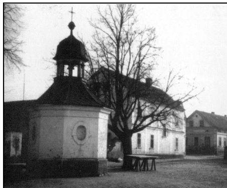
Dolany, kaple (z publikace Stříbrsko na starých pohlednicích).