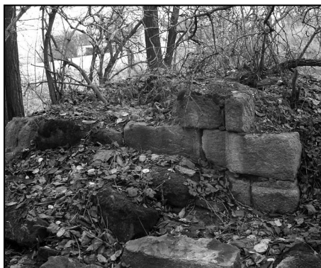
Bdeněves, kaple u železniční trati v roce 2012.

Tato dosud v terénu ještě patrná kaple se nachází 800 metrů jihozápadně od obce Bdeněves u železniční trati Plzeň - Cheb. Podle informace kronikářky obce Věry Klírové ještě po 2. světové válce kaple stála, někdy kolem roku 1983 ještě měla střechu, ale následovalo postupné chátrání a definitivně zanikla v 90. letech 20. století. Při stavbě železničního koridoru pak byl zrušen i železniční přejezd s cestou, která kolem ní vedla. Zasněžení kaple ani okolnosti jejího vzniku nejsou známy.