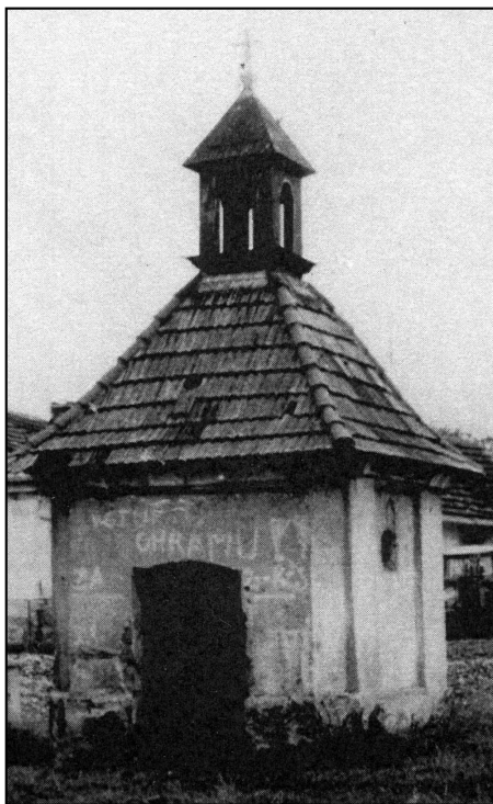
Myslínka. Kaple před zbořením v roce 1978 (zdroj z obecní kroniky).