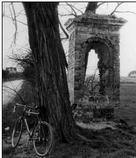
Rájov - Pňovany. Kaple v roce 1977.

tek. Na bocích byla malá kruhová okna, střecha byla krytá taškami, vížka byla hranolová (čtyřboká) a na