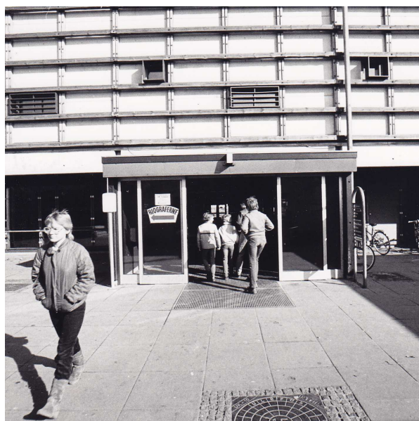
Albertslundhusets agora. 1970'erne og indgangsparti 1984