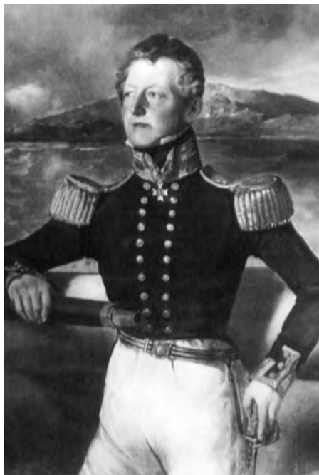
Английский адмирал Д.-П. Прайс в 1837 г. ещё в чине капитана.

пов, в том числе четыре офицера; в плен взято 4, из них трое тяжело раненных; принимая же в расчет, что утоплен неприятельский катер, в котором было от 40 до 50 человек, и что один барказ, наполненный мертвыми и ранеными, шел только на 8 веслах и потерял не менее как человек 80, что с других гребных судов многие убиты и ранены и что, наконец, на неприятельских судах также не обошлось без потери в людях, можно заключить без преувеличения, что потеря неприятеля в сражении 24 числа не менее 300 человек, а всего во время нападения на Петропавловский порт до 350 человек. Взято английское знамя, 7 офицерских сабель и 56 ружей.