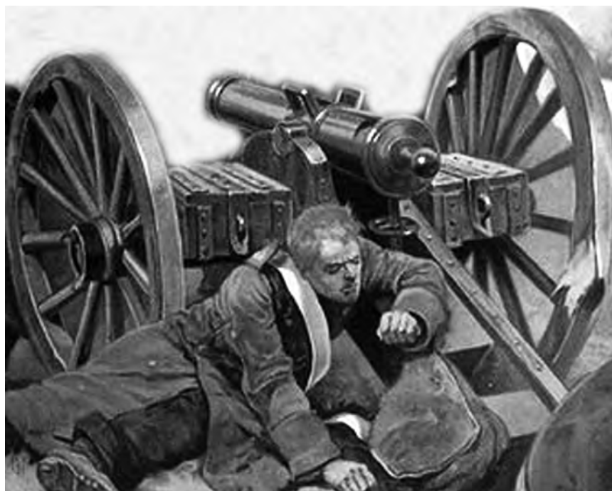
У полевой пушки