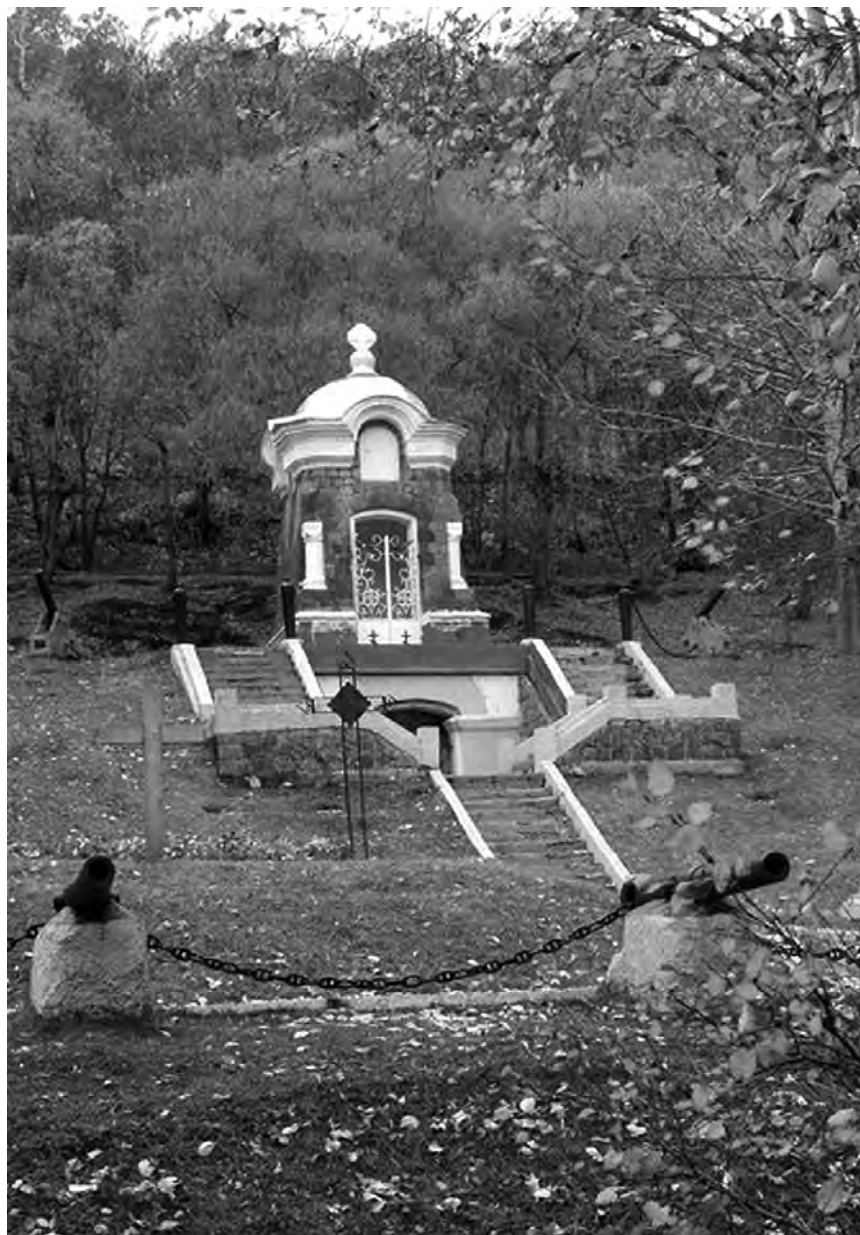
Памятник «Часовня» в Петропавловске-Камчатском