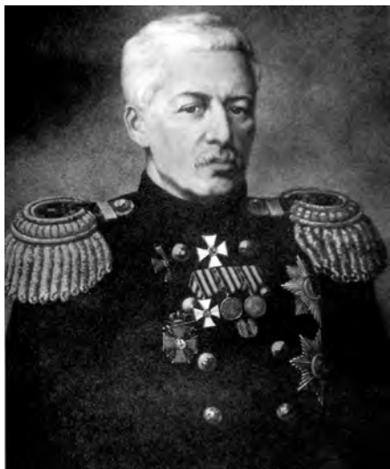
В. С. Завойко