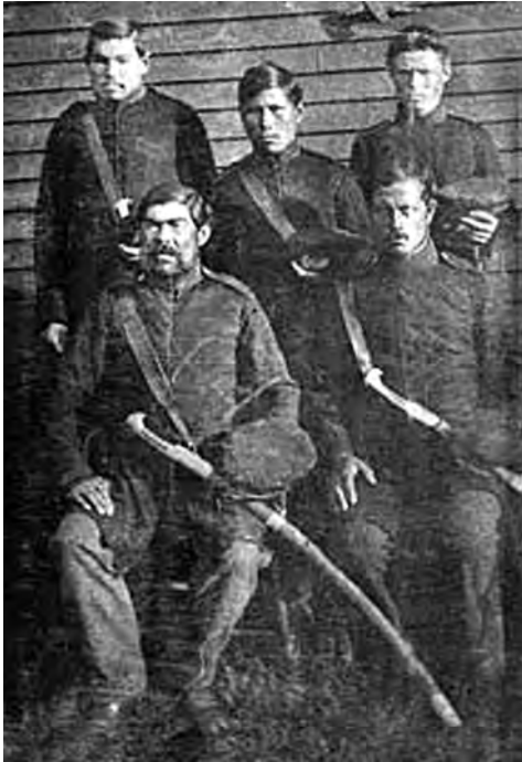
Казаки Петропавловска в 1870 г.