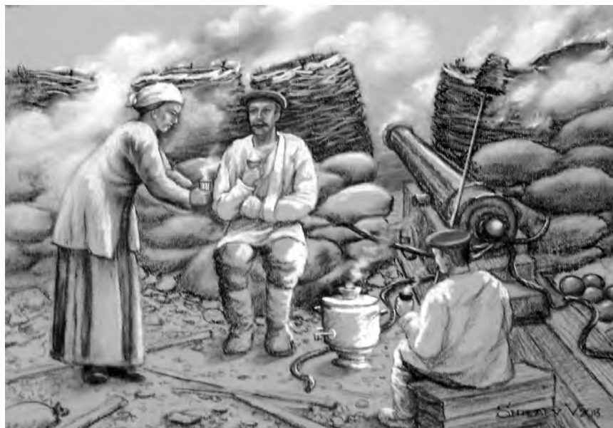
Забота женщин на Кошечной батарее. Худ. В. И. Шилев

накануне пятидесятилетия Петропавловской обороны, в список ветеранов, которым была установлена пожизненная пенсия, и вошла в легенду об обороне Петропавловска.