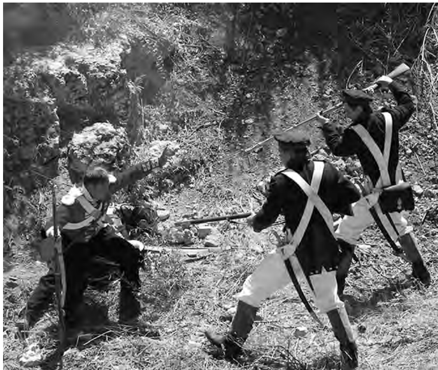
Фрагмент боя на Никольской сопке. Современная реставрация

ню; 31 человек под командой мичмана Фесуна правее гребня. С батареи № 2 посланы были 22 человека под начальством гардемарина Давыдова, который повел их на гору между двумя отделениями 3 стрелкового отряда.