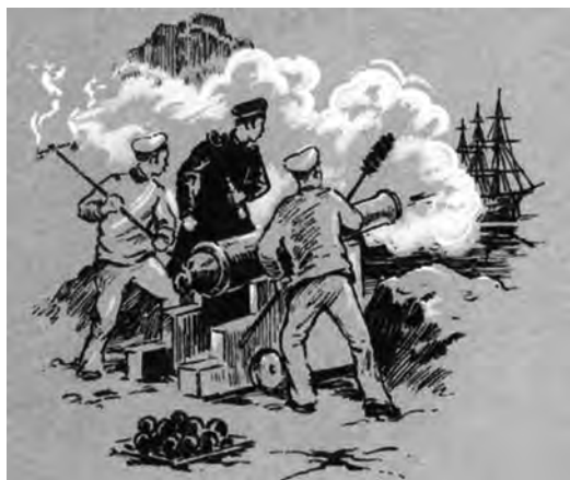
Рис. из книги М. А. Сергеева «Оборона Петропавловска на Камчатке», М., 1954

орудий повреждены бруки и станки и что на платформу навалило ядрами камня и землю так, что действовать орудиями невозможно. Удостоверясь лично в справедливости донесения, я приказал заклепать орудия, взять остальные картузы и отправить на батарею № 2; офицерам с командою вместе с первой партией стрелков идти к батарее № 4, ибо в это время от фрегатов отвалили 13 гребных судов и два десантные бота с десантом не менее 600 человек и направились к мысу южнее сей батареи. С фрегата “Аврора” сделали по ним несколько выстрелов, но ядра не достигали. В то же время отдано приказание поднять крепостной гюйс на батарее № 2 и, когда он будет поднят, то крепостной флаг с Сигнального мыса перенести в город, что и было исполнено в точности. Мера сия была необходима, ибо когда батарея замолчала и команда с нее была свезена, то флаг оставался без защиты. Вместе с тем сделано распоряжение, чтобы батарейные командиры батарей № 3, 6 и 7, не участвовавшие в то время в деле, оставив у пушек по два