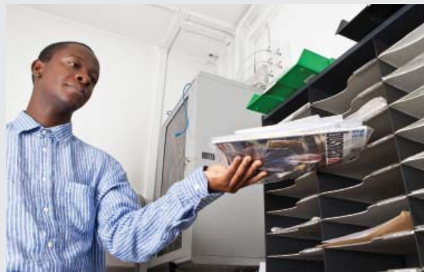
Tri du courrier à Glasgow, Ecosse, dans le cadre de l'initiative Prospects.

Une étude pilote de deux ans, dans le cadre de l'initiative « Prospects » 83 , a permis de comparer les résultats en terme d'emploi entre deux groupes de personnes avec autisme : le premier groupe avait reçu un soutien spécifiquement conçu pour répondre aux besoins des adultes avec autisme dans le cadre de l'initiative Prospects, tandis que le second groupe avait bénéficié d'un programme de soutien général pour personnes handicapées.