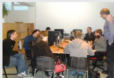
Specialisterne en Islande offre une formation professionnelle aux adultes avec autisme pour les aider à trouver un emploi.