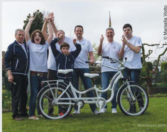
L'équipe Godega4Autism avec l'un de ses « hug bikes »

Depuis janvier 2014, deux adultes avec autisme y exercent un emploi. L'un d'eux requiert un haut degré de soutien. Les employés sont encadrés par un superviseur et un éducateur ABA. Dès lors, l'éducation continue et le développement de compétences font partie intégrante de leur travail.