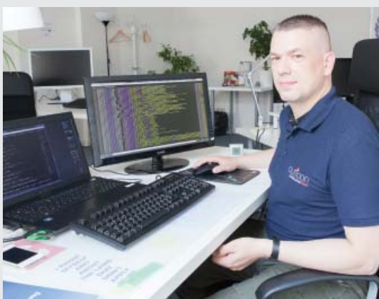
Consultant Auticon au travail.

Une entreprise allemande spécialisée dans le domaine informatique aide des adultes avec autisme à se prendre en charge et à mener une vie plus indépendante grâce à l'emploi.