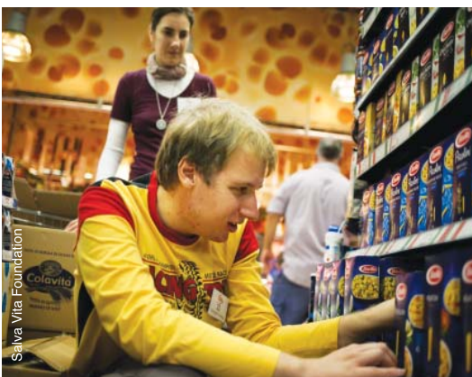
Réapprovisionnement des rayons en Hongrie.