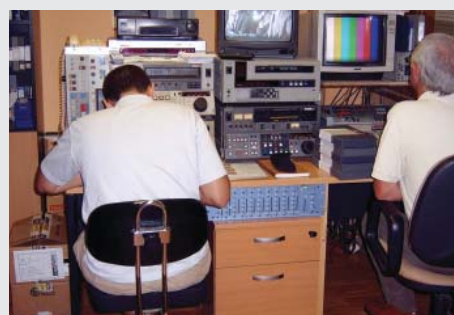
Assistants techniques archivant des bandes vidéo.

Le programme – le premier du genre dans le sud de l'Espagne – a été lancé en 2006. Depuis lors, il a permis d'aider 120 personnes avec autisme, âgées de 17 à 50 ans, et pour la plupart ayant un bas niveau de formation, à trouver un emploi. Le programme a contribué à la création d'une