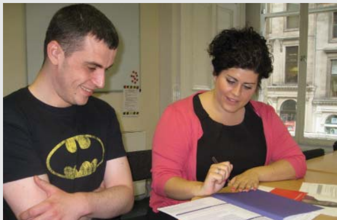
Coopération au sein du Service de consultation et de formation pour l'emploi de la National Autistic Society.

Etant donné le nombre de personnes concernées par ce secteur en expansion, la National Autistic Society a développé une méthode pour aider les employeurs, les intermédiaires et les organismes de soutien aux personnes avec autisme à développer avec ces dernières des relations professionnelles constructives.