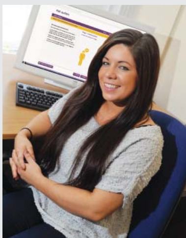
La formation en ligne "Ask" de la National Autistic Society est dispensée par des personnes avec autisme.avec autisme.

Ask Autism est un service de formation de la National Autistic Society pour le développement professionnel. Conçu et donné par des personnes avec autisme elles-mêmes, Ask Autism permet aux professionnels et autres acteurs concernés de découvrir l'autisme « de l'intérieur » et la manière dont les personnes avec autisme souhaiteraient être comprises et soutenues.