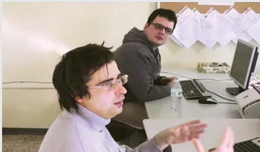
Des membres du personnel de la coopérative discutent de leur travail.

En Italie, un groupe d'adultes avec autisme qui ne parvenaient pas à trouver un travail satisfaisant et adapté sur le marché libre du travail ont créé une coopérative au sein de laquelle ils collaborent.