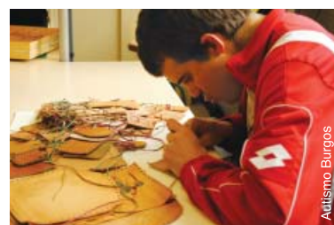
Fabrication d'accessoires en cuir en Espagne.