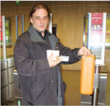
Des employés de Passwerk en déplacement, testant des portillons d'accès dans les stations de métro.

L'entreprise belge Passwerk emploie une quarantaine de personnes avec autisme pour effectuer des tests de logiciels et participer à des projets de tests de qualité, à la fois dans les bureaux de l'entreprise et sur les lieux des différents projets.