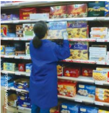
Réapprovisionnement et rangement des rayons dans un supermarché en Espagne.