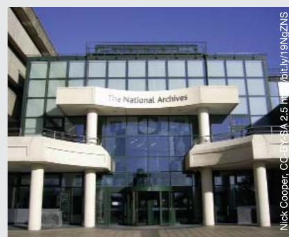
The National Archives building in London, United Kingdom.

En savoir plus : www.autism.org.uk/employmentservices