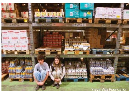
En formation professionnelle dans un entrepôt en Hongrie.

L'éducation est un facteur clé pour accéder à l'emploi. Comme nous l'avons déjà indiqué dans ce présent rapport, les enfants et les adultes avec autisme sont encore trop souvent exclus des systèmes éducatifs. Il est dès lors indispensable que les gouvernements adoptent des politiques et des stratégies nationales qui assurent l'accès à l'éducation tout au long de la vie, depuis les structures d'accueil pour enfants en âge préscolaire jusqu'à l'éducation supérieure, y compris la formation professionnelle. Il faut également offrir aux personnes avec autisme des formations qui permettent de préserver et d'améliorer les capacités acquises dans les domaines de la communication, des interactions sociales et personnelles afin de compenser leurs difficultés dans ces domaines.