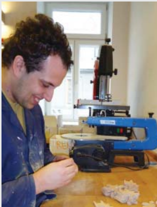
Travail du bois chez Rainman's Home.

Le premier module (« de base ») porte sur les aptitudes de base à communiquer et sur les aptitudes à la vie quotidienne, comme la cuisine.