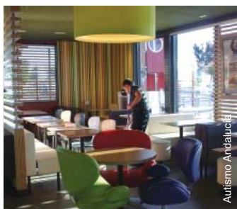
Travail de nettoyage dans un McDonalds en Espagne.

rôle de manière adéquate et qui définit les structures de soutien au sein de son environnement de travail. Dès que la personne avec autisme possède les compétences requises pour exercer son rôle de manière indépendante, l'aide du mentor professionnel se réduit à des consultations périodiques ou à un soutien par téléphone pour veiller à ce que la personne avec autisme puisse maintenir son emploi. Cette approche vise à rendre la personne la plus autonome possible dans le cadre de sa fonction, l'assistance sera réduite au minimum, mais ne sera cependant jamais complètement enlevée. Cette approche s'applique pour les personnes avec autisme qui sont capables de travailler en milieu de travail ordinaire avec une assistance limitée.