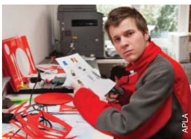
Développement de compétences en République tchèque.

Le terme 'ateliers protégés' fait communément référence à une organisation ou à un environnement qui emploie des personnes handicapées séparément des autres. 85 Ces ateliers s'adressent en général à des personnes handicapées qui exercent un métier manuel. Ils peuvent avoir plusieurs formes, comme des centres d'accueil de jour où les personnes handicapées participent à des programmes d'ergothérapie axés sur la production de biens et de services à des fins non lucratives, ou des centres où les personnes handicapées exercent des activités pour lesquelles elles reçoivent un revenu.