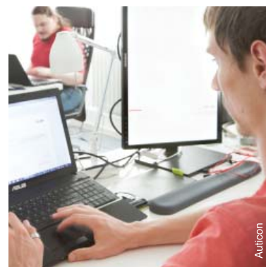
Consultants informatiques en Allemagne.

L'insertion professionnelle des personnes avec autisme dans le monde du travail ordinaire nécessite souvent la mise en place de diverses formes de soutien, comme cela a été évo-