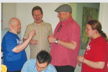
Bénévoles travaillant pour le magazine en ligne Puoltaja.

Puoltaja est un magazine en ligne créé en Finlande par des bénévoles avec autisme, pour la plupart atteints du syndrome d'Asperger.