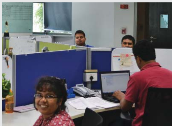
Des salariés avec autisme de SAP en Inde reçoivent un soutien individuel

Aujourd'hui, l'organisation opère dans une douzaine de pays et a déjà permis à plusieurs centaines de personnes avec autisme de décrocher un emploi, la majorité d'entre elles travaillant pour Specialisterne même.