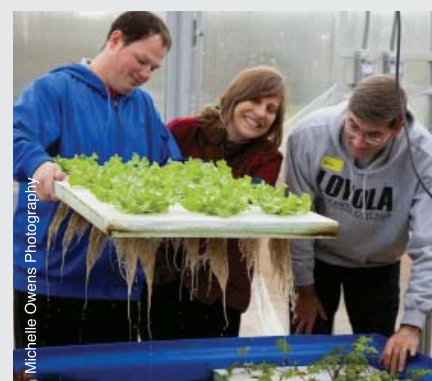
L'aquaponie est une méthode de culture où poissons et plantes croissent en symbiose.

En savoir plus : www.greenbridgegrowers.org