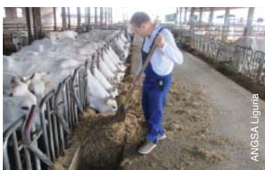
Soigner le bétail dans une ferme en Italie.