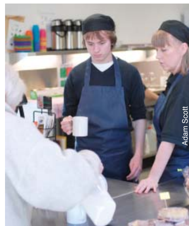
Travailler dans de petites équipes pour éviter le stress en France.