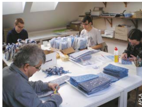
Emballer des cadeaux en République tchèque.