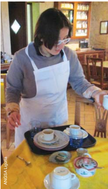
Travail dans une cantine en Italie.

L'autisme est un trouble du développement permanent qui affecte la façon dont une personne communique et interagit avec les autres. Ce trouble affecte également la manière dont elles perçoivent le monde qui les entoure. L'autisme couvre un spectre de troubles, ce qui signifie que même si toutes les personnes avec autisme partagent certaines difficultés, leurs troubles les affecteront de manière différente. Certaines personnes sont capables de vivre en relative autonomie alors que d'autres peuvent avoir des troubles d'apprentissage assortis et requérir une assistance spécialisée durant toute leur existence.