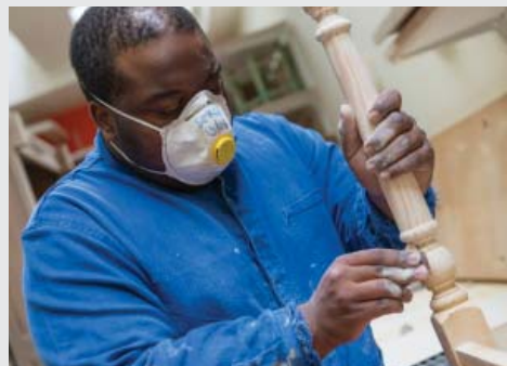
Restauration de meubles à l'ESAT les Colombages.