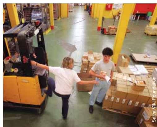
Travail dans un entrepôt en Hongrie.

Lorsque des possibilités d'avancement de carrière se présentent, les personnes avec autisme auront sans doute besoin d'encouragement et d'un soutien supplémentaire. Il peut s'agir d'un soutien dans le cadre des discussions et des négociations relatives à leur nouveau rôle et à leurs nouvelles responsabilités, ou d'adaptation raisonnable pour répondre à leurs besoins au cours de la transition vers leur nouvelle fonction. De par la nature même de l'autisme, de nombreuses personnes avec autisme préfèrent éviter les changements de routine et/ou de leur environnement physique, susceptibles de provoquer un stress extrême. Tout en respectant cet aspect, il ne faudrait toutefois pas éviter les possibilités d'avancement de carrière sur cette base. Il faudrait plutôt veiller à assurer un soutien adéquat au cours du processus d'avancement de carrière.