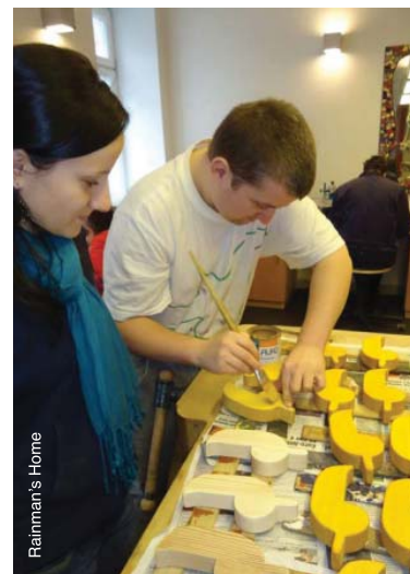
Développement de compétences en menuiserie avec une aide spécifique en Autriche.