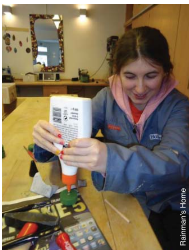
Développer des compétences en menuiserie en Autriche.

Les critiques formulées à l'encontre des ateliers protégés portent surtout sur la ségrégation et l'exploitation des personnes handicapées et sur la négation de leurs droits fondamentaux, comme ce fut le cas dans certains ateliers. On peut citer l'exemple des ateliers où les personnes handicapées exercent un métier qui est en dessous de leurs capacités, pour une paie inférieure au salaire minimum, à la faveur des organisations qui exploitent leur force de travail et qui leur offrent peu, sinon aucune possibilité pour développer les compétences nécessaires pour intégrer le marché de l'emploi ordinaire. 86 Les personnes avec autisme qui travaillent dans les ateliers protégés ont souvent vécu en institutions, et leur occupation dans les ateliers protégés n'émane pas toujours du libre choix de la personne ou des membres de la famille. 87 Clairement, ces pratiques ne peuvent, en aucun cas, être considérées comme acceptables.