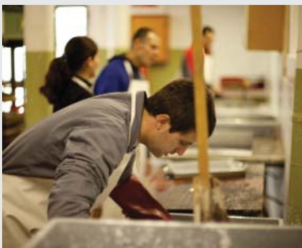
Recyclage de papier chez TERLAB.

Les adultes avec autisme requérant un haut niveau de soutien peuvent éprouver de grandes difficultés à trouver un emploi adéquat. TERLAB, un atelier protégé situé près de Barcelone, Espagne, leur offre la possibilité de prendre à part à des activités utiles dans le domaine de l'agriculture, du jardinage et du recyclage de papier.