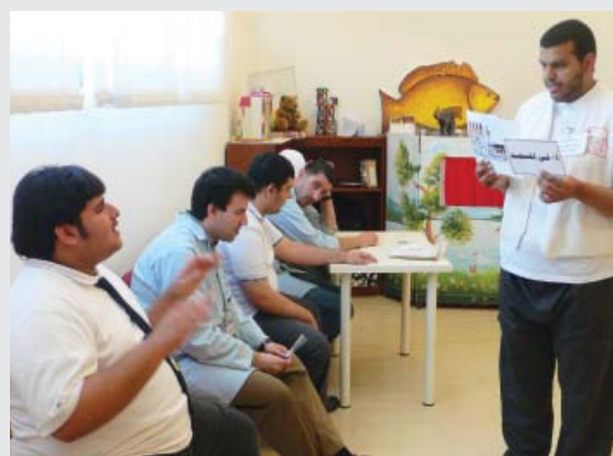
Un assistant d'éducation avec les étudiants.

Les quatre membres du personnel avec autisme travaillent comme bibliothécaires ou assistants de cours pour les étudiants avec autisme qui suivent une formation pour apprendre la géographie et les sciences sociales, développer leurs compétences professionnelles dans les domaines de la menuiserie ainsi que des aptitudes pour la vie quotidienne.