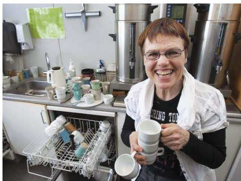
Préparer le café et assister les enseignants dans une école au Danemark.

Si les personnes avec autisme ont besoin d'aide pour accéder à l'emploi et se maintenir dans l'emploi, elles ont également besoin de compétences pour défendre leurs droits. Dans la mesure du possible, les personnes avec autisme devraient bénéficier d'une formation pour leur permettre de développer les compétences nécessaires pour défendre leurs droits et leurs besoins dans le contexte professionnel.