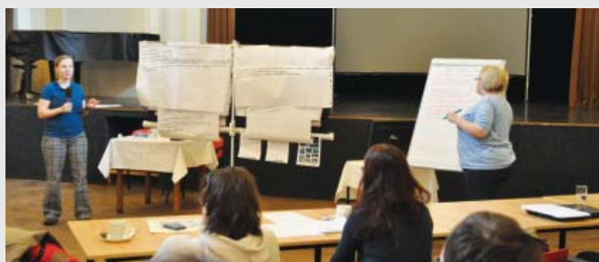
Réunion entre les parties prenantes dans le cadre du projet We Can Manage.

Le projet rassemble des organisations travaillant avec les personnes avec autisme et d'autres groupes comparables pour évaluer les approches de l'emploi dans différents pays.