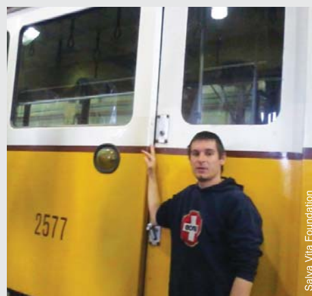
La Fondation Salva Vita a aidé un jeune homme passionné de trains et aimant le nettoyage à obtenir un emploi en tant que nettoyeur de trams.