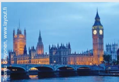
Le Parlement britannique a adopté l'Autisme Act en 2009, première loi spécifique au handicap en Angleterre.

Cette loi requérait que le gouvernement développe une stratégie afin de répondre aux besoins des adultes avec autisme, ainsi que des directives officielles à l'intention des autorités et des services locaux de soins de santé pour sa mise en œuvre. Dès lors, en 2010, la stratégie « Fulfilling and Rewarding Lives » (Stratégie pour des vies épanouies) a été créée pour garantir que les personnes avec autisme reçoivent le soutien nécessaire, de l'aide à domicile jusqu'à l'aide à l'emploi.