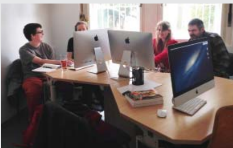
Les employés de PASPARTA ont réalisé la conception graphique de ce rapport.

Ce rapport a été mis en page par les employés avec autisme de la maison d'édition PASPARTA, une entreprise sociale fondée par l'organisation de l'autisme APLA Prague en République Tchèque. Cette entreprise vise à offrir des opportunités d'emploi aux personnes avec autisme dans un environnement adapté où ils peuvent mettre à profit leurs compétences uniques. PASPARTA publie des ouvrages sur l'éducation générale et spécialisée, la sociologie, le droit, etc.