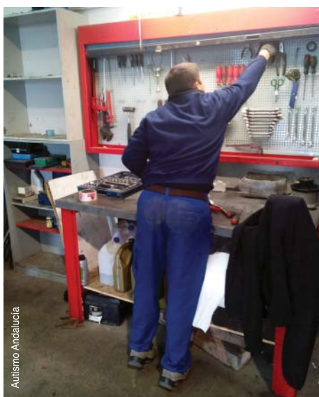
Assistant-mécanicien triant des outils en Espagne.