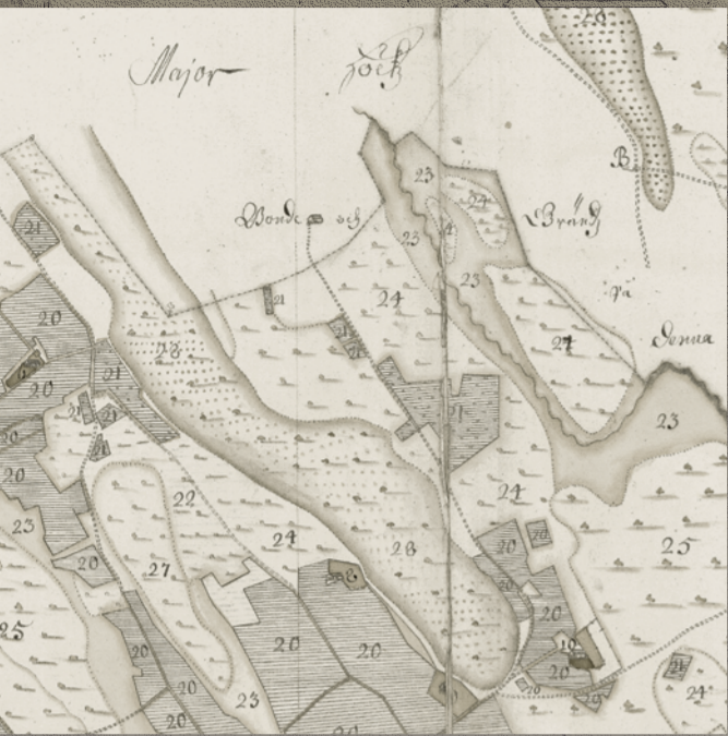
Valmieras muižas plāna fragments (1681)