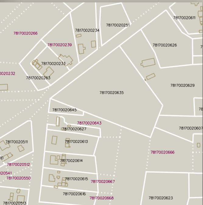
Digitālā kadastra karte (2008)