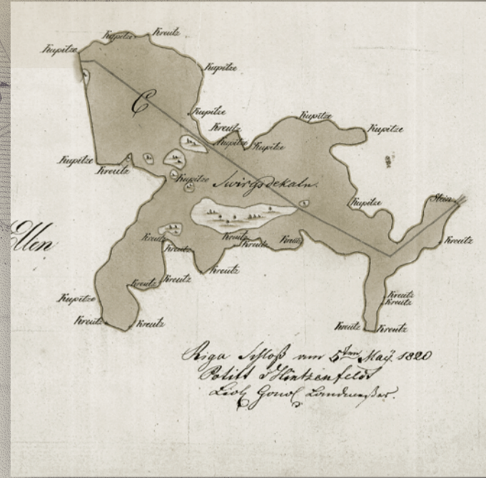
Ičkšiles muižas plāna fragments (1820)