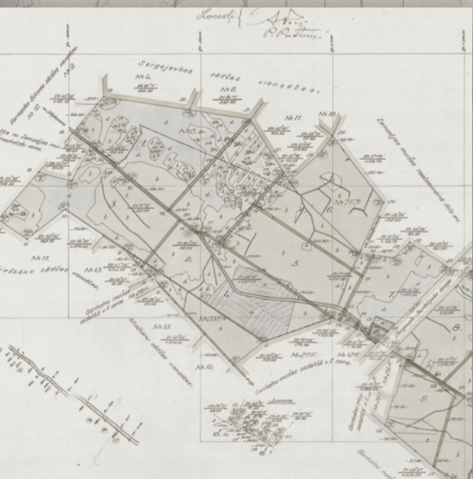
Zemnieku saimniecības plāns (1896)