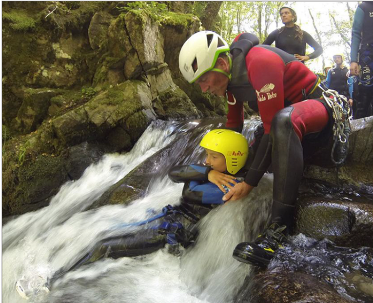
Le canyoning peut se pratiquer dès l'âge de 8 ans. Seule condition : savoir nager.