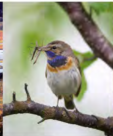
Blåhaken på väg med mat till boet. Lodjur med unge.