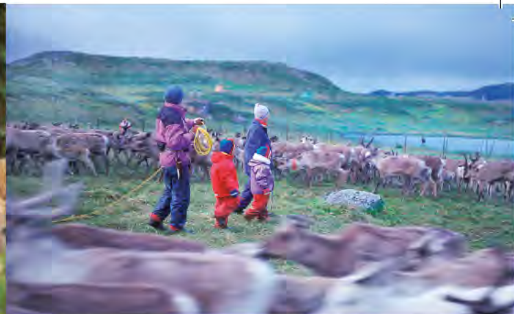
Renkalvmärkning i Gabna sameby.