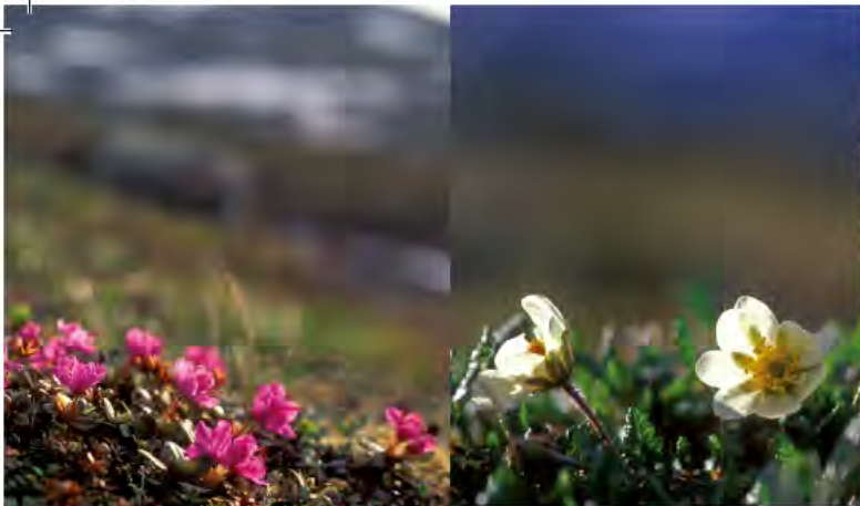
Lapsk alpros och fjällsippa växer där marken är kalkrik.