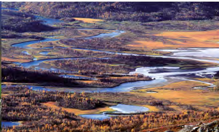
Njuoraeatnus deltaland i Vadvetjåkka nationalpark.