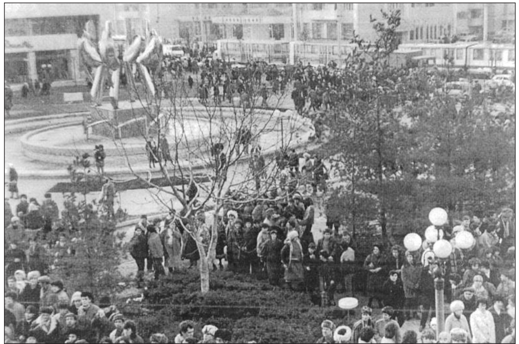
Brăila, decembrie 1989

În seara zilei de 22 decembrie, noul organism al puterii politice, va stabili o serie de măsuri organizatorice pentru consolidarea cuceririlor revoluționare. Paza Consiliului F.S.N., aflat în fostul Consiliu Popular Județean, va fi efectuată până pe data de 23 decembrie 1989, orele 13.00 de către revoluționari, după această dată paza preluând-o armata 12 . Practic, nota telefonică nr. 39 a M.Ap.N., semnată de generalul Victor Stănculescu, nu a fost pusă în practică la Brăila, decât după 24 de ore de la transmiterea ei. S-a mai hotărât preluarea sub control a sediilor organelor de represiune și tipărirea unui ziar al revoluției intitulat "Libertatea". De acest lucru m-am ocupat chiar eu, împreună cu alți revoluționari, ce ne-am deplasat la tipografia Brăilei. Se vor mai organiza sisteme de filtre și patrule în oraș și se va stabili o planificare de deplasare în comunele județului pentru schimbarea vechilor autorități și în aceste locuri. Am făcut parte din echipa ce va schimba conducerea în comuna Tudor Vladimirescu.