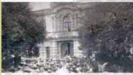
Obreros frente a la fábrica Textil

A principios de 1900 se instalaron las plantas hidroeléctricas y la primera industria de la región, esto fincó las bases para decretar, años después, al municipio de El Salto con vocación industrial, con la ilusión de que con ello se terminaría la pobreza. No hubo de otra, el pueblo se hizo obrero.