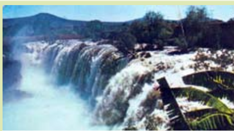
El Salto de Juanacatlán

La región tenía gran diversidad natural. Era un paraíso donde vivíamos de lo que nos ofrecía la tierra. Nuestro orgullo era El Salto de Juanacatlán; una cascada de 27 mts de altura por 167 mts de ancho. Sembrábamos maíz y hortalizas. Cuando no teníamos qué comer, el río y la barranca nos daban alimento: mangos, membrillos, guayaba, ciruela, sardinas, pescado blanco, boquinetes o burros, carpas, bagres, y un sinfín de aves y otras especies.