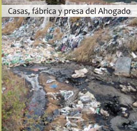
Lixiviados en el vertedero Los Laureles

Actualmente la región es uno de los lugares en México donde se concentran más problemas de contaminación. Esta contaminación, además de enfermar el ambiente nos está matando, física y moralmente. El empobrecimiento es peor; a pesar de poder contar con un trabajo, el dinero no alcanza para alimentarnos, pagar la renta y curarnos de las enfermedades que nos trae el entorno, las empresas, y el descontrol entre ellas, el gobierno y la población que vive y trabaja en esa orilla de Guadalajara, y que no sólo no fue tomada en cuenta sino que hoy se criminaliza cualquier acción suya de protesta, visibilidad y difusión propias de su defensa del territorio, la vida, la salud y la viabilidad de habitar en la región.