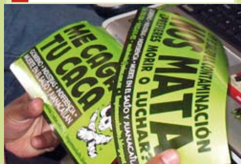
Campaña de calcomanías

Siguen aferrados a que les demos científicamente, con pruebas, que los perjuicios en nuestra salud, tienen que ver con la contaminación. Finalmente, nos percatamos, por la vía de los hechos, que el poder político está subordinado al poder económico.