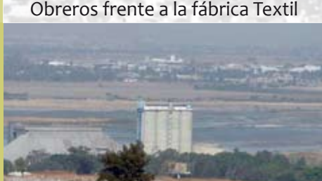
Casas, fábrica y presa del Ahogado

El decreto no estaba acompañado de planeación para instalar tantas fábricas peligrosas y el crecimiento descontrolado de los asentamientos. El sueño industrial hizo que no volviéramos a ver el río, estaba herido de muerte, así inició la pérdida de la relación con la naturaleza. La "abundancia de trabajo" atrajo a muchos nuevos pobladores de orígenes distintos y se diluyó la identidad original de los pueblos.