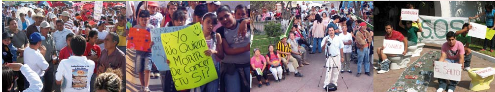
Manifestación contra el vertedero