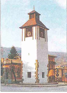
Prijepolje (Prepol) Saat Kulesi

landırılan Bosna'da yapılan idarî düzenlemeler sonucu buraya bağlanan yedi sancaktan birini Yenipazar sancağı oluşturdu. Buranın merkezi Sjenica olup Yenipazar, Sjenica, Taşlıca, Nova Varoş, Prijepolje, Akova (Bijelo Polje), Mitrovica, Berane, Kolašin ve Trgovište adlı on kazadan müteşekkildi (krş. Cevdet, III, 91-97; Şabanović, s. 233-234).