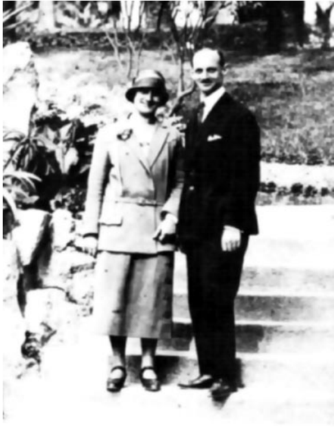
Эдит и Отто Франк. 1925 г.

Портрет Анны Франк... Перед нами — фотография антифашиста с прекрасным детским лицом. Нет, она не боролась в антифашистском сопротивлении. Но последними шагами своей пятнадцатилетней жизни она вошла в историю борьбы с нацизмом. Ее жизнь — это прекрасный, трагический акт сопротивления всемирному злу. Мы глядим на живую Анну Франк и видим свет далекой звезды, которая благодаря выставке засияла ярче. Ее «Дневник» — это реквием по миллионам евреев, погибших от рук фашистов.