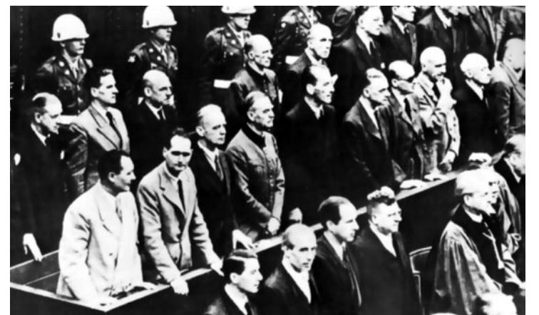
Возмездие свершилось. Международный трибунал в Нюрнберге 1946 г.