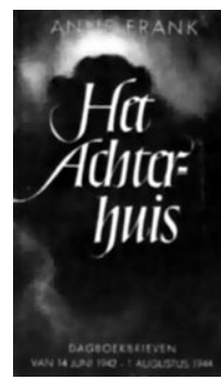
Голландское издание «Дневник Анны Франк»