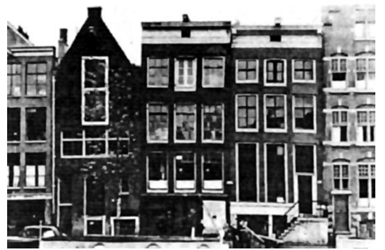
Дом где пряталась семья Франк