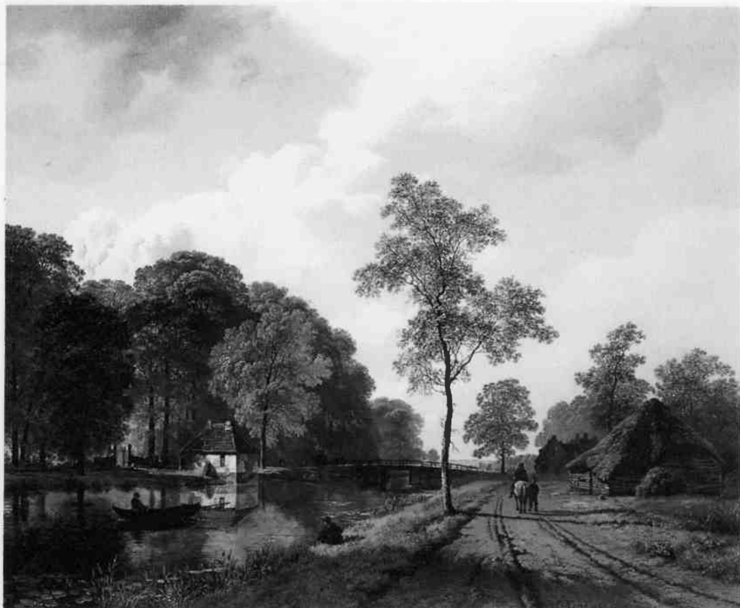
Barend Cornelis was het meest bekende lid van de schildersfamilie Koekoek. B.C. Koekoek, Zomerlandschap in de provincie Utrecht, 1830 of 1839 (coll. Simonis & Buunk).

het bezit in bruikleen gegeven aan het Rijksmuseum.