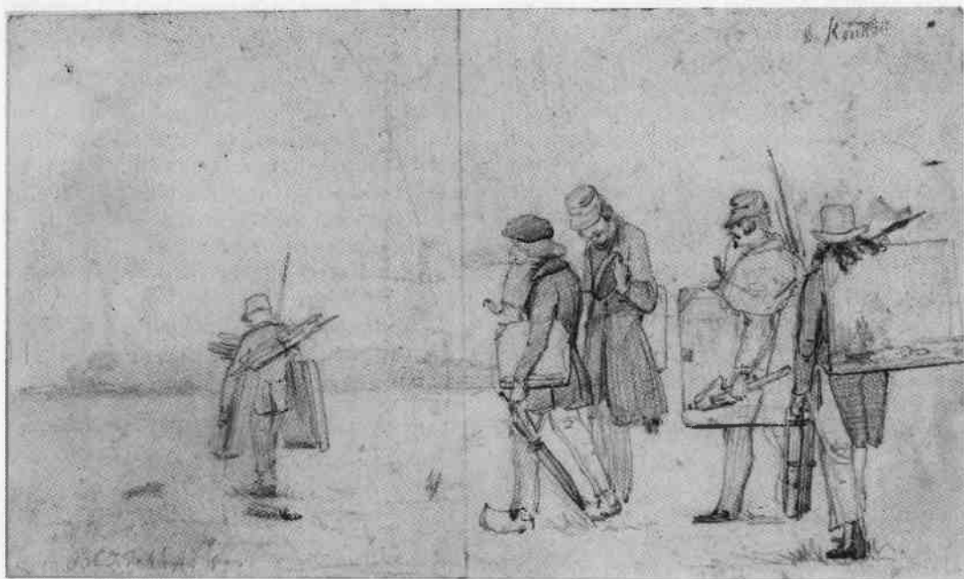
Barend C. Koekoek, De schilder en zijn leerlingen , 1838 (coll. Rijksprentenkabinet).