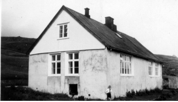
Gamli skúlin á Ströndum

Hann kemur tó mest at starvast sum einalærari á Ströndum.