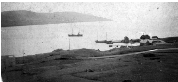
Vit síggja oman á bryggjuna í Heygsstøð

Sóknarstýrið biður Rasmus um fara runt við