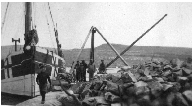
Niðri í Heysstøð

Ein uttansmaður yrkir ein tótt til lagið