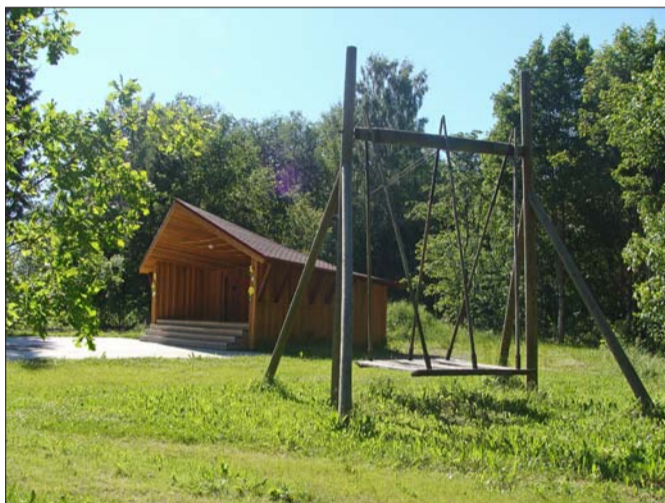
Külakiik ja kõlakoda