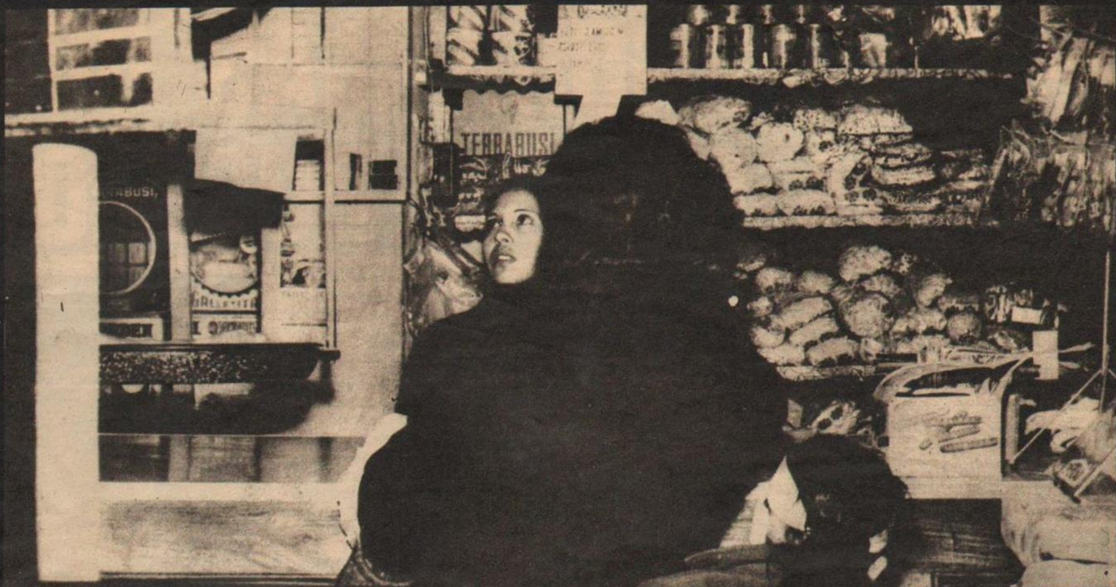
El desabastecimiento es el arma más utilizada por el liberalismo para perseguir al pueblo. Hay que reprimir a ambos brazos de la pinza.

los guerrilleros marxistas los sufrimos todos nosotros.