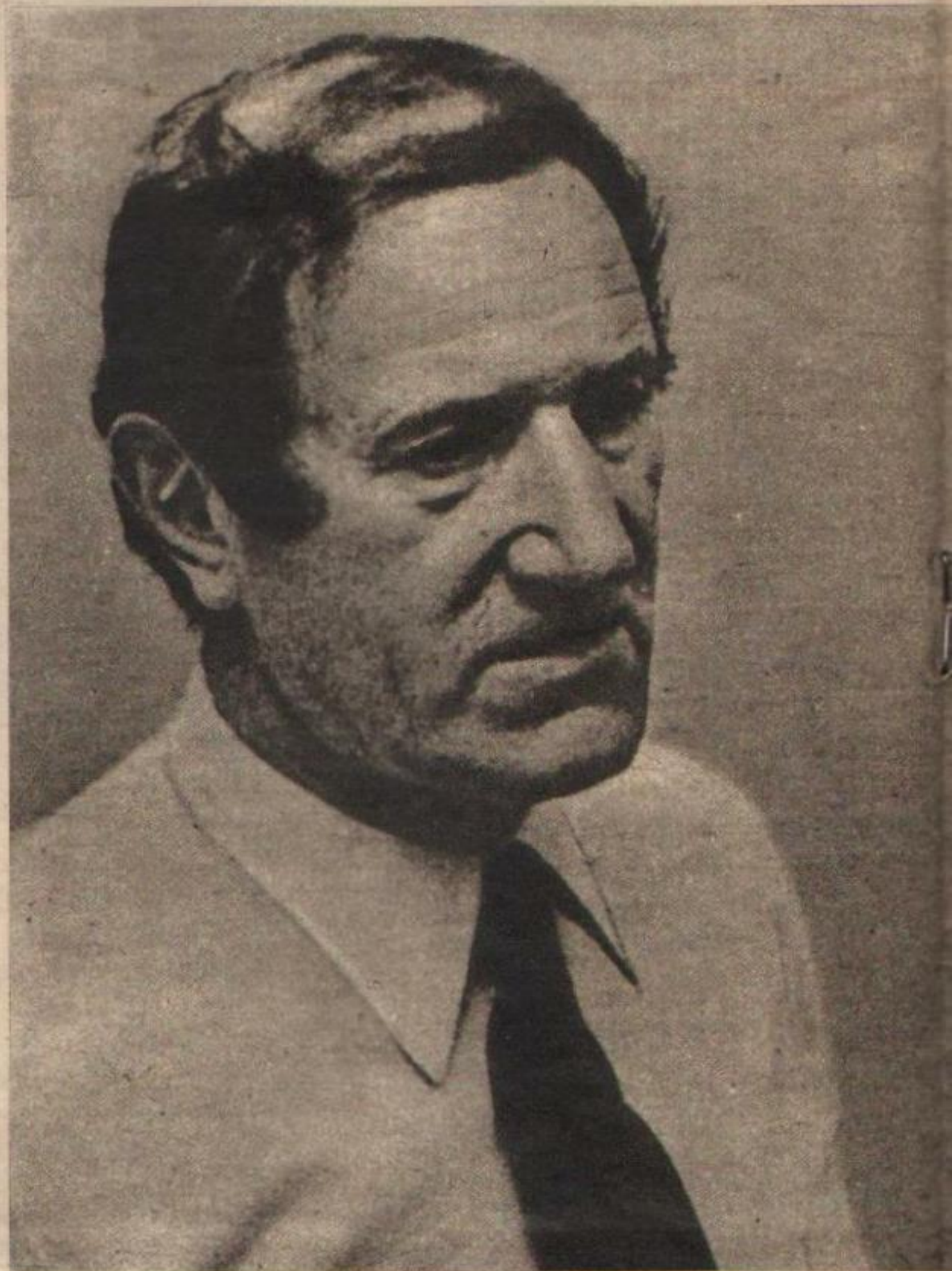
Cepernic: se separa de la mujer para "juntarse" con la tendencia

ART. 1º — Créase en el Anexo: Gobernación