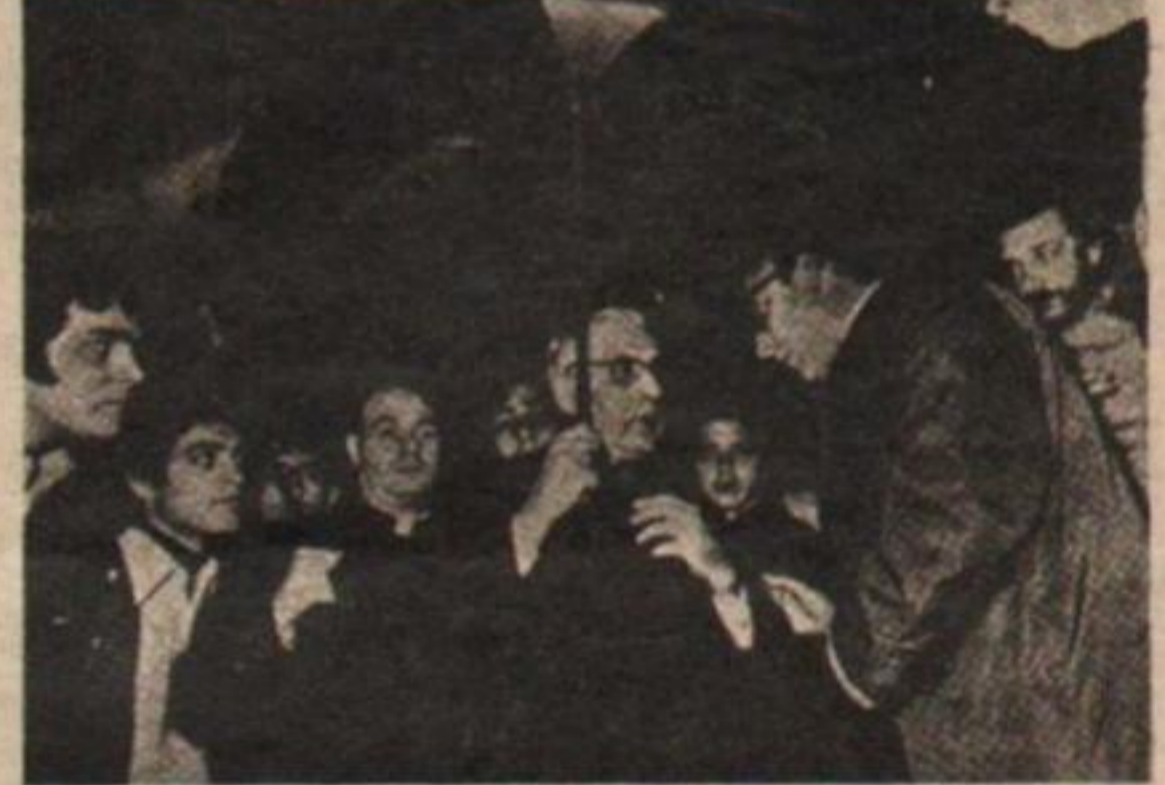
Monseñor Aramburu deploró el hecho y condenó la violencia