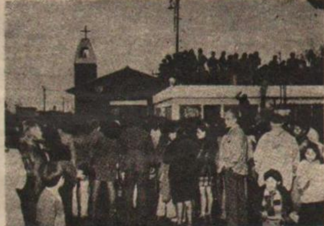
Una multitud se hizo presente para despedir al cura asesinado

La Juventud Peronista Regional I, dio a conocer