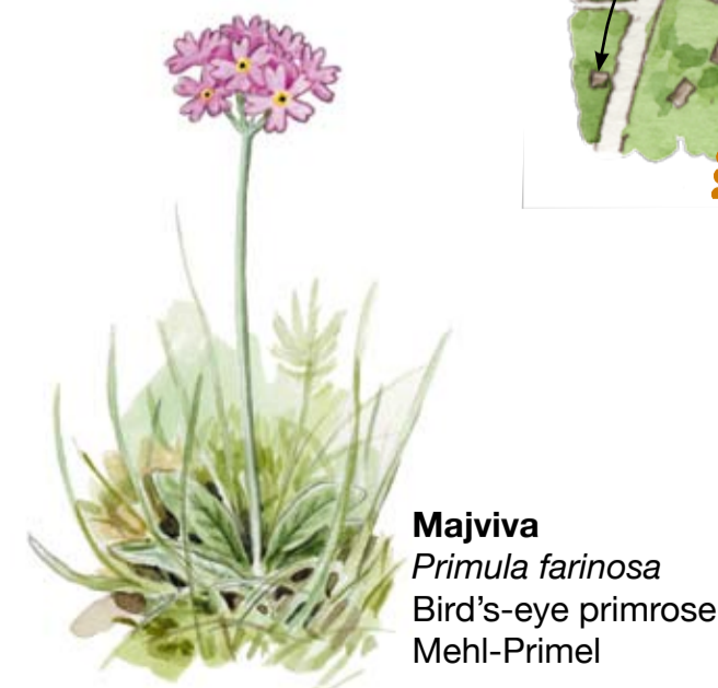
Majviva Primula farinosa Bird's-eye primrose Mehl-Primel

Klöverärt är en specialitet för Östersjöns havsstrandängar. Den förekommer sparsamt från Skåne till Öland och Gotland