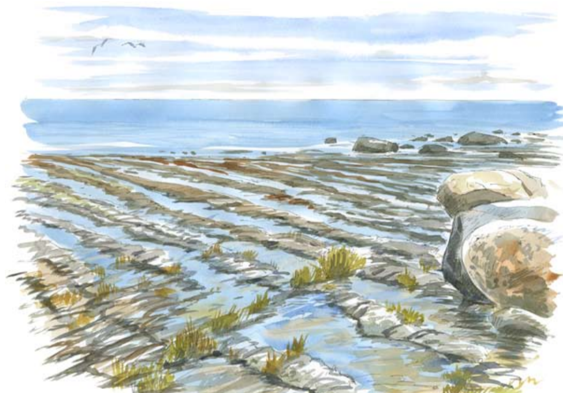
Förstenade böljeslagsmärken i sandstenen - spår av vågskvalp för över 500 miljoner år sedan.

I brytningen mellan land och hav uppstår en mängd olika miljöer som utnyttjas av många olika arter. På Simris strandäng växer både tåliga havsstrandväxter och kräsna orkidéer. Utpräglade kustfåglar blandas med inlandets fåglar, särskilt under höst- och vårsträck.