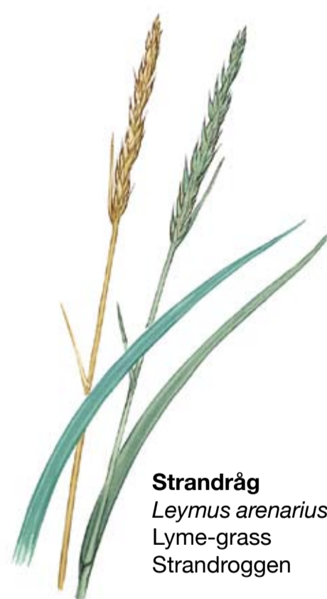
Strandråg Leymus arenarius Lyme-grass Strandroggen

Öppna marker. På 1800-talet var Simris strandäng en helt öppen betesmark. Sedan dess har den delvis växt igen med buskar och träd. För att gynna områdets speciella flora, som behöver öppna, betade marker, kommer snåren av vresros att bekämpas och övriga träd och buskar att hållas efter.