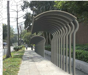
擬建之有蓋行人路徑往巴士總站、輕鐵站及西鐵站，預計於2016年內完成