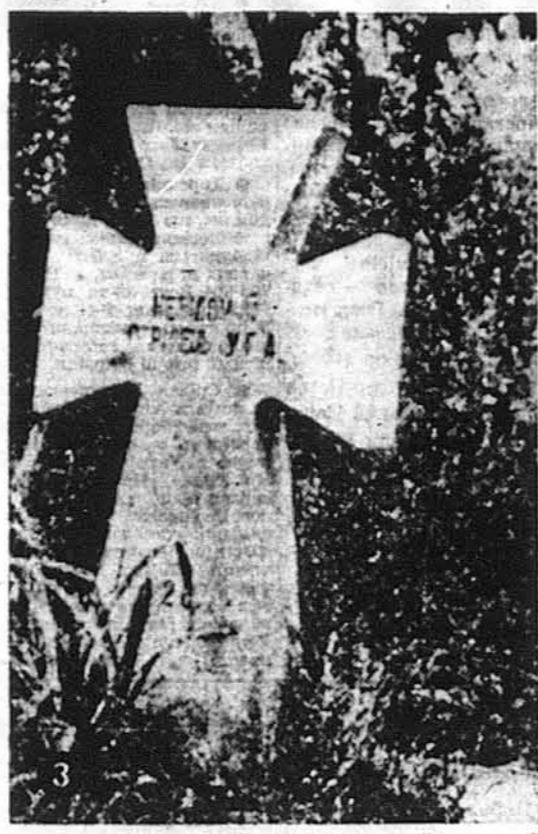
Хрест на могилі українського Невідомого Воїака у Львові на Янівському кладовищі.