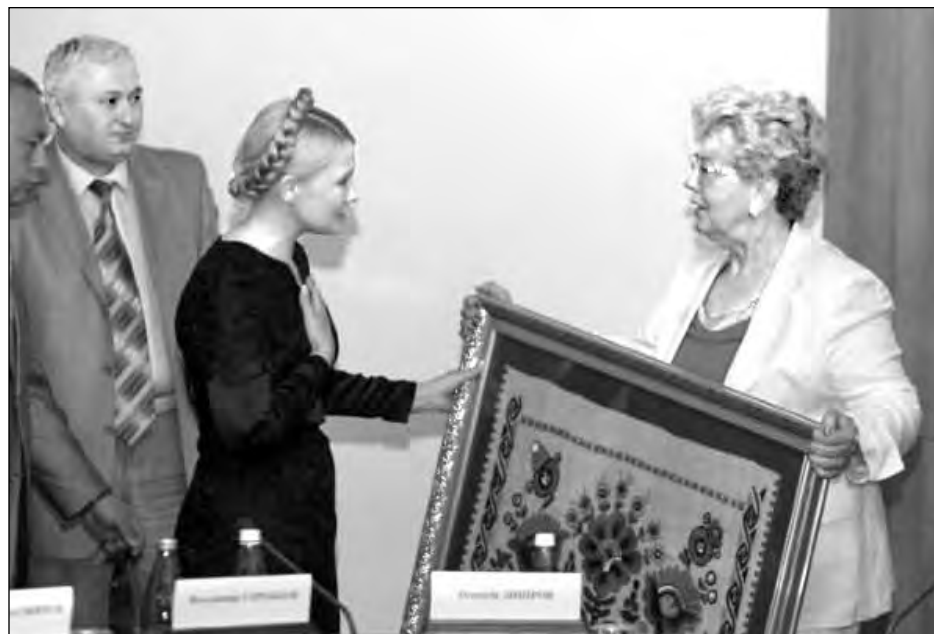
Голова Світової Федерації Українських Жіночих Організацій, другий заступник президента СКУ Марійка Шкамбара дарує картину Прем'єр-міністрів України Юлії Тимошенко під час зустрічі в Києві.