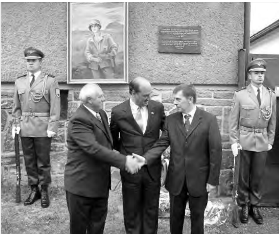
Староста села Орябина Микола Каня, Посол США у Словаччині США Рон Валей та військовий аташе Посольства Джон Веласі перед рідною хатою Михайла Стренка в Орябині. Травень 2007 року.