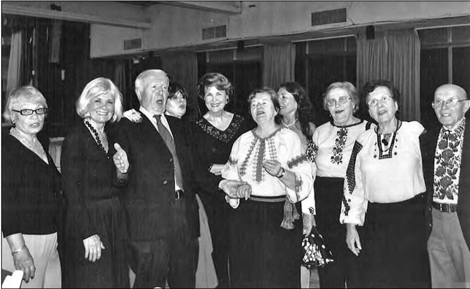
Після бенкету сеньйори зібралися, щоб заспівати пісень.