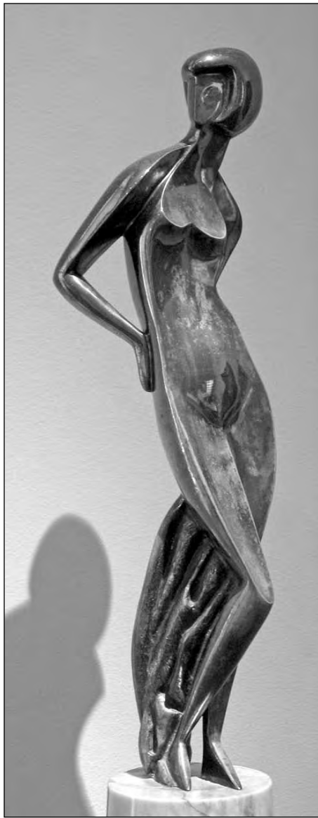
Скульптура Олександра Архипенка „Грація” в Галерії мистецтва країн Європи і Америки XIX-XX ст...

Приємною несподіванкою була на одній з бічних вулиць велика (удвічі більша за оригінал) копія на пластику славнозвісної картини Іллі Рєпіна „Запорожці пишуть листа турецькому султанові”. Виявилось, що це реклама Санкт-петербурзького Російського музею,