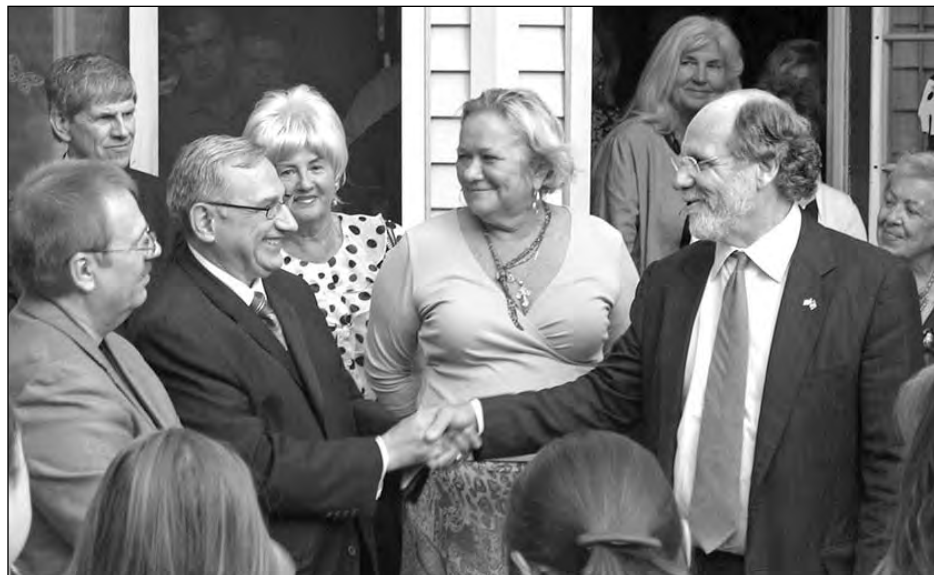
Губернатора Нью-Джерзі Джана С. Корзайна (праворуч) вітають в домі Камілі Гук-Масер (зліва) Михайло Козюпа, Пітер Іглер і К. Гук-Масер.

кресливши роллю, що її відіграли поляки під час утвердження цієї країни.