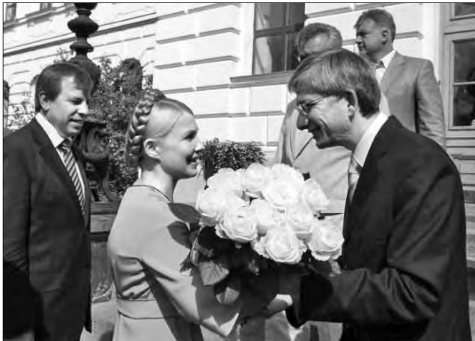
Президент СКУ Євген Чолій (праворуч) вітає Прем'єр-міністра України Юлію Тимошенко під час з'їзду у Львові.

У перший день зборів прозвучали вітання Архієпископа Львівської єпархії Української Греко-Католицької Церкви Ігоря Возняка, президента СКУ Євгена Чолія, ректора Національного університету „Львівська Політехніка” Юрія Бобала, голови Світової Федерації Українських Жіночих Організацій Марії Шкамбари, голови Української Всесвітньої Координаційної Ради Дмитра Павличка, начальника Управління з питань закордонного україн-