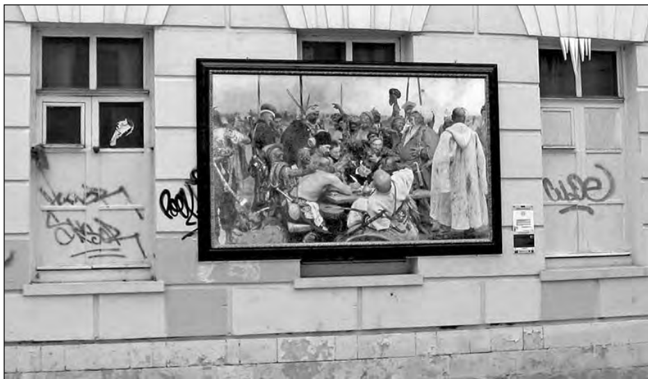
Копія картини Іллі Рєпіна „Запорожці пишуть листа турецькому султанові”, що зберігається в Санкт-петербурзькому Російському музеї, виставлена на одній з вулиць Москви.

Майже немає творів українського мистецтва і в Музеї образотворчих мистецтв ім. Олександра Пушкіна та у його філії „Галерії