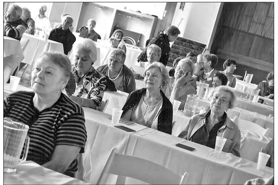
Під час денної сесії з'їзду сеньйорів Українського Народного Союзу в залі „Веселки“ на Союзівці.