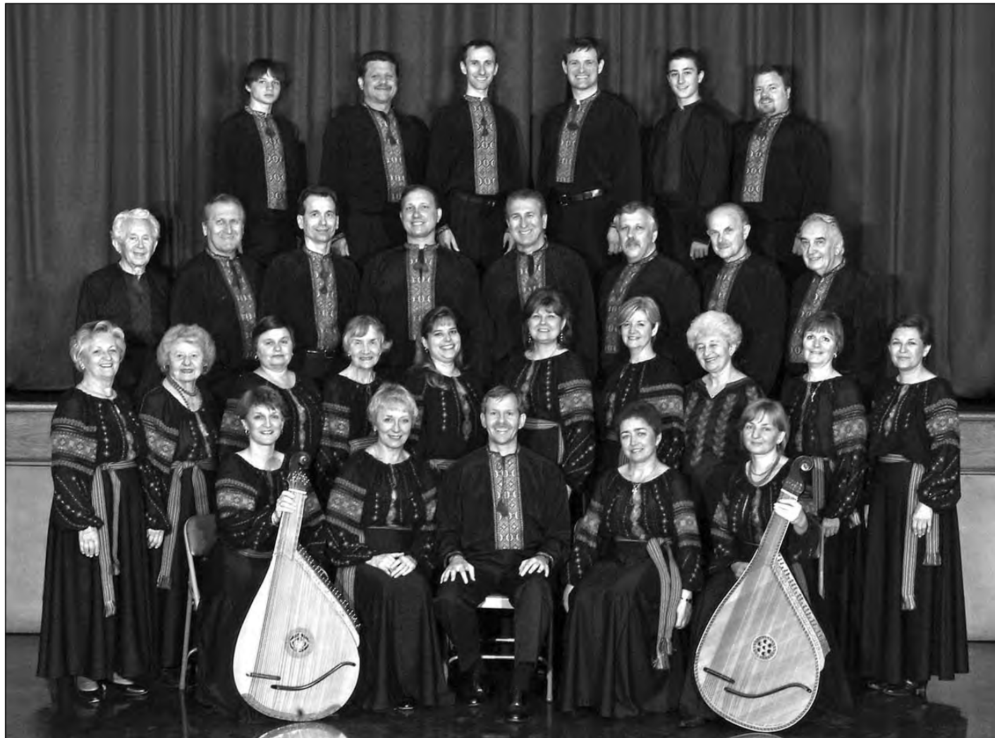
Український вокальний ансамбль „Євшан“ з Коннектикату.

ВАШІНГТОН. – 10 жовтня, о 7:30 год. вечора, Українська католицька парафія Пресвятої Родини відзначатиме 60-ліття. З цього приводу відбудеться концерт українського літургійного співу у виконанні Українського вокального ансамблю „Євшан“ з Коннектикату. Концерт представляє нагоду почути вибір музики з трьох століть українського церковного співу в акустично досконалому приміщенні Українського католицького крайового собору (4250 Harewood Rd. NE, Washington, DC).