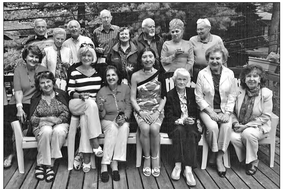
Спільна світлина учасників з'їзду сеньйорів на Союзівці.