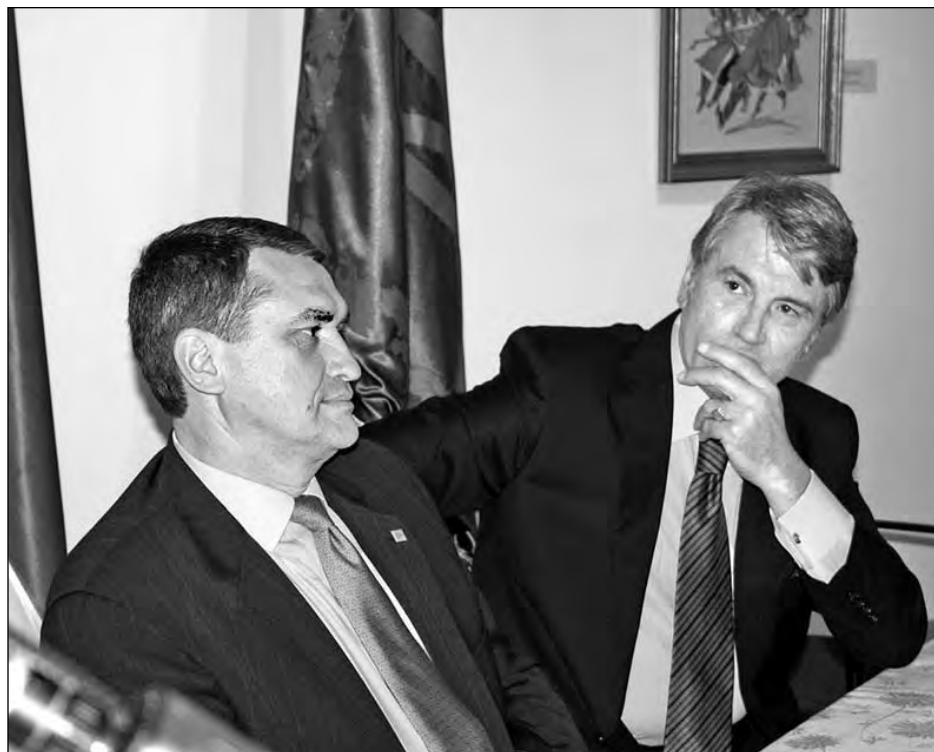
Посол України в США Олег Шамишур і Президент України Віктор Ющенко під час зустрічі з представниками української громади.

Продовження фоторепортажу про зустріч в Українському музеї і вручення державних нагород – в наступному числі „Свободи“