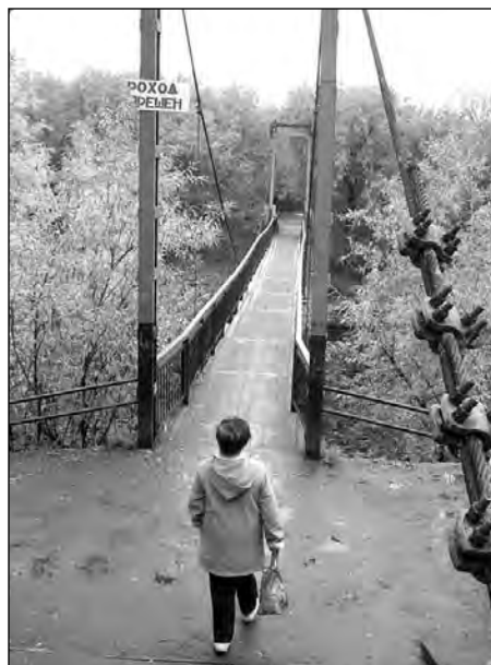
Місток через канал, викопаний ув'язненими жінками.