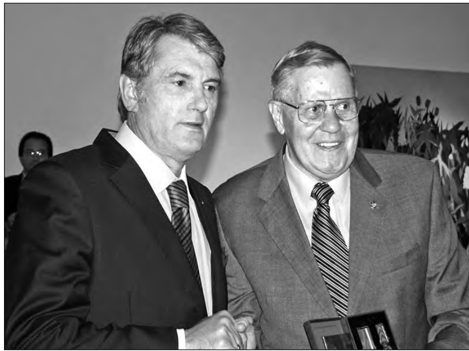
Президент України Віктор Ющенко вручає орден „За заслуги“ громадському діячеві Мироні Куропасеві, Почесному членові Головного уряду Українського Народного Союзу, колишньому першому заступникові президента і колишньому головному радному УНСоюзу.