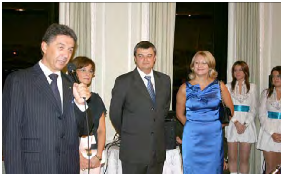
На прийнятті в Нью-Йорку (зліва) Постійний представник України при ООН, Посол Юрій Сергеев з дружиною Наталею, Генеральний консул України в Нью-Йорку Посол Сергій Погорельцев з дружиною Світланою, дуєт „Сестри Орос“.