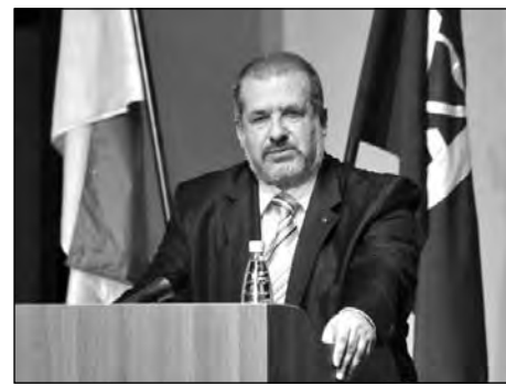
Світлина: Рефат Чубаров під час виступу в НаУКМА.

Новий навчальний рік розпочався традиційною інавгураційною лекцією нового почесного професора НаУКМА, відомого українського політика і громадського діяча, заступника голови Меджлісу (вищого представницького органу кримсько-татарського народу), президента Всесвітнього конгресу кримських татар, депутата Верховної Ради Криму Рефата Чубарова. Його лекцію „Кримсько-татарська проблема – іспит для українських політиків“ з цікавістю