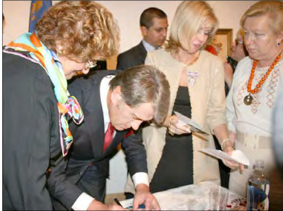
Президент України Віктор Ющенко під час зустрічі з представниками української громади 22 вересня в Українському музеї Нью-Йорку.

Перед початком зустрічі В. Ющенко оглянув виставку творів