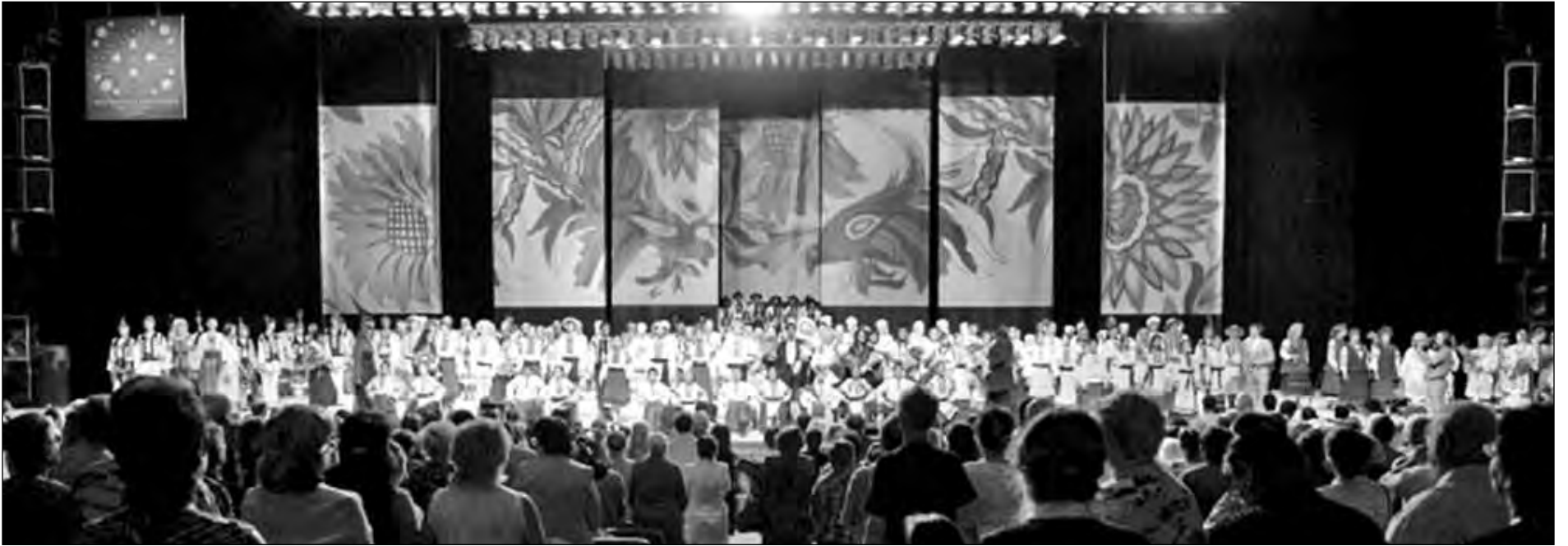
Мистецьке дійство закордонного українства у столичному Палаці „Україна“.