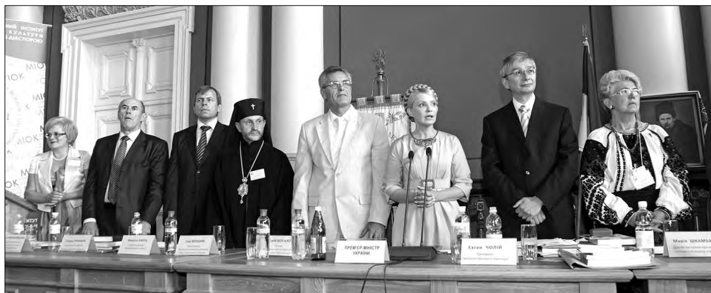
Президія річних загальних зборів СКУ у Львові.