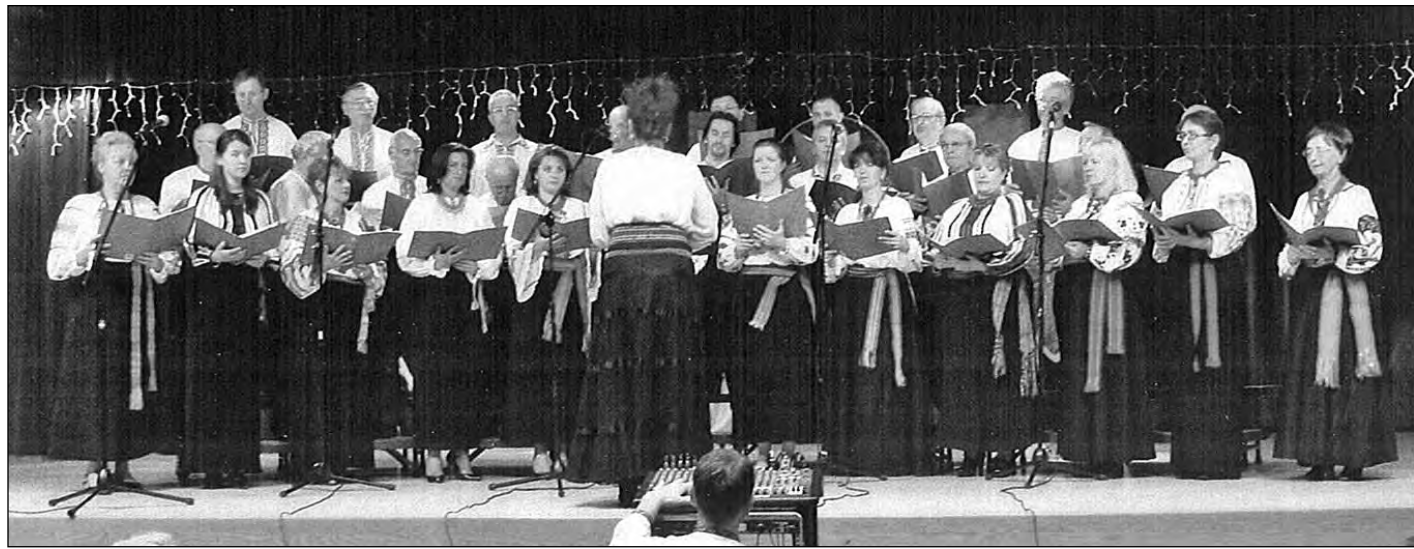
У Клівленді співає хор „Дніпро”.