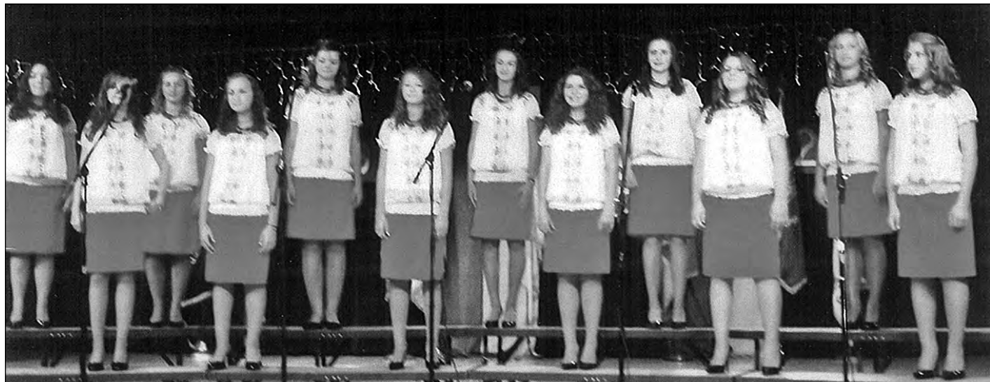
У Клівленді виступила старша група парафіяльного дитячого хору Церкви св. Покрови в Пармі.